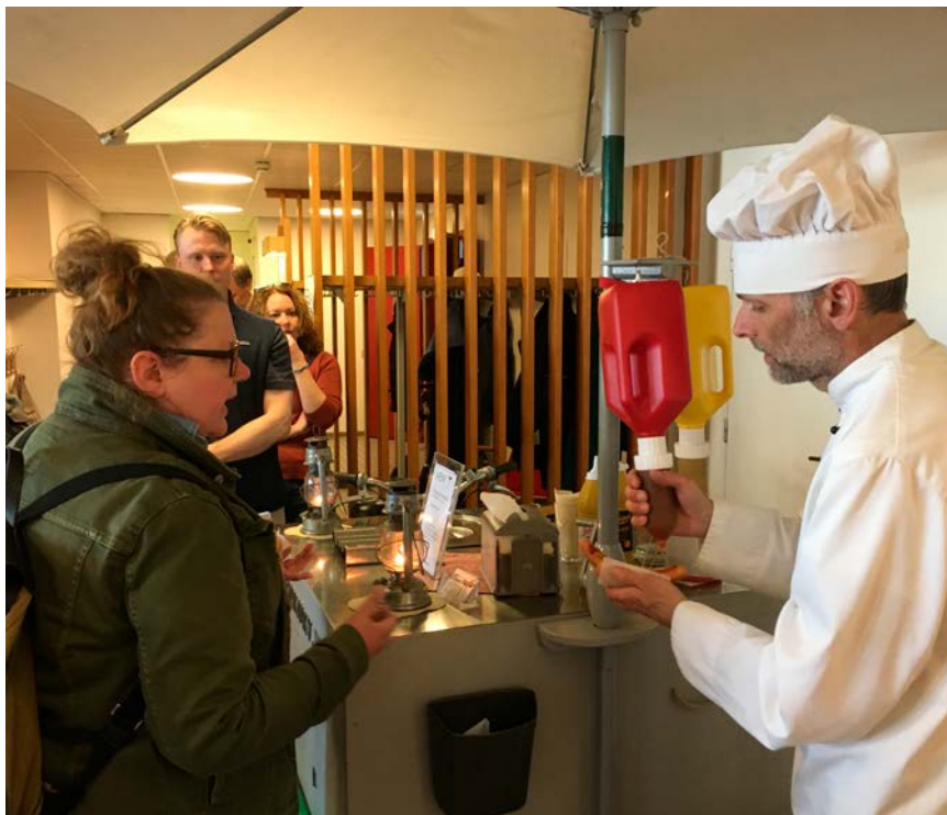
Kön till cykelkorvkiosken som flyttat in i Masthuggets hus var lång.