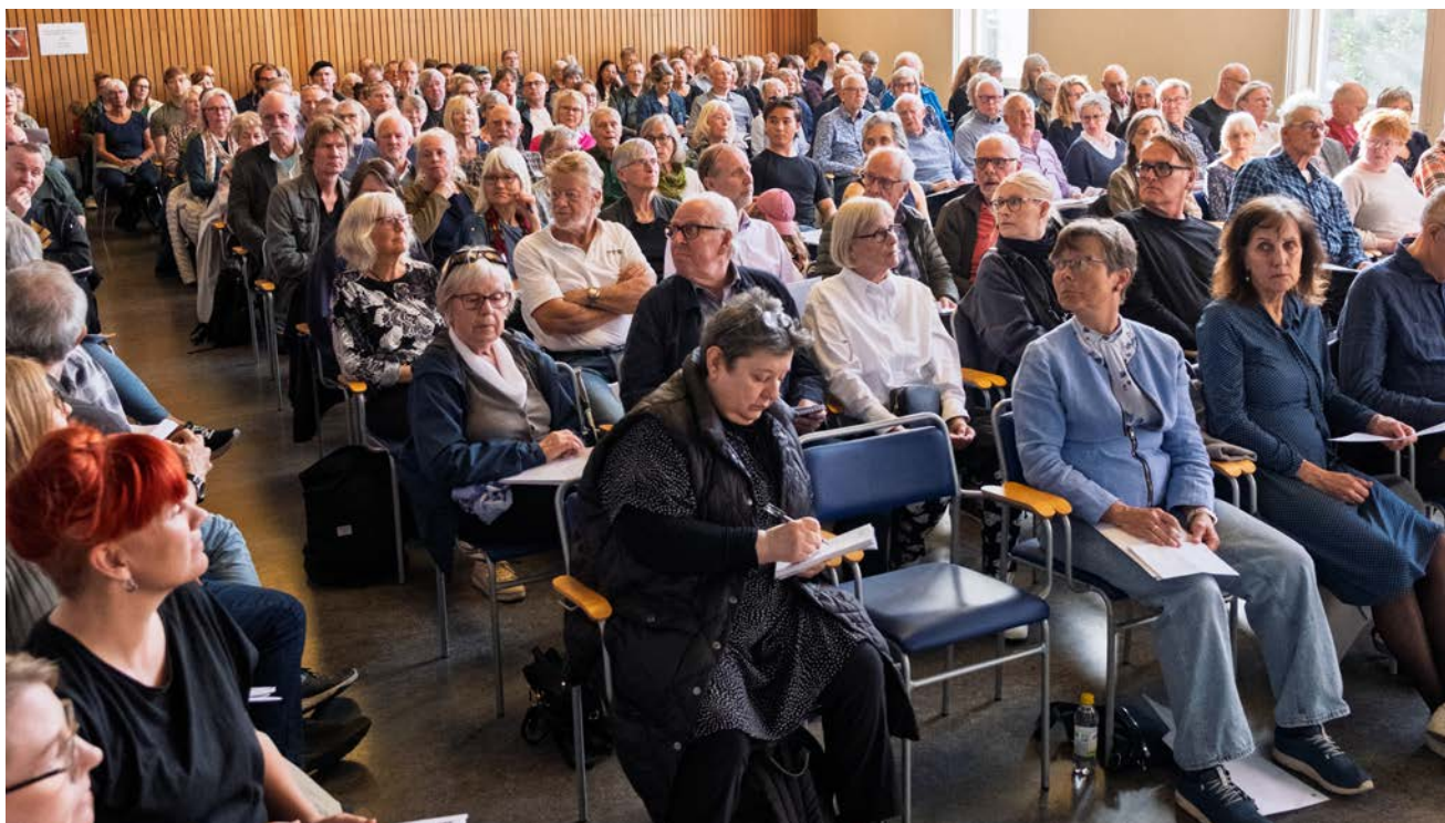
Stora salen fylldes vid årsstämman den 27 april.