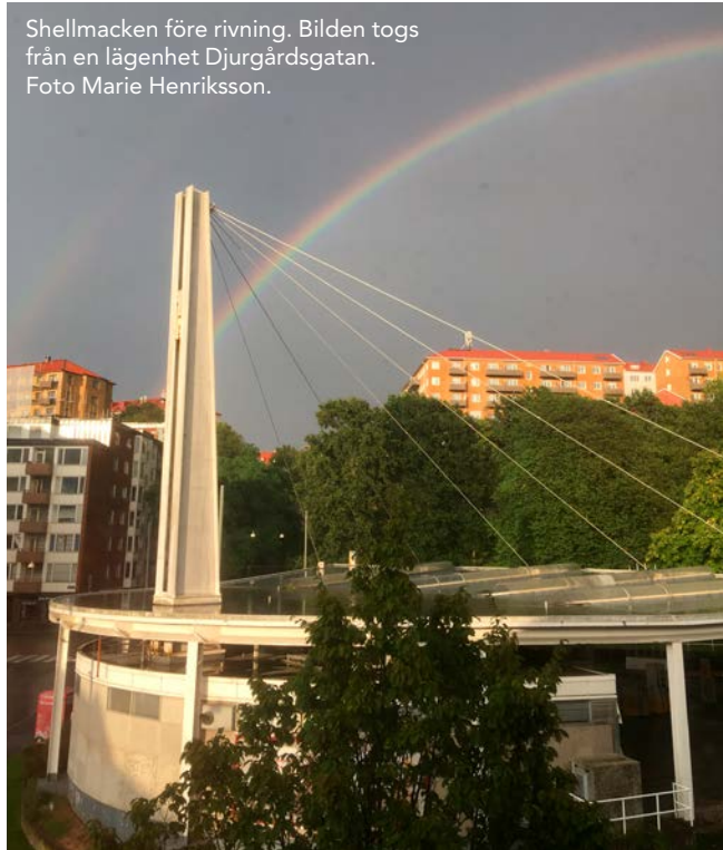
Shellmacken före rivning. Bilden togs från en lägenhet Djurgårdsgatan.