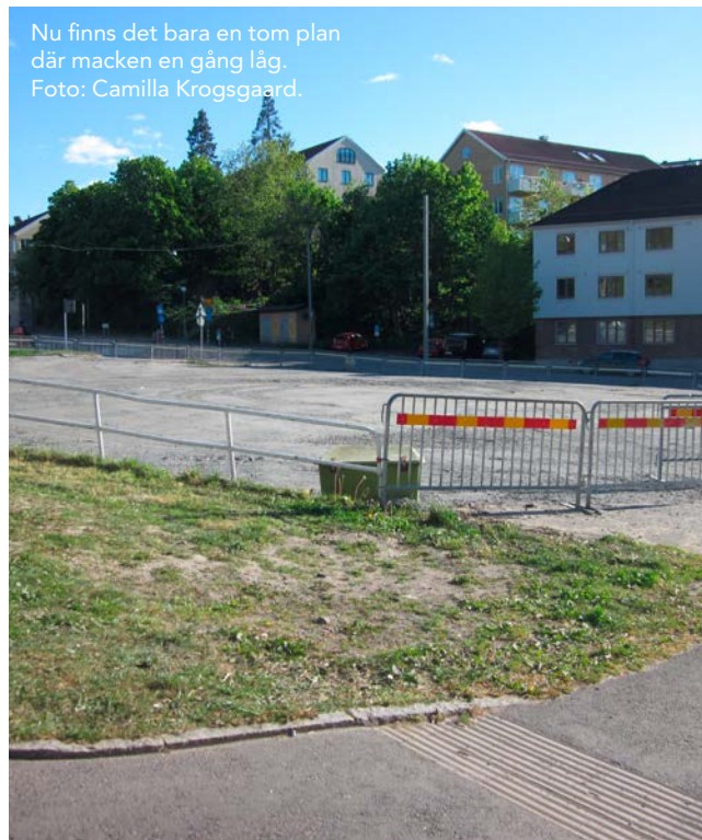
Nu finns det bara en tom plan där macken en gång låg.