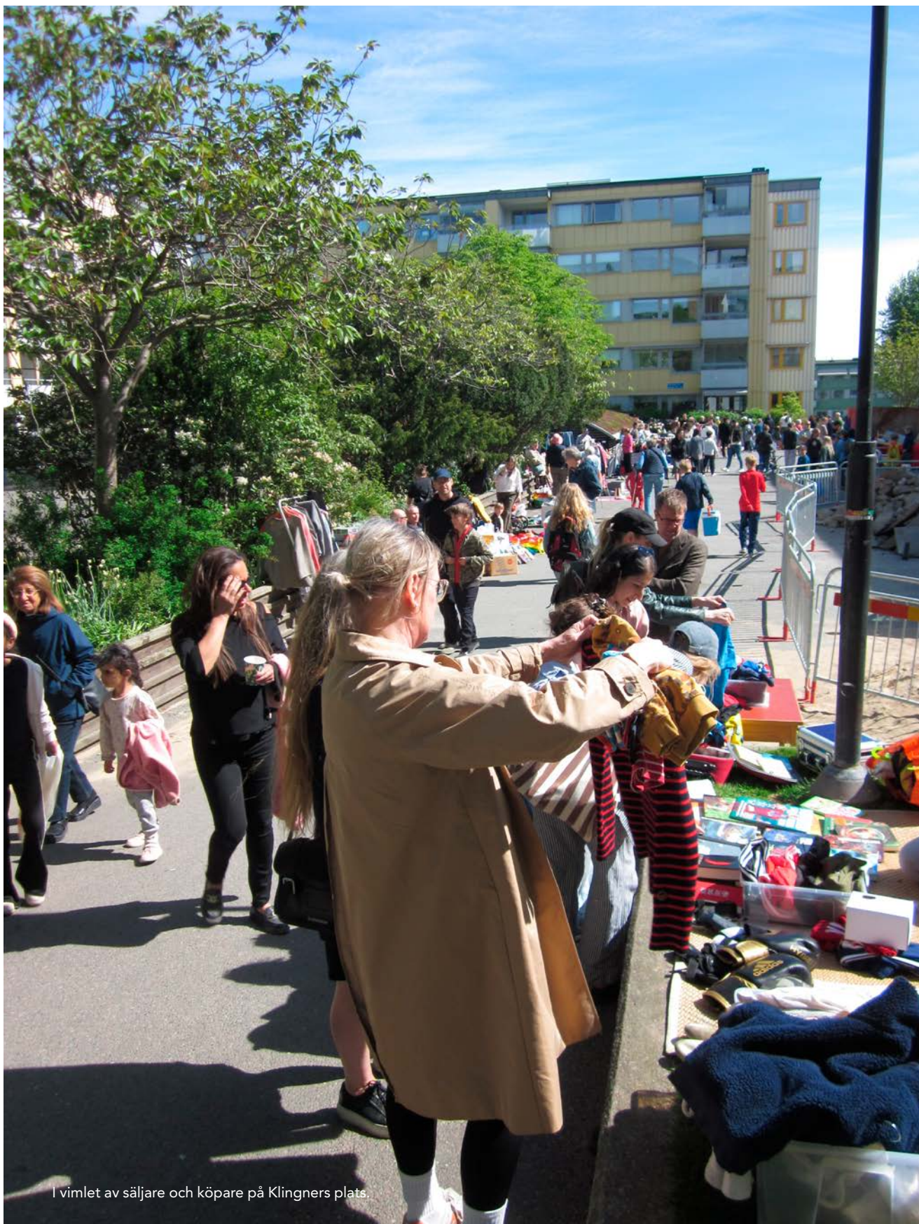
I vimlet av säljare och köpare på Klingners plats.