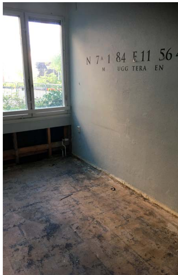
Limmet som finns under golvmattorna innehåller asbest och måste slipas bort till betongrent.