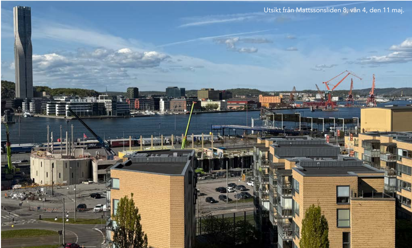
Utsikt från Mattssonsliden 8, vån 4, den 11 maj.