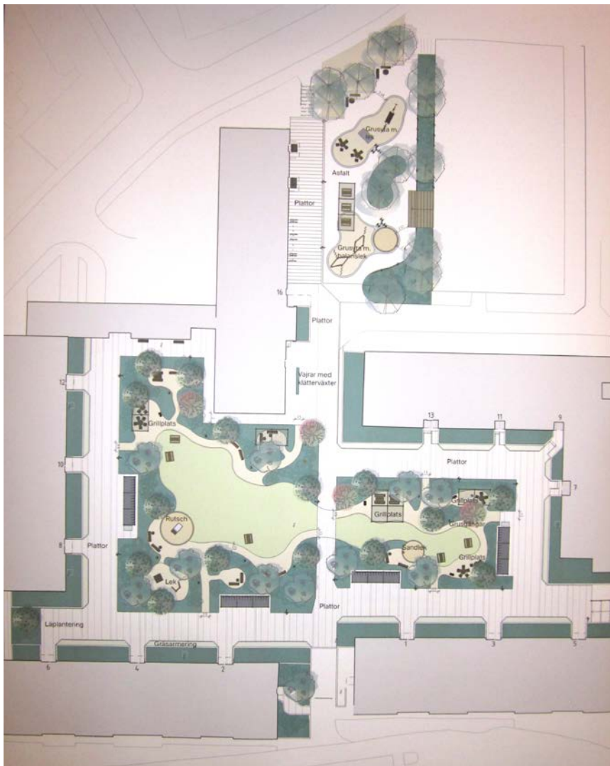
Landskapsgrupps illustrationsplaner för Vaktmästaregången gårdar.

darna visades och boende fick tycka till om förslagen. Det blev mycket diskussion även på detta möte.