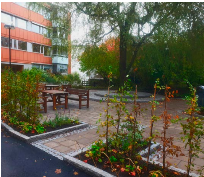
Under hösten 2024 blev gården på Skepparegången 2–8 klar och fick nya planteringar och möbler. Bilden till vänster är tagen den 10 oktober och den andra den 26 april i år.