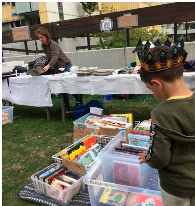
På loppisen fanns fynd för stora och små.