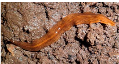
Så här ser den ut, den invasiva lövplattmasken.

Denne rovlevande plattmask livnär sig på daggmaskar, sniglar och snäckor. En ned-satt population av daggmaskar skulle kunna innebära försämrade jordar och därmed också försämrade skördar. Därför kan plattmasken vara ett hot mot den svenska livs-medelsproduktionen.