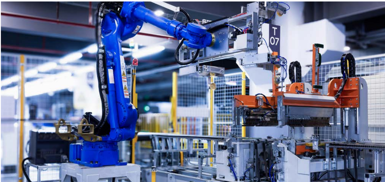
Företagets mjukvara finns bland annat i industrirobotar.