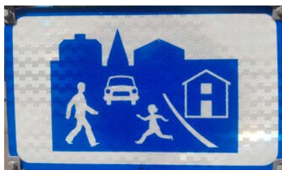
Max 7 km/h. Gångfartsskyltar har satts upp vid infarterna.

Att önska nyinflyttade välkomna med en blomma tas upp igen efter önskemål från gårdsombuden. Det har redan skickats listor två gånger, efter att det legat nere under pandemin. Men nu kommer förvaltningen att skicka ut en lista varannan månad till gårdsombuden med namn och adress på