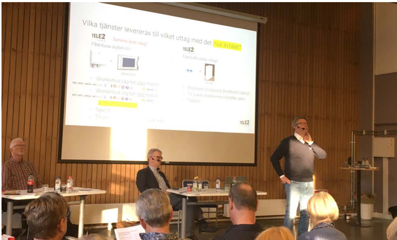
En representant för Tele2 förklarade vad avtalet om bredband och tv innebär.