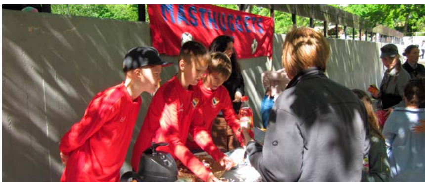
Masthuggets BK:s lag P13 stod för fika och grillad korv.