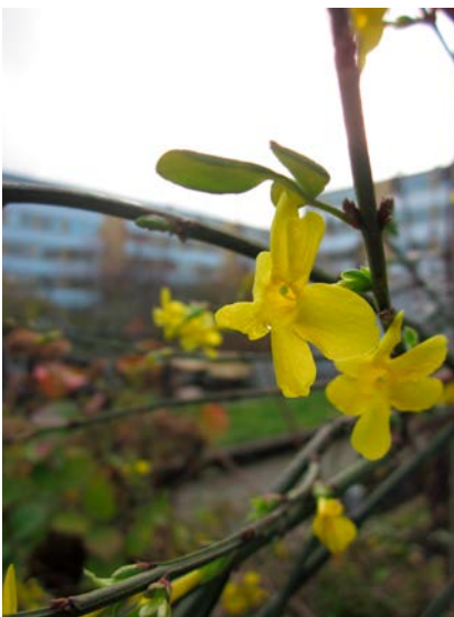
Blommande forsythia redan i november.

Under årens lopp har varierande önskemål om något som berör utemiljön framförts i