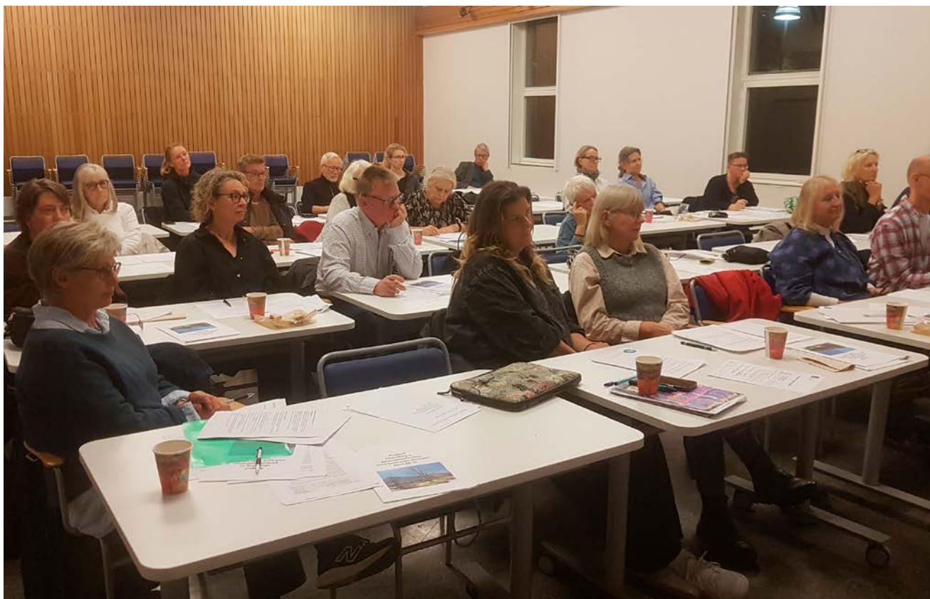
17 gårdsombud samt styrelseledamöter och förvaltningspersonal hade samlats i Masthuggets hus.