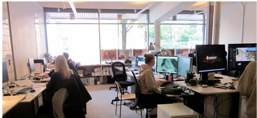
Runt 15 personer arbetar på arkitektstudion. Delar av inredningen från den tidigare verksamheten, som arrangerade matlagningskurser, är bevarad.

– Vårt mål är att skapa en kreativ arkitektur som förenar kundnytta med samhällsnytta, till glädje för den enskilda människan. Vi har specialiserat oss på utformning av