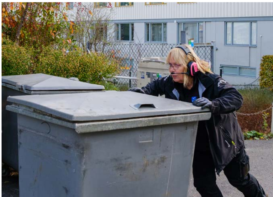
Sophanteringen är ett tungt arbete.

soporna, men samtidigt ska det finnas en plats som inte förfular gården eller området alltför mycket.