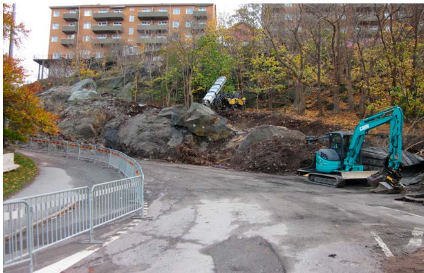
Fjällgatan ner mot Bangatan ska vidgas med fem meter för att göra plats åt både gång- och cykelbanor.

Vi får se om det blir mindre svettigt i de nya banorna. Kleva kommer i alla fall fortfarande att vara lika brant för oss att ta sig nedför och uppför, och kanske till och med något brantare då en del av kurvan verkar försvinna.