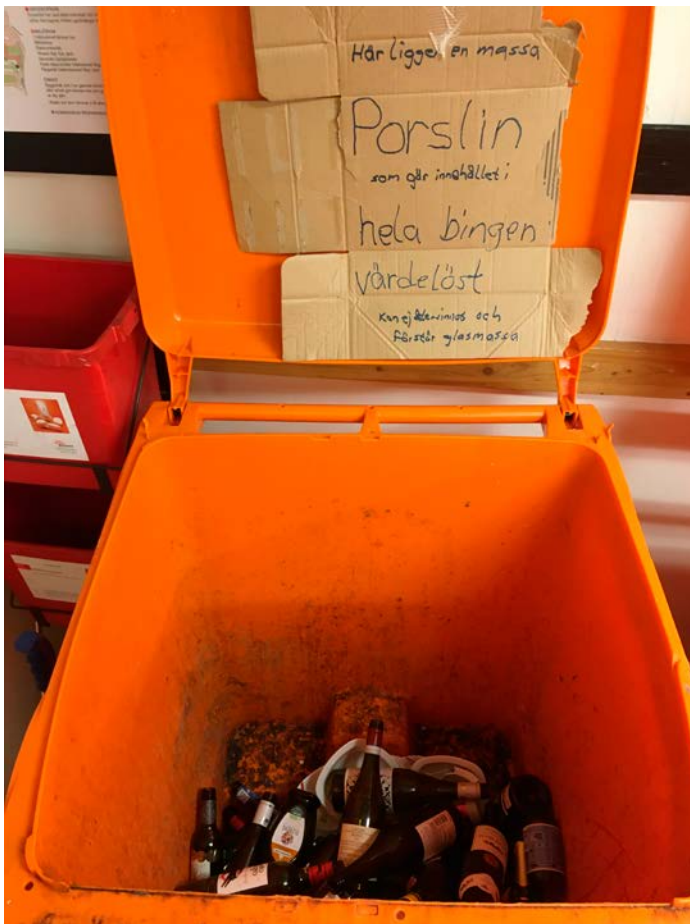
En boende har sett att porslin lagts i kärlet för glas och vill uppmärksamma andra som besöker återvinningsrummet på detta.

Lägg inte porslin i kärlet för glasförpackningar!