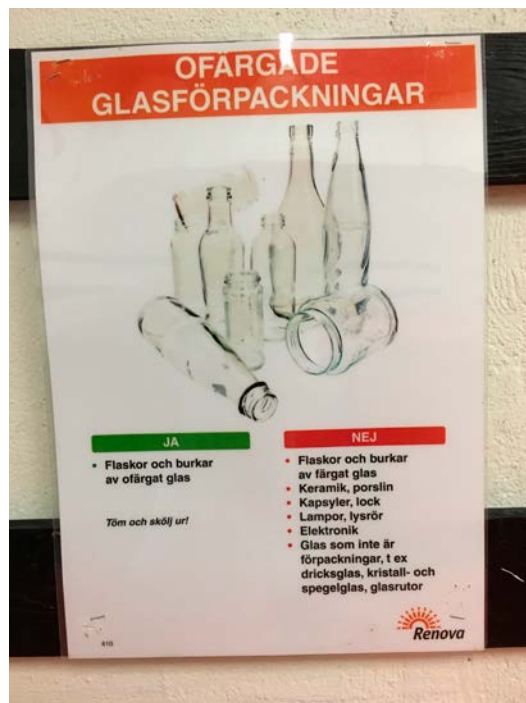
Tyvärr verkar få läsa vad som står på de olika anslagen i återvinningsrummen.

Lägg inte porslin i kärlet för glasförpackningar!