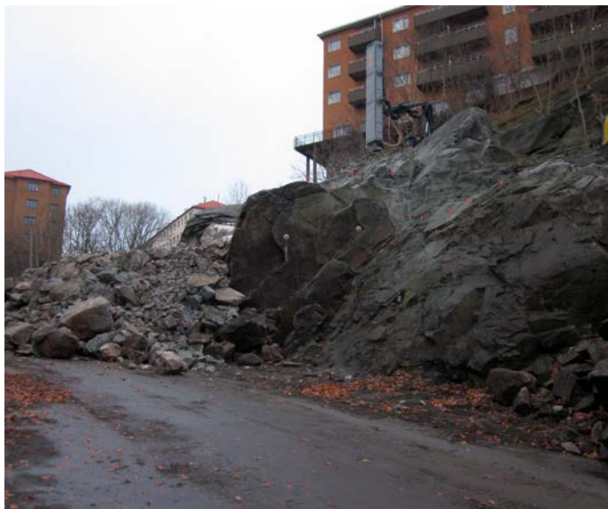
Kleva kommer att få ett helt annat perspektiv när berget inte finns mer.