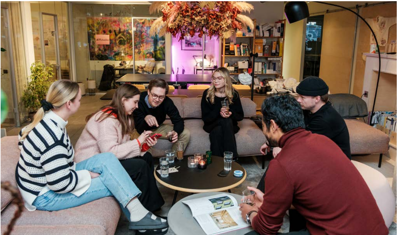
Delar av arkitektgänget har fikapaus.

nande, att fungera på bästa sätt för både konsumenten och de olika affärsverksamheterna.