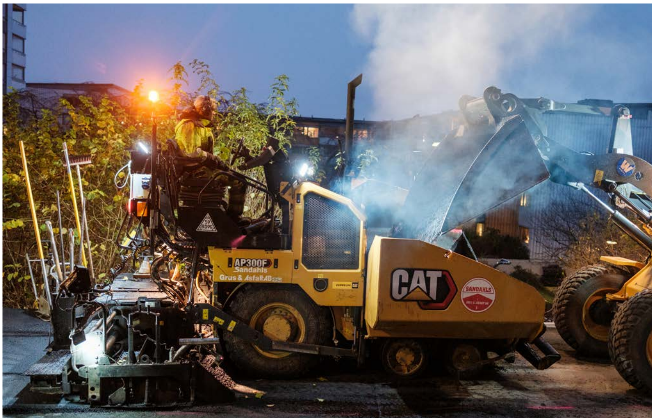
Asfalteringen av stråket påbörjades i november. Efter mycket arbete har trapporna nu kunnat börja användas igen.