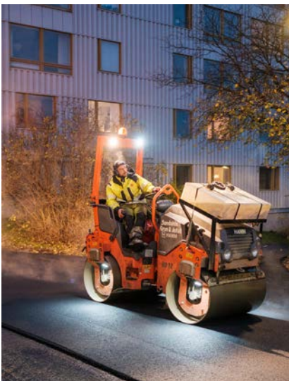
Att få Göteborg stad att renovera Stråket är en av de saker vi lyckats med de senaste tre åren.

Med start Mattssonsliden 2–28 kommer radonmätning ske i föreningen. Det finns ingen lag för hur ofta det skall utföras, men för att säkerställa att det inte har skett någon förändring sen senaste mätningen så kommer cirka 20–25 procent av lägenheterna att mätas under två månader. Förvaltningen kommer delge alla medlemmar, inklusive de som inte haft någon mätning i sin lägenhet, resultaten.