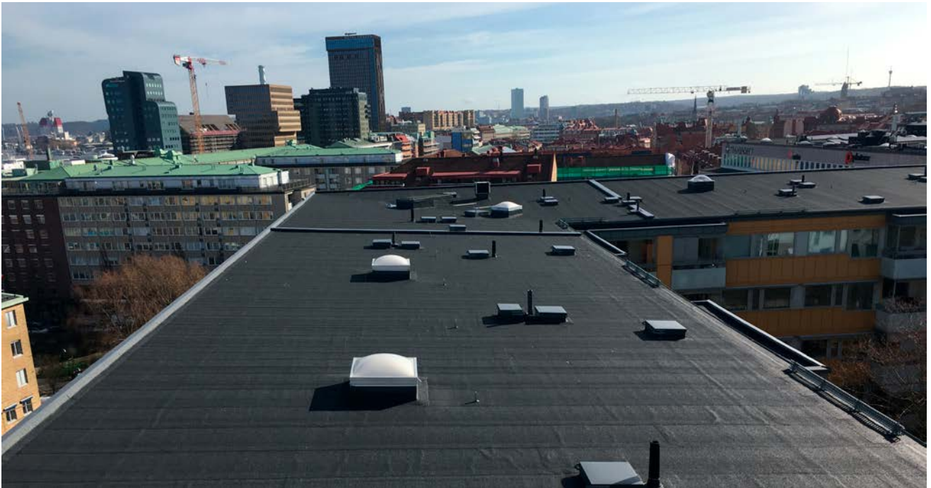
Utsikt över ett av Mattssonslidens nyrenoverade tak. De nya höghusen i bakgrunden.

I slutet av mars 2023 påbörjades reoveringen av våra tak. Och i mitten av maj i år var det klart. Med ny takpapp, och med nya luckor och rännor av plåt ska taken säkert hålla i 50 år till.