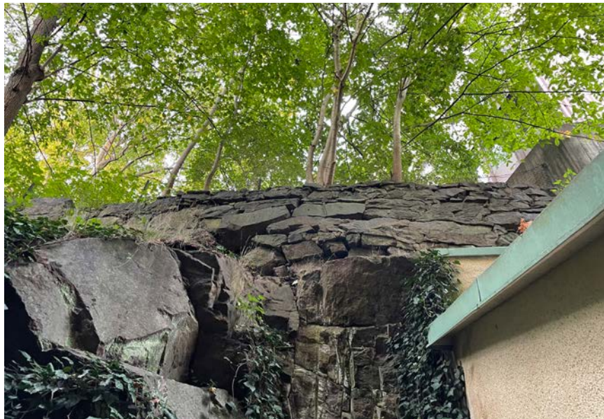
Muren före och efter renoveringen.

De gamla rostiga järndubben vid murens fot byttes ut mot nya i syraffritt rostfritt stål, för att förhindra muren att röra sig.