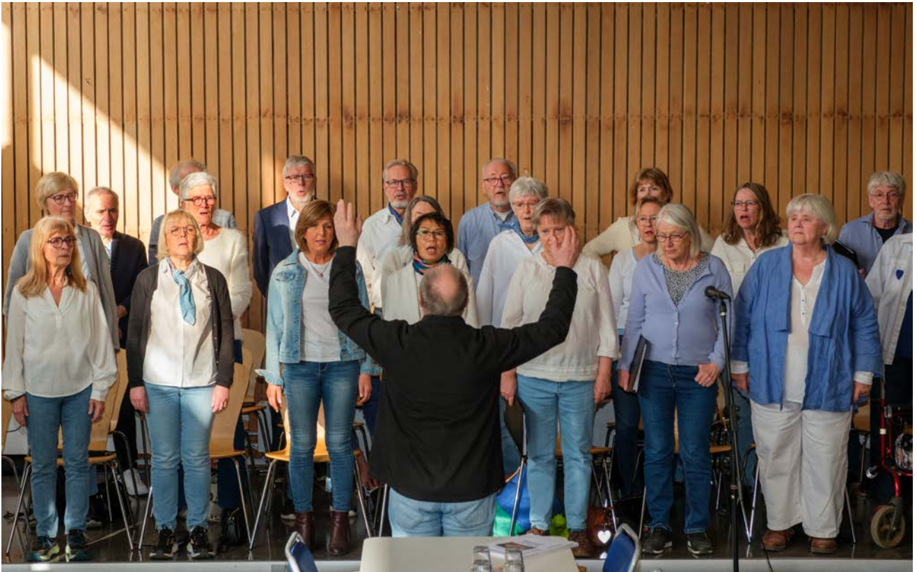
Motvals sjöng sånger om fred, kärlek och frihet.