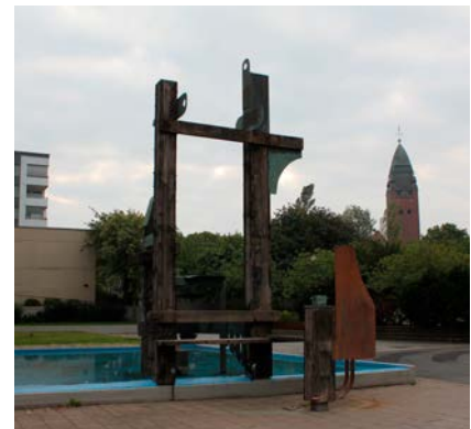
Skötseln av skulpturen vid Klingners plats har varit uppe tidigare. Bild från en artikel i Masthuggsnytt 2018. Foto: Sanja Peter.

Konstverken, som funnits sedan början av 1970-talet utmed Masthuggsliden, har under senaste åren fått förfalla. Motionen var uppdelad i två yrkanden, 1) underhåll och restaurera skulpturerna och 2) ordna med belysning vid skulpturerna så att de framträder tydligt och gör texten synlig.