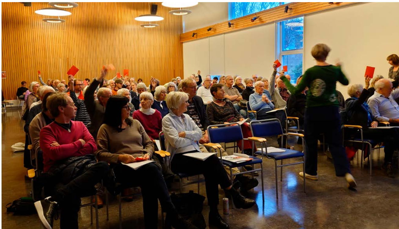
Röstning pågår. Många hade samlats för att delta i årets stämma.