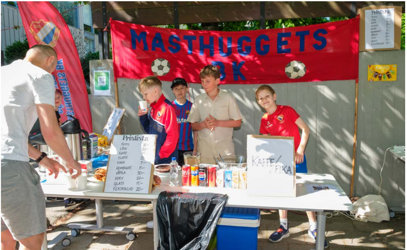
MBK:s tolvåringar drog in pengar till en kommande resa med sitt populära fikastånd.