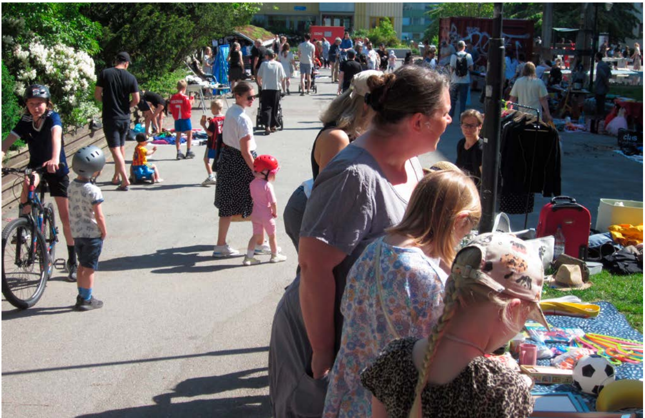
Många samlades runt Klingners plats och fyndade i det fina vädret.