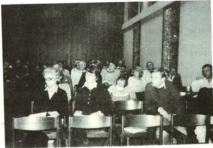
Mötesbesökare på extra årsmötet 23.11.1982