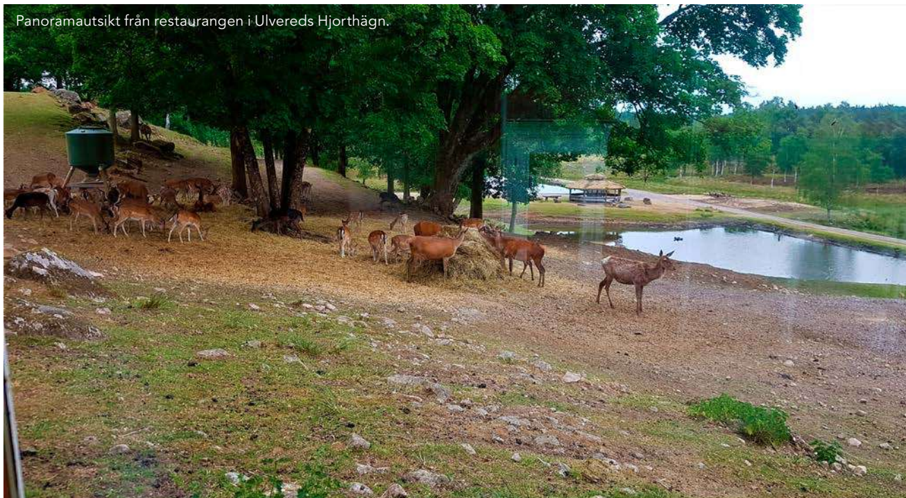
Panoramautsikt från restaurangen i Ulvereds Hjorthägn.