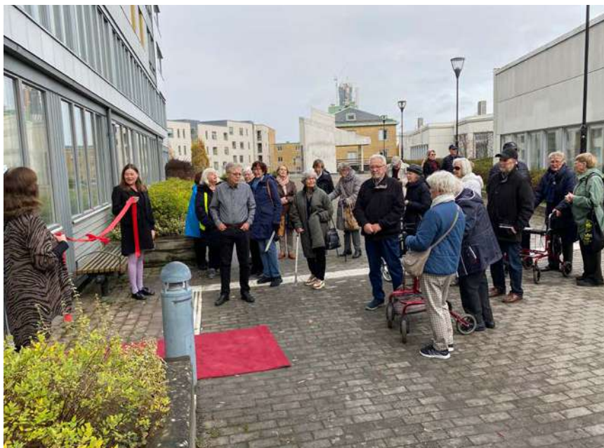
Den 10 november i fjol invigde Synskadades Riksförbund i Göteborg sina nya lokaler på Masthuggsterrassen 4.

Tisdagen den 10 oktober klockan 14–18 är det öppet hus hos vår hyresgäst Synskadades Riksförbund i Göteborg (SRF) på Masthuggsterrassen 4, som flyttade in i sina nya lokaler i november i fjol (se Masthuggsnytt nr 4/2022).