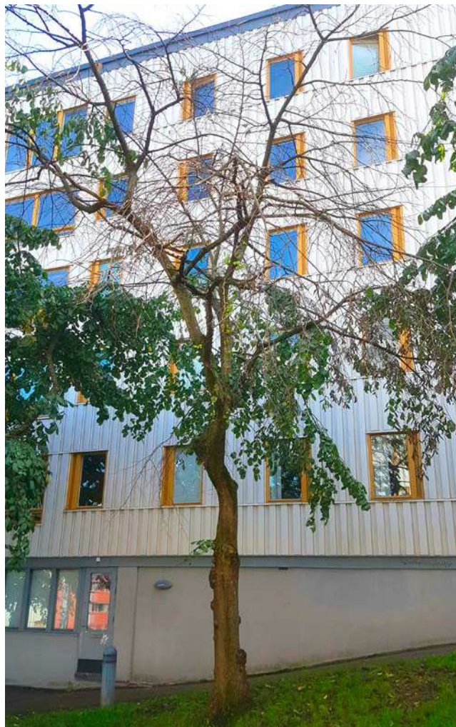
Den döende almen mellan Rangströmsliden och Fyrmästaregången kommer att tas ned.