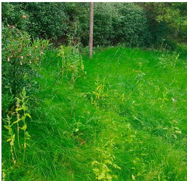
Till vänster ser ni slänten innan gräset slogs och till höger samma slänt efter gräsklippning.