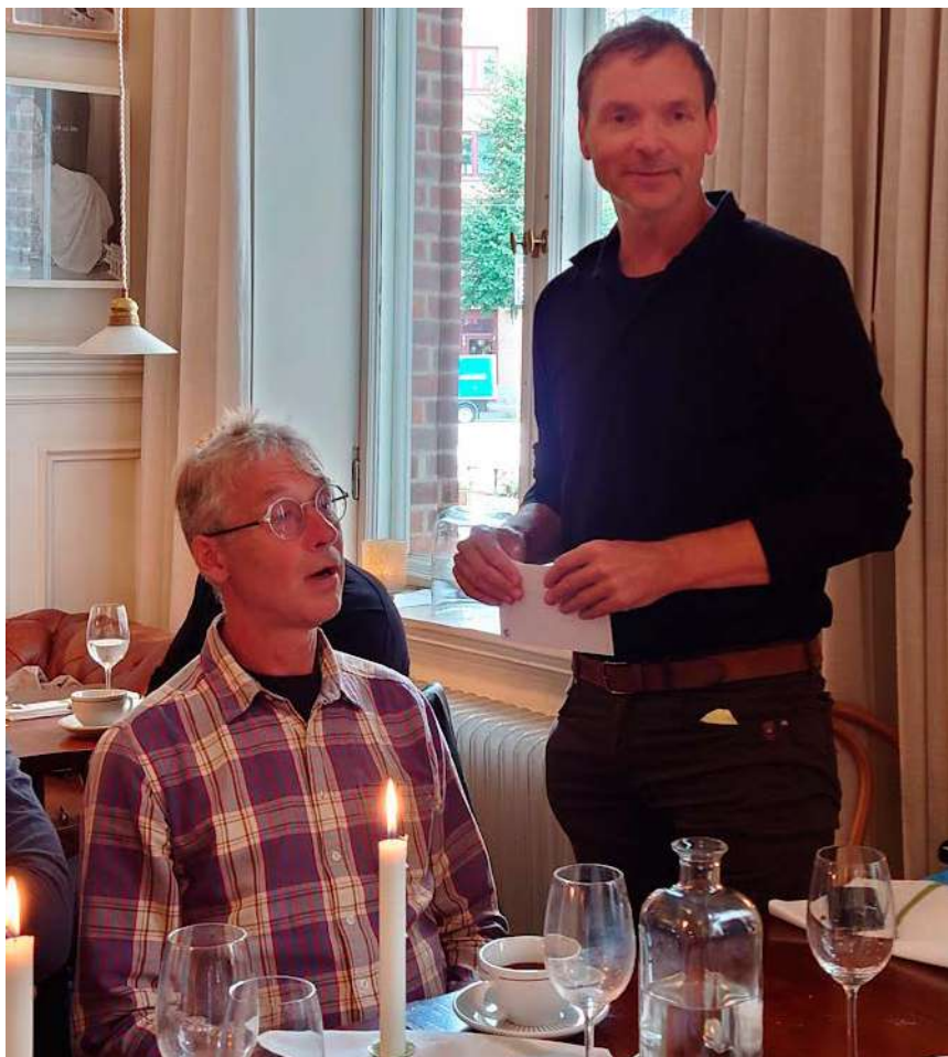
På sin sista arbetsdag, den 31 augusti, avtackades han av sina arbetskamrater på en restaurang i centrala Göteborg.

– Det visar hur viktigt det är att ha ett ledarskap som fungerar. Det gäller att för-