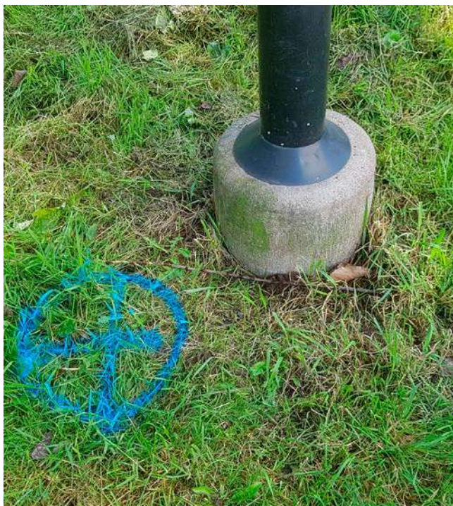
Markering för ny belysning intill de befintliga stolparna.