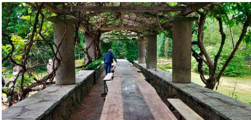
Den magnifika pergolan, byggd av natursten och ekvirke.

Ett långbord var redan dukat i tältet och medan vi fikade berättade Göran om upp-