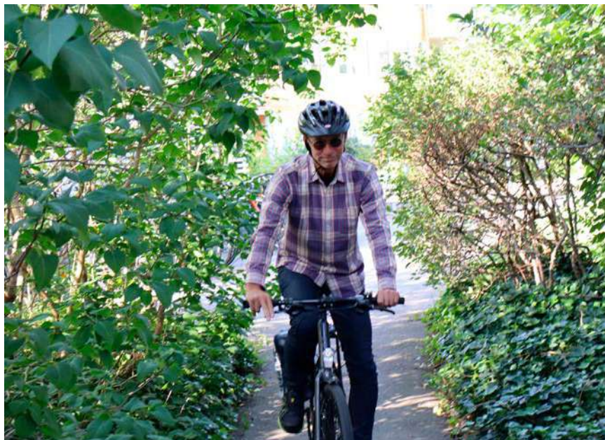
Urban har alltid cyklat till jobbet från radhuset i Tynnered. Nu är han på väg hem.

Beslutet att stänga sopnedkasterna ledde dock till protester och en namninsamling