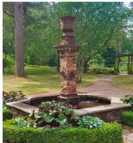
Fontänen utanför storstugan.

Årets gårdsombudsresa gick till Vargaslätten i Simlångsdalen lördagen den 17 juni. Kvant över sju började resenärerna komma till påstigningsplatsen på Fjällgatan, intill Klostergångens entré. När ingen buss syntes till när klockan närmade sig halv-åtta började vi undra vart den tagit vägen.