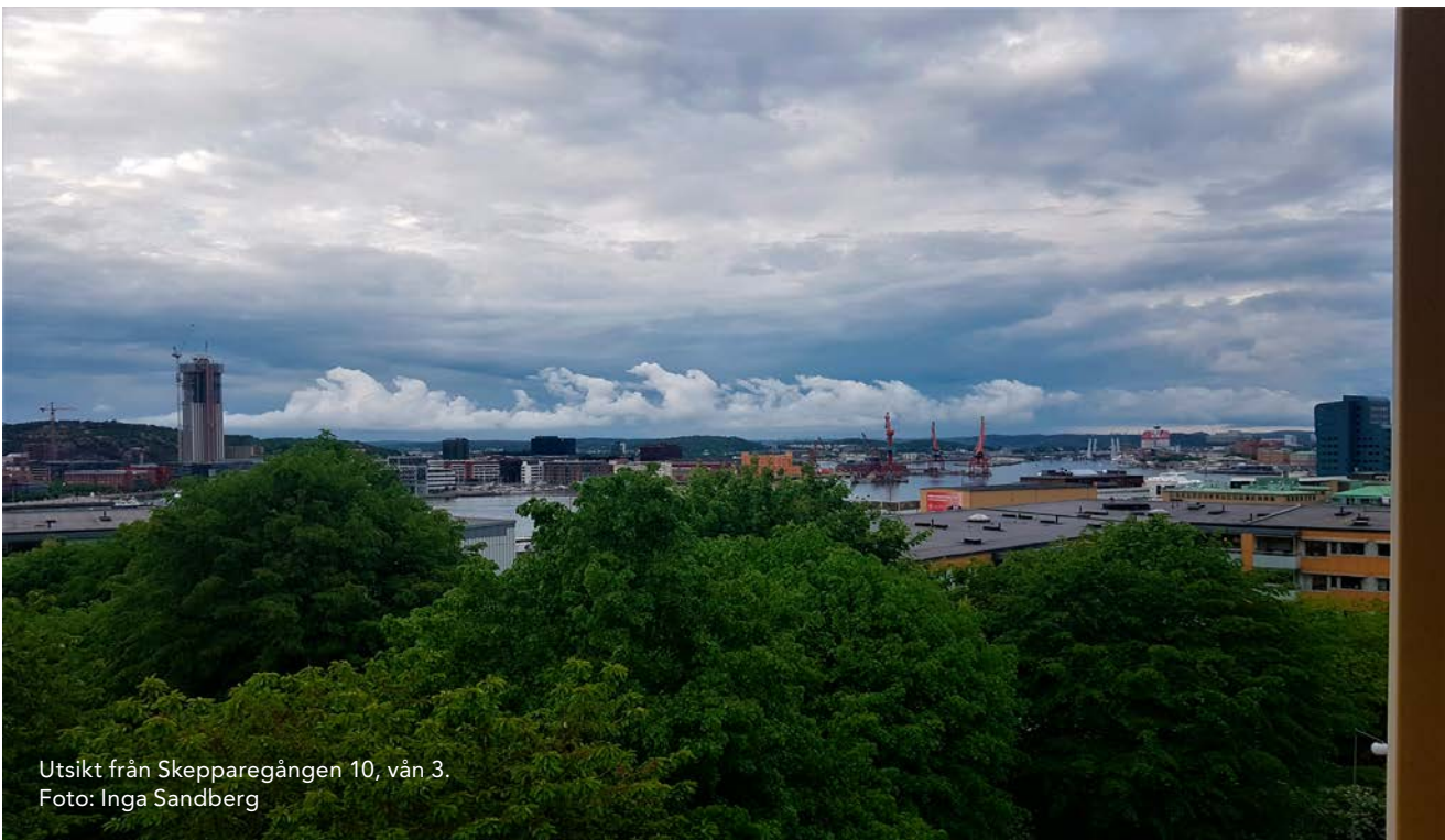
Utsikt från Skepparegången 10, vån 3.