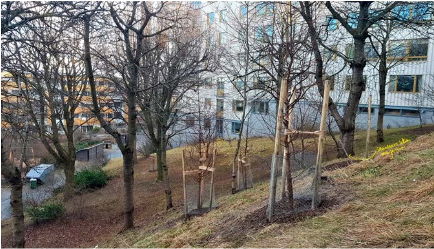
I branten vid Hobergs trappor är sju gulblommade magnolior planterade.