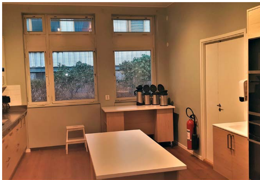
Det stora köket i Masthuggets hus är nyrenoverat med två köksöar och nya vitvaror.

TEXT: BJÖRN ÖHLSSON