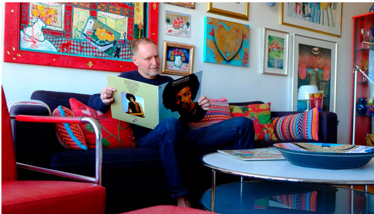
Hemmet på Mattssonsliden 14 är fullt med färger och konst.