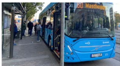
”60 Masthugg”: Så kommer snart inte längre till på den här blåa bussen i Göteborg.