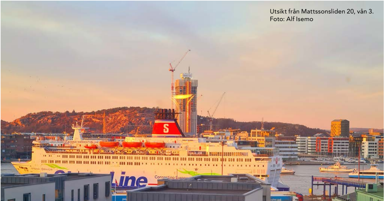
Utsikt från Mattssonsliden 20, vån 3.