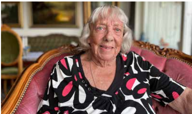
I sin femma på Skepparegången 6 har hon fina gamla sittgrupper. Många av möblerna har hon haft sedan familjen flyttade in 1967.