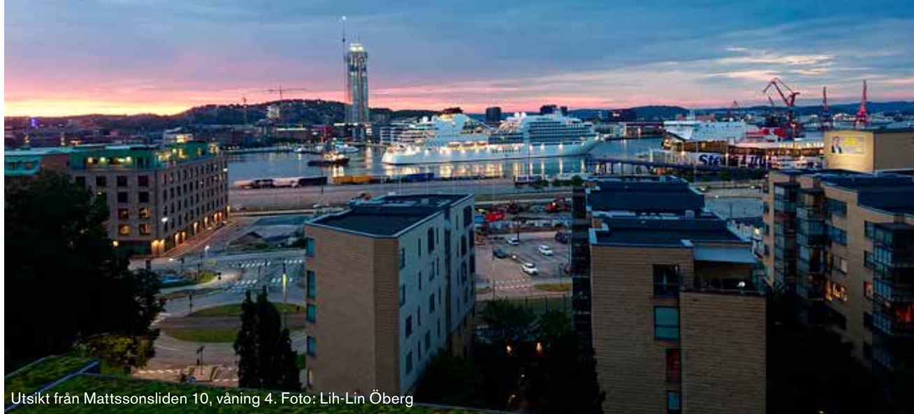
Utsikt från Mattssonsliden 10, våning 4.