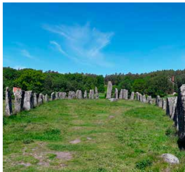
Skeppsättningen i Blomsholm med 49 stenar som är en till fyra meter höga.