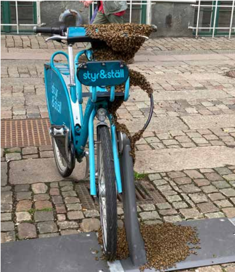
Svärmen på Styr & ställ-cykeln, 9 juni 2022, Östra Hamngatan.

I somras vandrade vilt in på våra gårdar. Bilder på rådjur och en räv kom upp i Facebookgruppen Nya Masthugget och redaktionen lyckades få tag i foton på rådjuret.