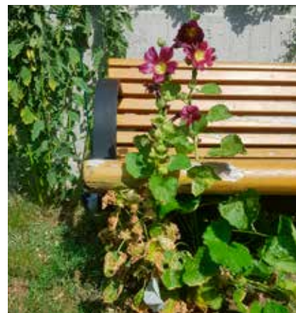
En envis stockros som tappert återkommer vid en bänk mellan två av gårdarna på Skepparegången.