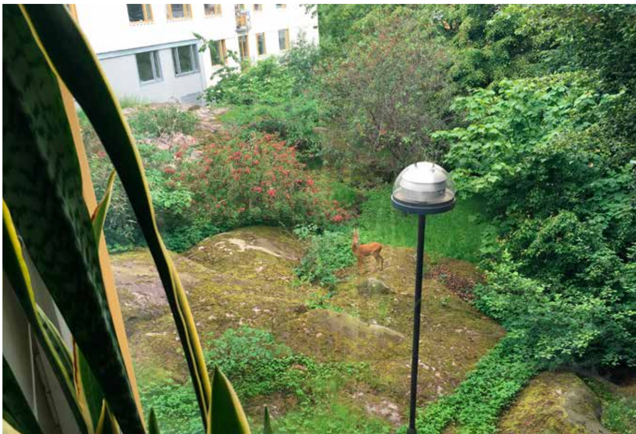
Rådjur genom fönstret på Skepparegården 22.