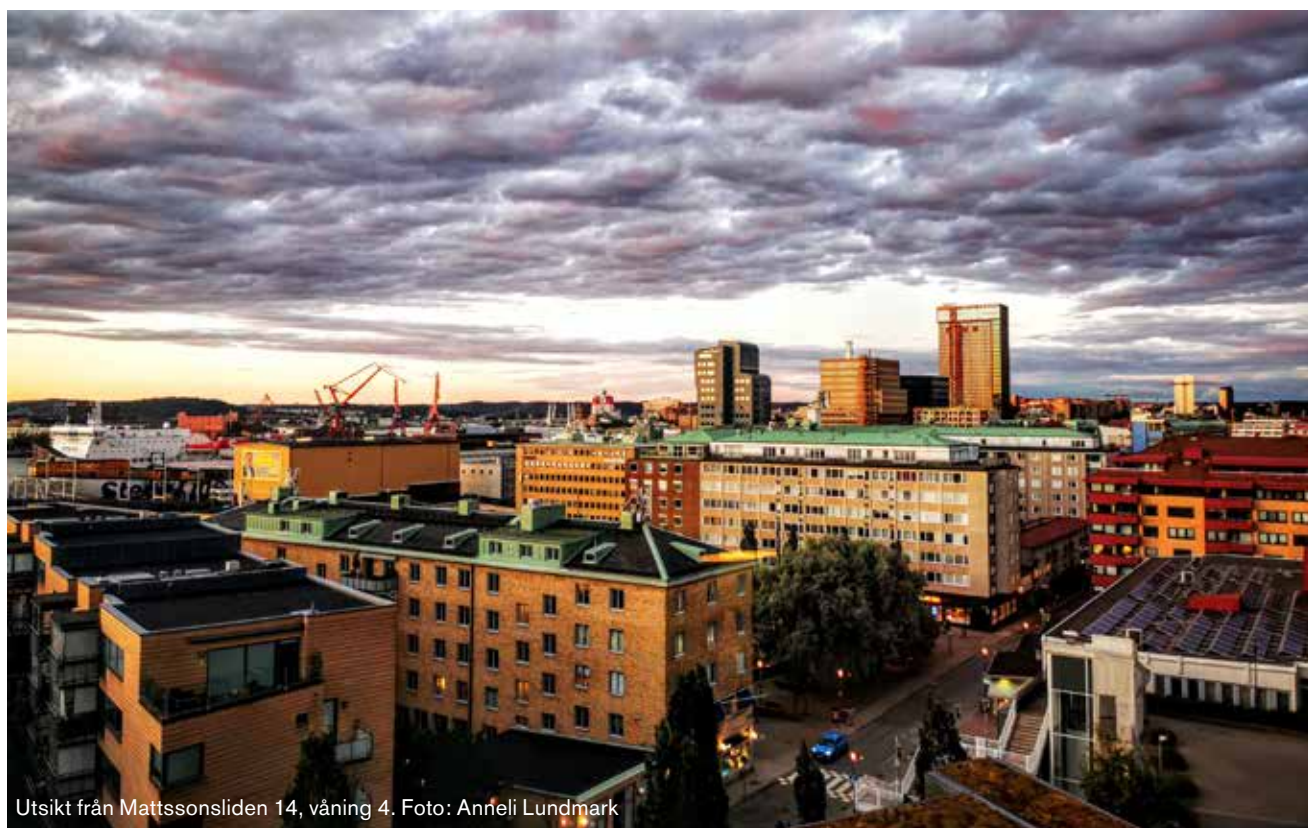
Utsikt från Mattssonsliden 14, våning 4.