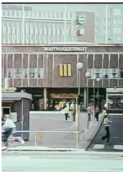
En ruta ur filmerna Places for People 1971 visar Masthuggstorgets logga (mitten av bilden). Ett litet spår finns kvar på fasaden än i dag.