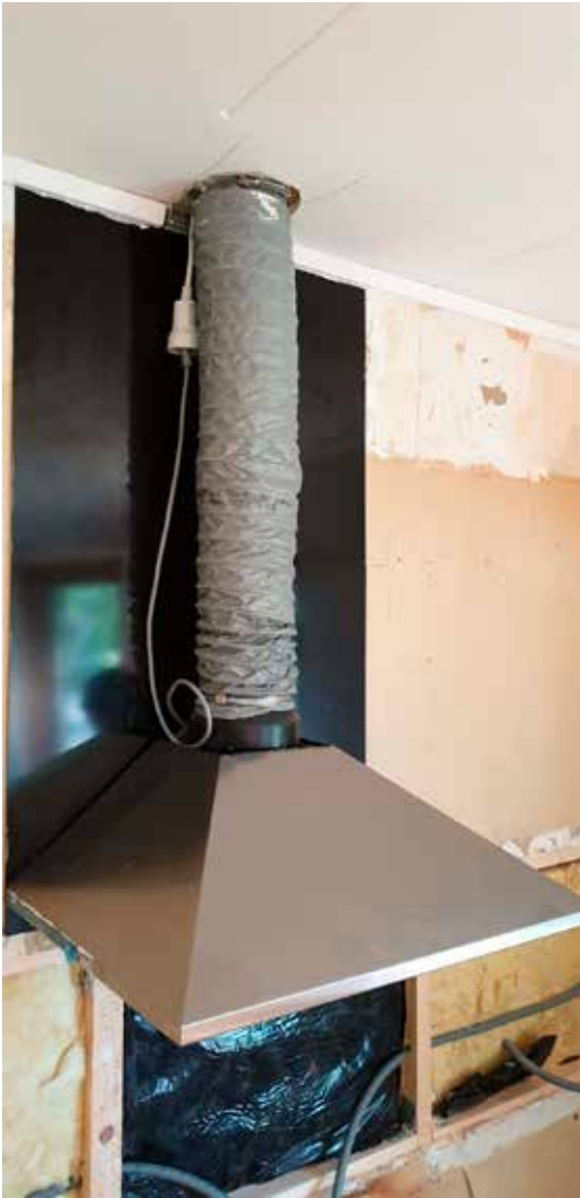
Köksfläkt som är direkt påkopplad mot ventilationskanalen, vilket inte är tillåtet.