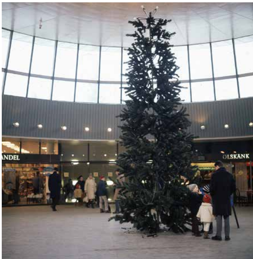
Masthuggsterrassen i sin tidiga skepnad. En rulltrappa, vars övre del syns i bakgrunden, ledde upp till detta lilla köptorg som nu är borta. Masthugget 1970-tal. Vårt Göteborg.

Det var bara något decennium innan även den sedan trettioåret uppbyggda välfärdens började skaka i grunden.