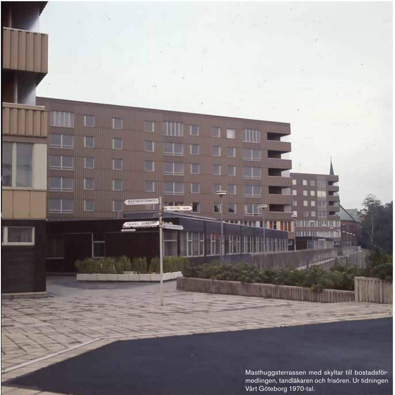
Masthuggsterrassen med skyltar till bostadsförmedlingen, tandläkaren och frisören. Ur tidningen Vårt Göteborg 1970-tal.