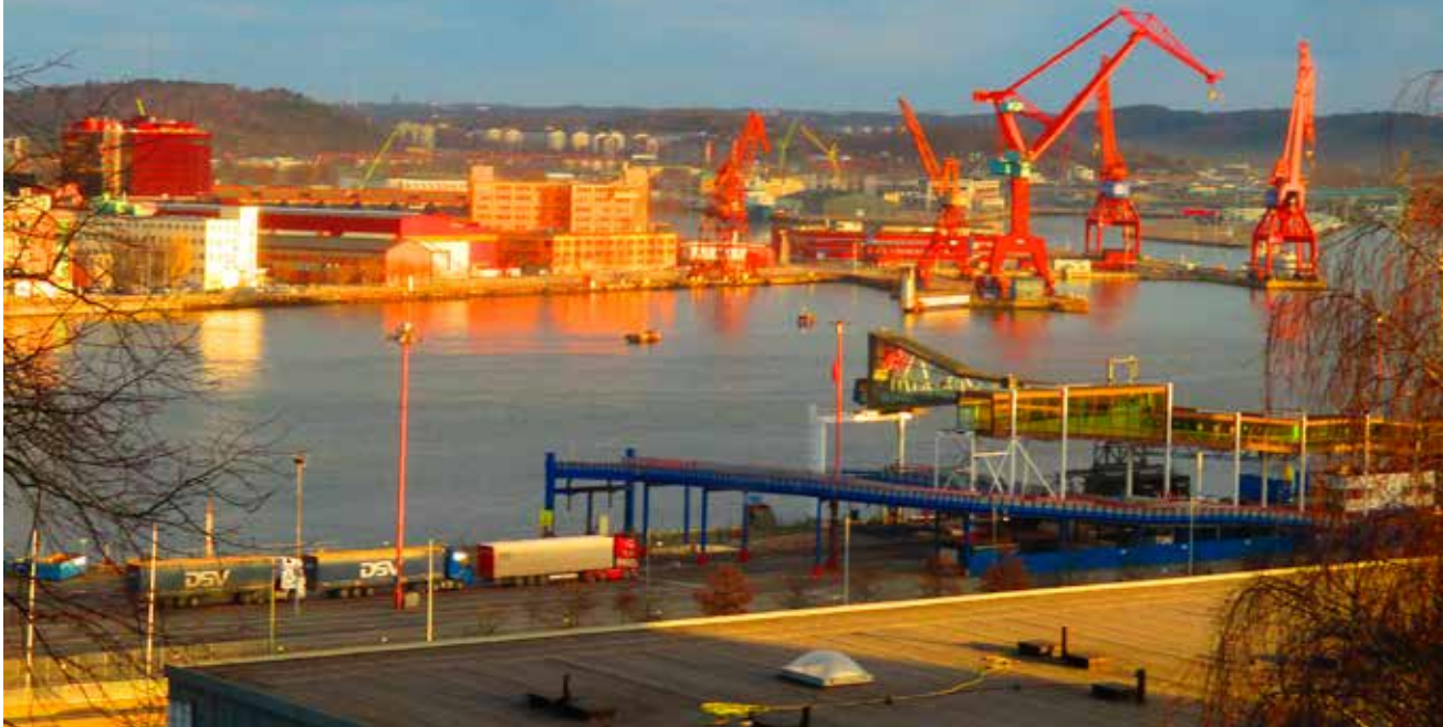
Utsikt från Skepparegången 4, våning 2.

D E FLESTA MEDLEMMAR kommer inom ett par år att få en kraftig förändrad utsikt mot älven. Nu är det dags att dokumentera dagens utsikt. Sen kan vi jämföra med hur det ser ut om 3–4 år.