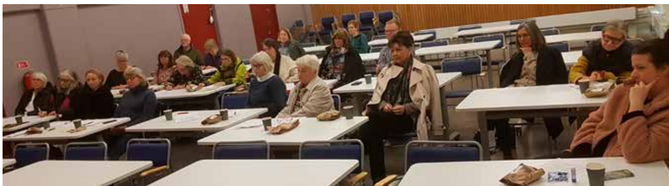
Gårdsombuden samlade i Stora salen, Masthuggets hus.

mycket arbete med att arrangera sådan och dels för att inga gårdar längre ansvarar själva för rabatterna närmast huset. Det kan möjligtvis finnas sommarväxter i urnor eller någon liten rabatt ute på gården som fortfarande sköts av de boende och då kan det vara enklare att gårdsombudet köper växterna själv.