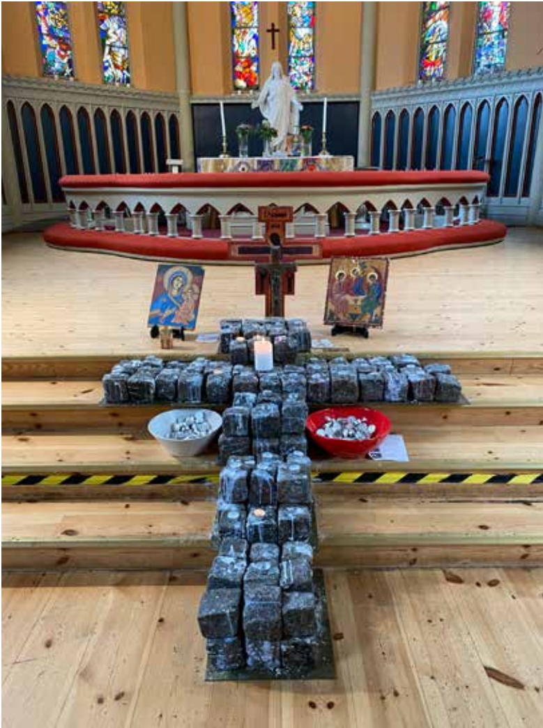
Altaret med ett kors av gatsten.

besökare fram och pratar med Rebecka. De skojar och frågar om råd och hjälp. Det märks att det här är en mötesplats, och att folk känner varandra.