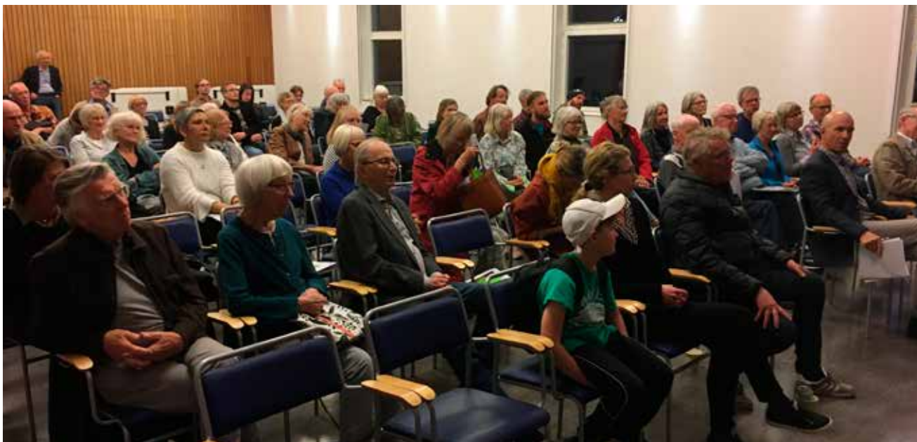
Stora salen i Masthuggets hus var välfylld.