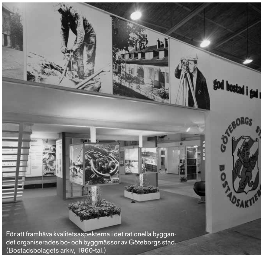
För att framhäva kvalitetsaspekterna i det rationella byggan- det organiserades bo- och byggmässor av Göteborgs stad. (1960-tal.)