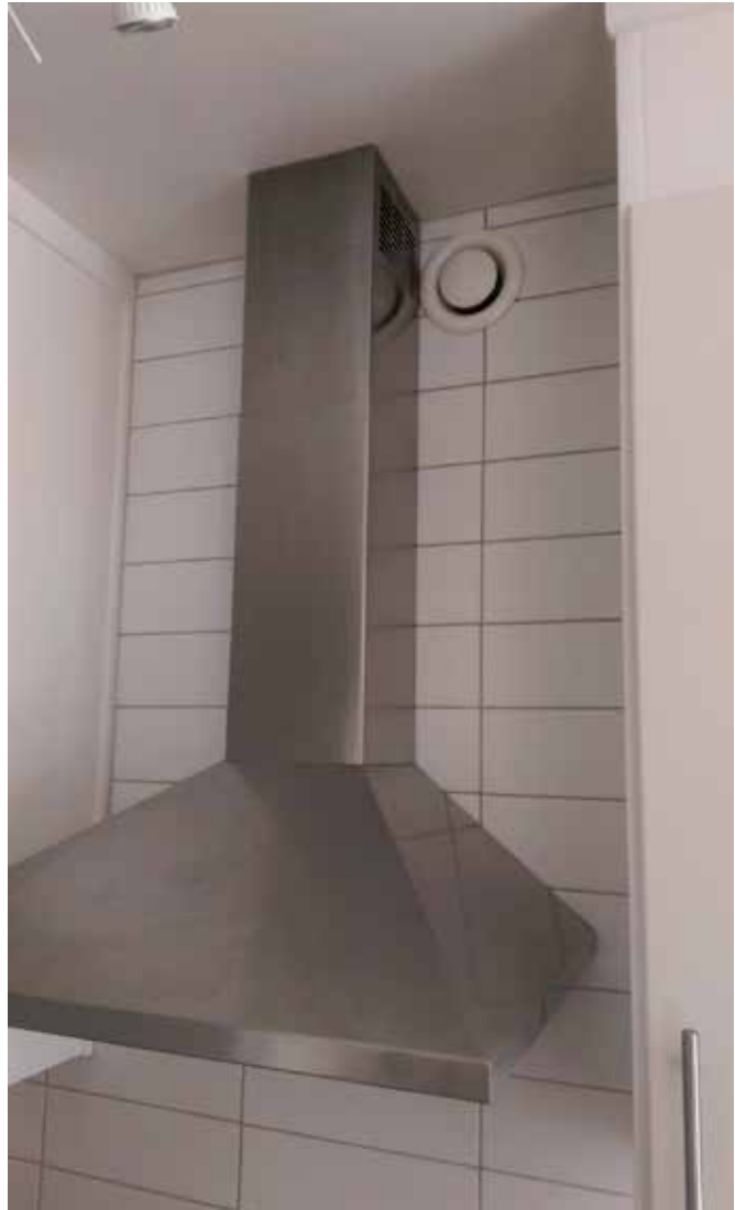
Exempel på en mycket bra installation. En köksfläkt med kolfilter och återcirkulation till lägenheten. Lägg märke till ventilen uppe till höger, som är lätt åtkomlig för rengöring, mätning och justering.