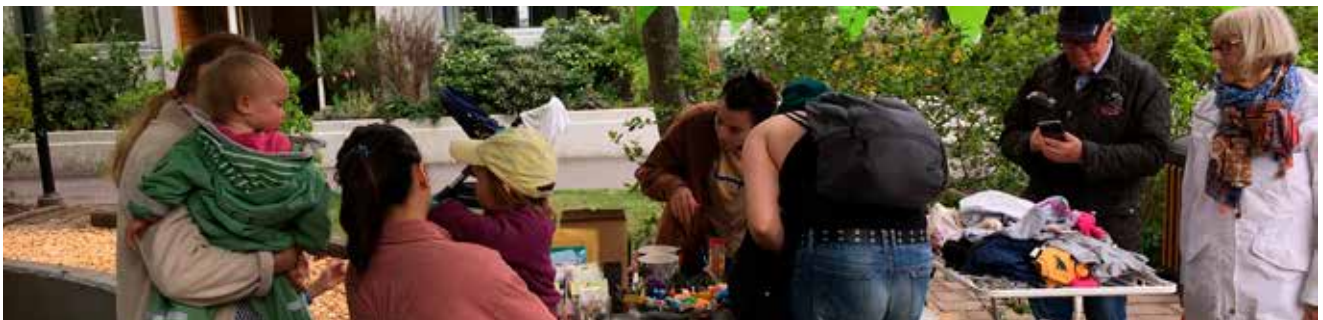
Många samlades runt borden på Skepparegången 20–30.