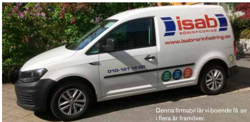
Denna firmabil lär vi boende få se i flera år framöver.

Pandemins utveckling gjorde att renoveringen kunde återupptas i bostäderna.