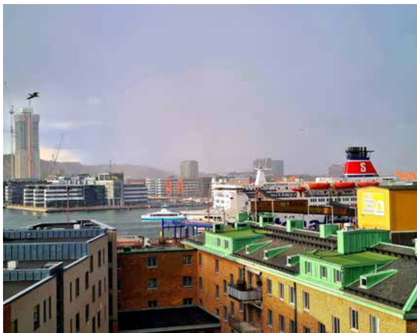
Utsikt från Mattssonssliden 20, våning 3.