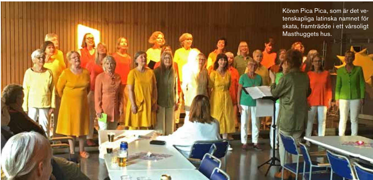
Kören Pica Pica, som är det vetenskapliga latinska namnet för skata, framträdde i ett vårsoligt Masthuggets hus.