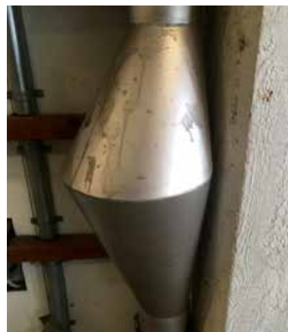
Så kallade rättstopp har monterats på alla avloppsstammar i Andra Långgatans garage.

Han förklarar hur det går till och visar upp en rörstrumpa från arbetsfordonet, där en kompressor bullrar för att via en svart slang ge tryckluft till den rörstam, där infästning av avloppsstrumpan pågår. För att fastna i gjutjärnsröret är den in-dränkt i polyesterplast. Inuti strumpan finns en sorts långsmal ballong som fylls med tryckluft och pressar strumpan mot rörväggen. När strumpan härdat och fast-