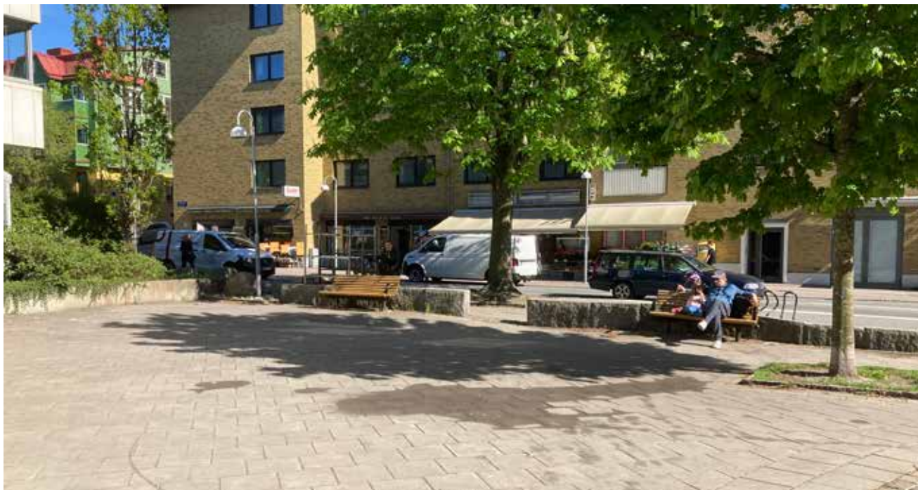
Paradistorget är ett inofficiellt namn på platsen mellan Paradisgatan och Masthuggsliden. Nu kan den komma att få ett officiellt namn.