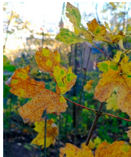
Det finns många lönnar i slänten.