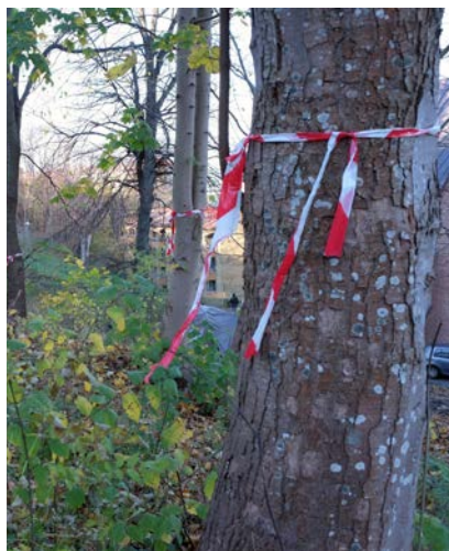
Ett av träden som märkts för nedtagning.