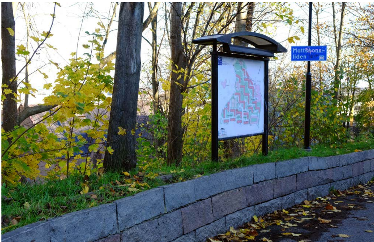
Muren längs vägen ner mot Mattssonsliden kommer att rivas, men ska byggas upp igen när de nya husen är klara om cirka två år.