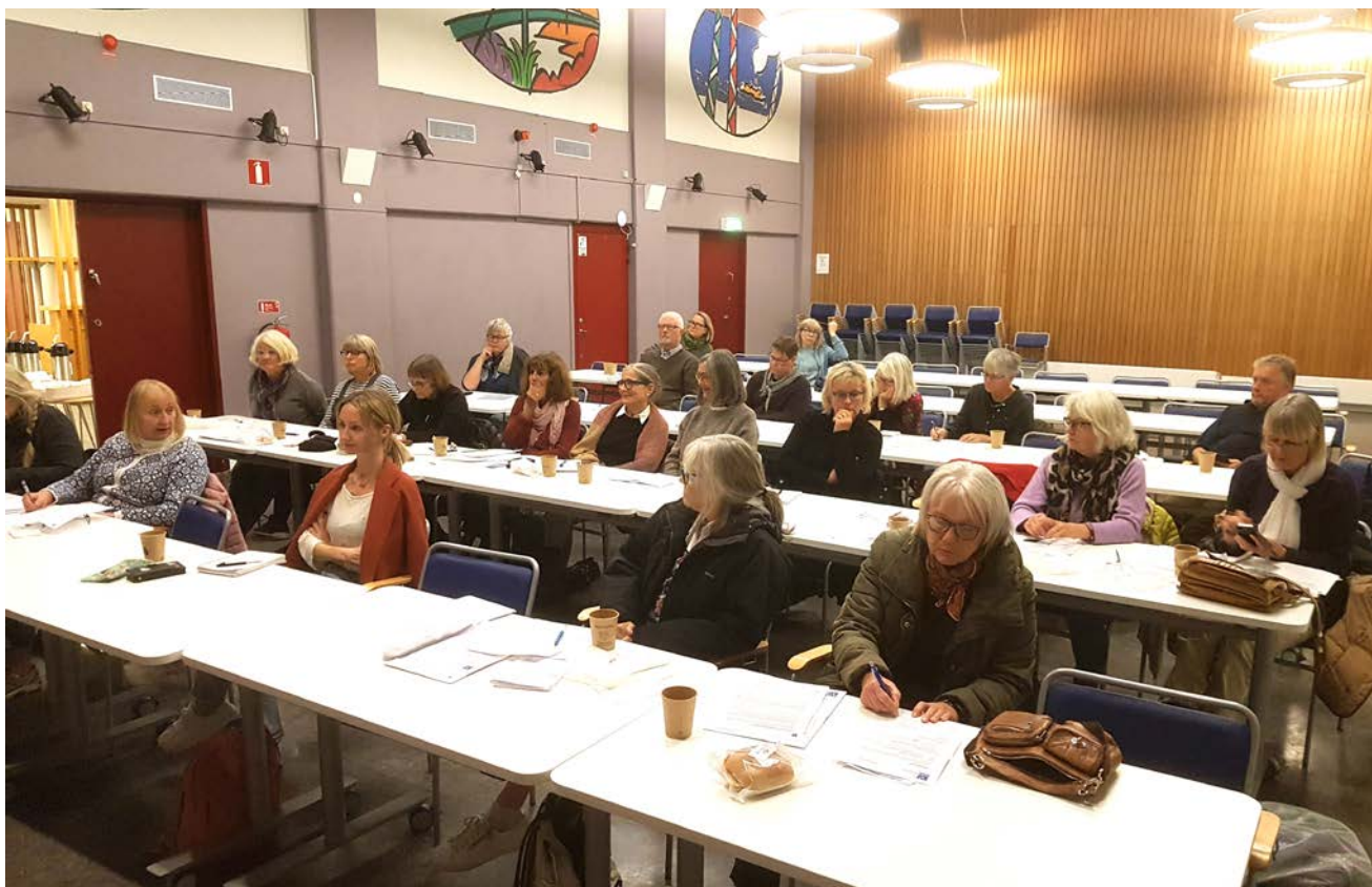
Gårdsombudsmötet den 18 oktober hölls i Masthuggets hus.