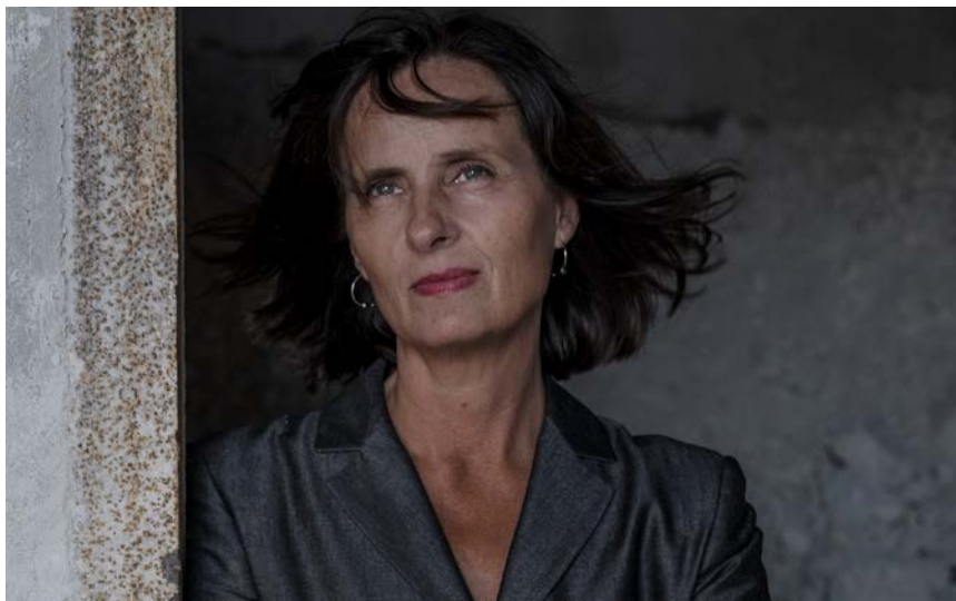
Susanna Alakoski.

satte sig i Skåne där Susanna och hennes bror växte upp. Nu bor hon i Stockholm sen tio år, men skånskan hörs ännu. Efter många prisbelönta romaner är hon nu gästprofessor vid Linköpings universitet.