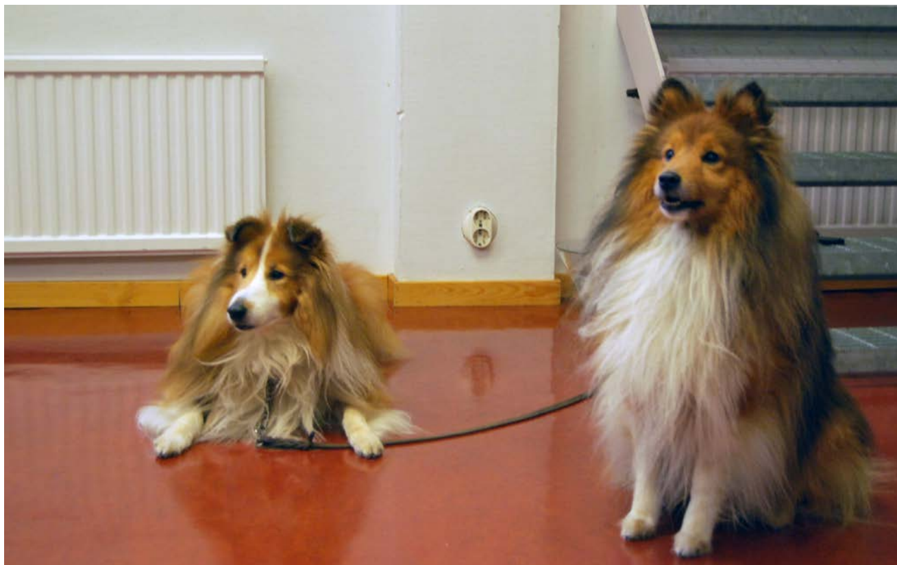
Hundarna Molle och Ludde.

Kulturföreningen i Brf Masthugget har nu startat sin verksamhet efter en lång paus under coronapandemin. Först ut var två kafétillfällen i Masthuggets hus.