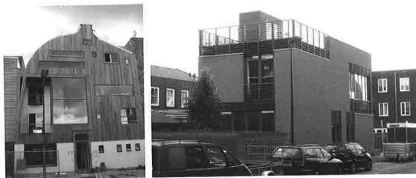
I Holland finns många lyckade exempel på spännande fasader menar Jan Stigland som också tagit dessa bilder. Se dem i färg på tidningens baksida.