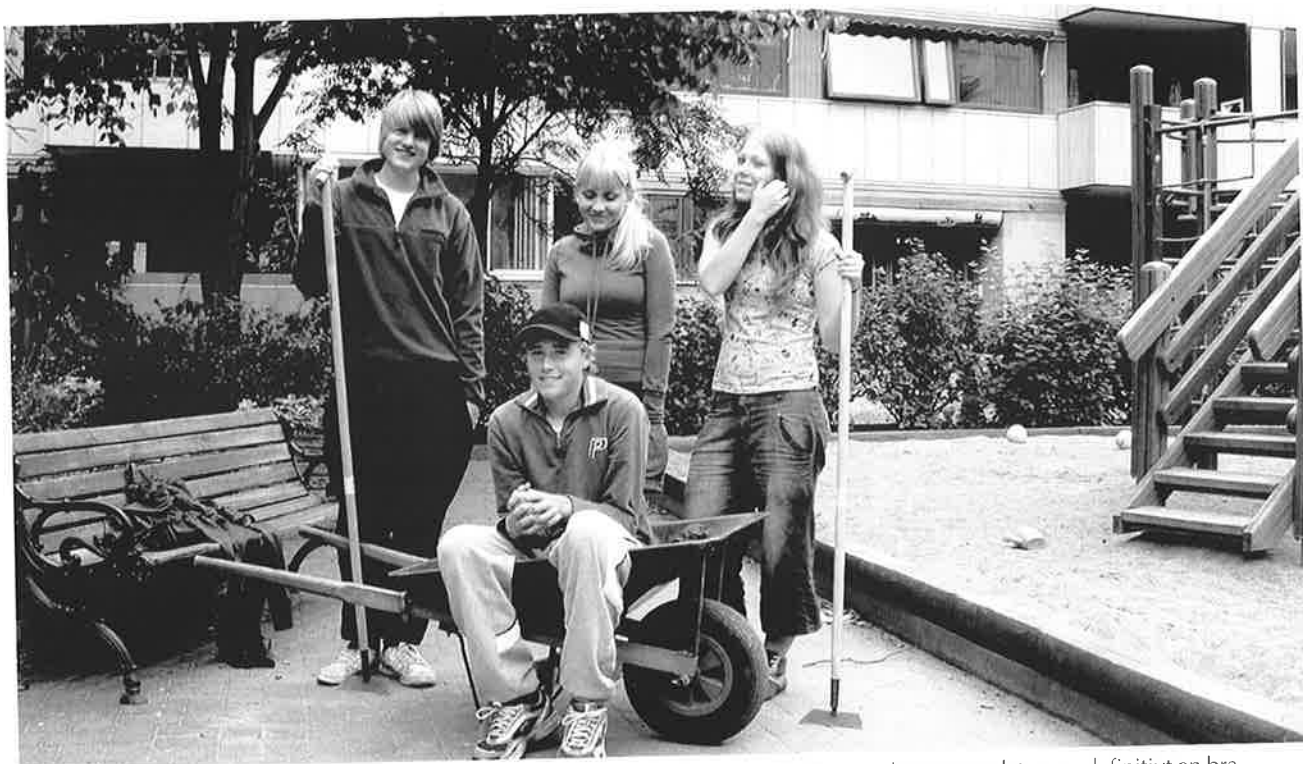
Fyra tappra sommarjobbare på sista arbetsdagen för det här sommarlovet. Lite tuffare än de trott var det, men definitivt en bra erfarenhet.