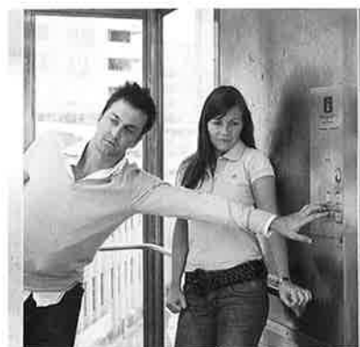
Hur länge ska man trycka innan det händer någonting?