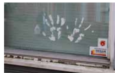
Spår av de verksamheter som nu lämnat barackerna.

Under de senaste tio femton åren har den i alla fall använts på många olika sätt. Här har funnits replokaler för trumslagare, gitarr och oboe, en vävstuga, ett pingisrum, ett snickerirum, samt keramik-, textil- och målarateljéer.