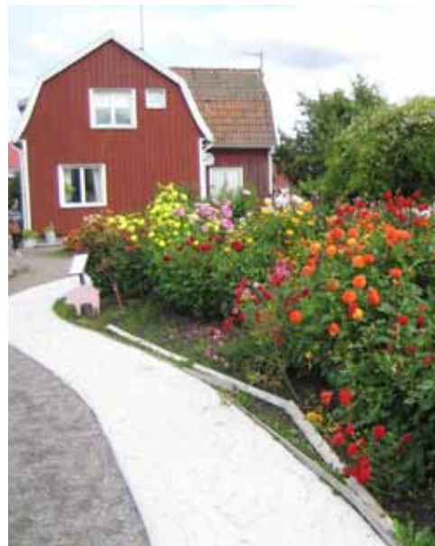
En bråkdel av dahlorna på Magnolia.