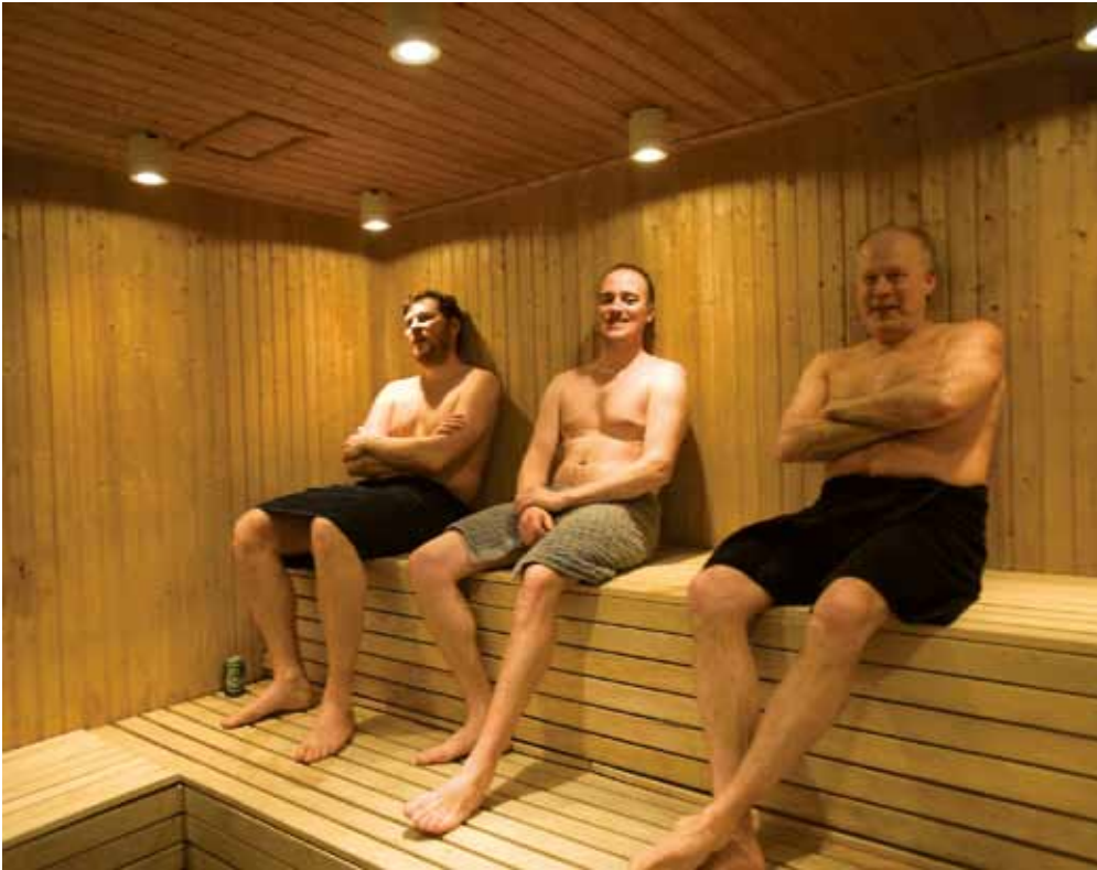
Det finns en bastu i området, på Masthuggsliden, och ett par motionärer tyckte att den inte riktigt räcker till. Motionen avslogs med tanke på alla andra stora projekt som är på gång.

av varför avslag yrkades. Stämman tyckte likadant och röstade nej till ett nytt återbruksställe.