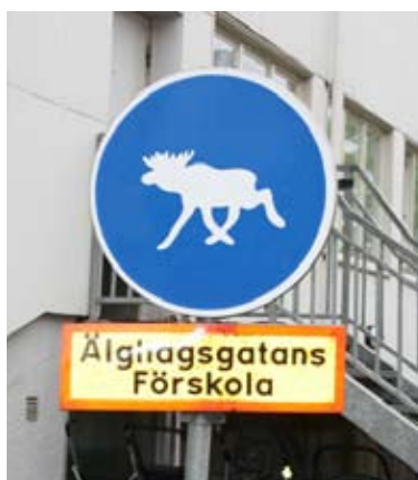
Varning för små älgar! Skylt utanför Älghagsgatan förskola.