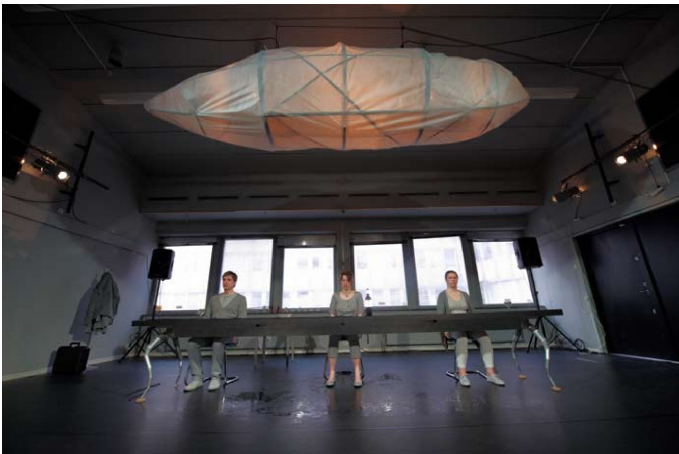
Bilderna är från Cinnober teaters "Och aldrig ska vi skiljas."

readings, av moderna pjäser. Form, innehåll, forskning och samhälle diskuteras med publik och en inbjuden panel. Detta startade i samarbete med teater Atalante redan 2003.