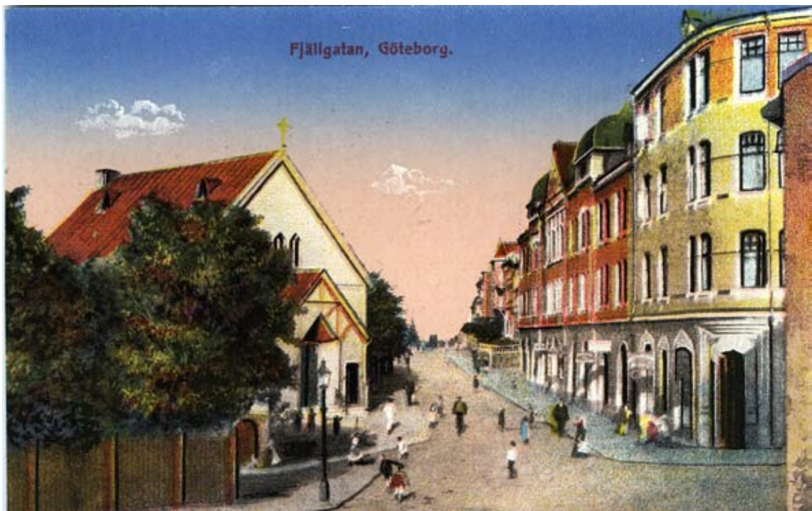
Fjällgatan troligtvis från samma årtionde som bilden på förra sidan.