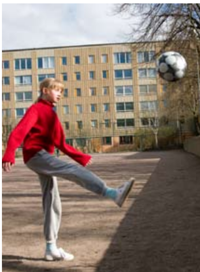
Gruset blir gräs. En av de motioner som bifölls av stämman.

om att vi behöver pengarna. När stämman var redo att gå till beslut ställde stämмоordföranden frågan i vanlig ordning genom att först be de som röstar för propositionen att "svara JA nu" och sedan de som röstar emot att "svara JA nu". Det var svårt att avgöra vilken sida som hade flest anhängare. Då plockades röstsedlarna fram och propositionen fick en knapp majoritet av rösterna, 37 röster mot 30.