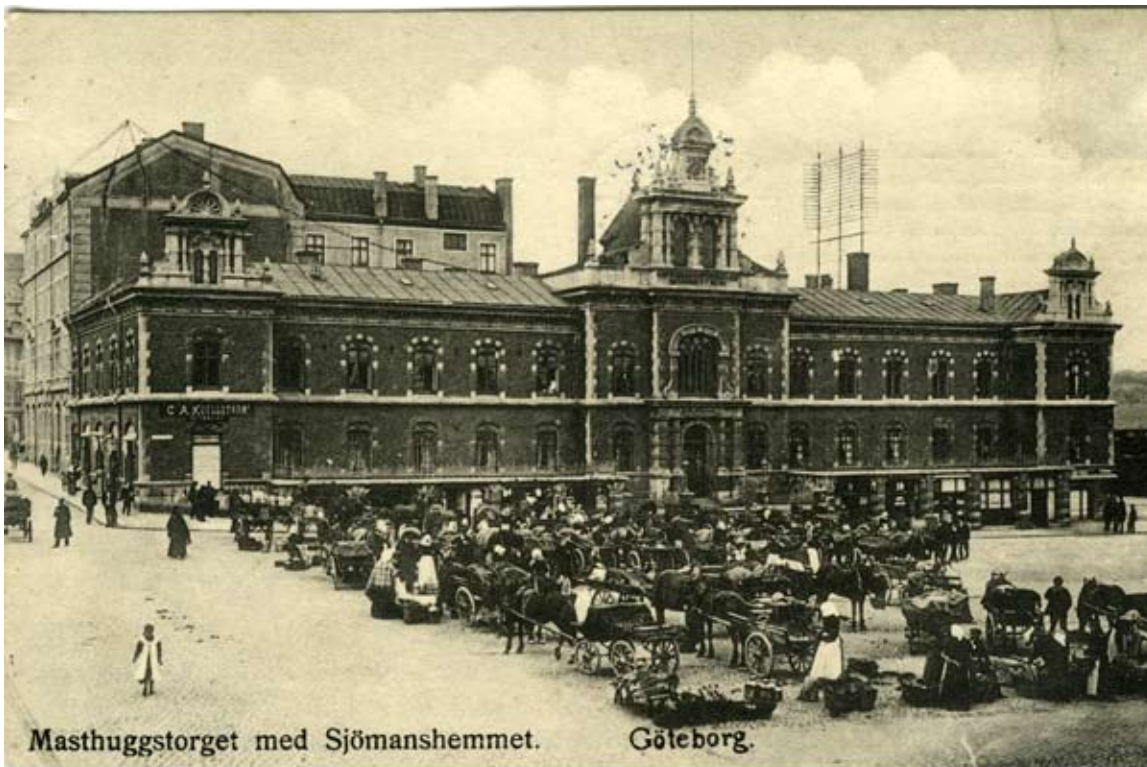
Masthuggstorget när förra seklet var mycket ungt. Den svårtydda poststämpeln antyder 1900 eller 1906. Stämplat på själva nyårsafton är det i alla fall.