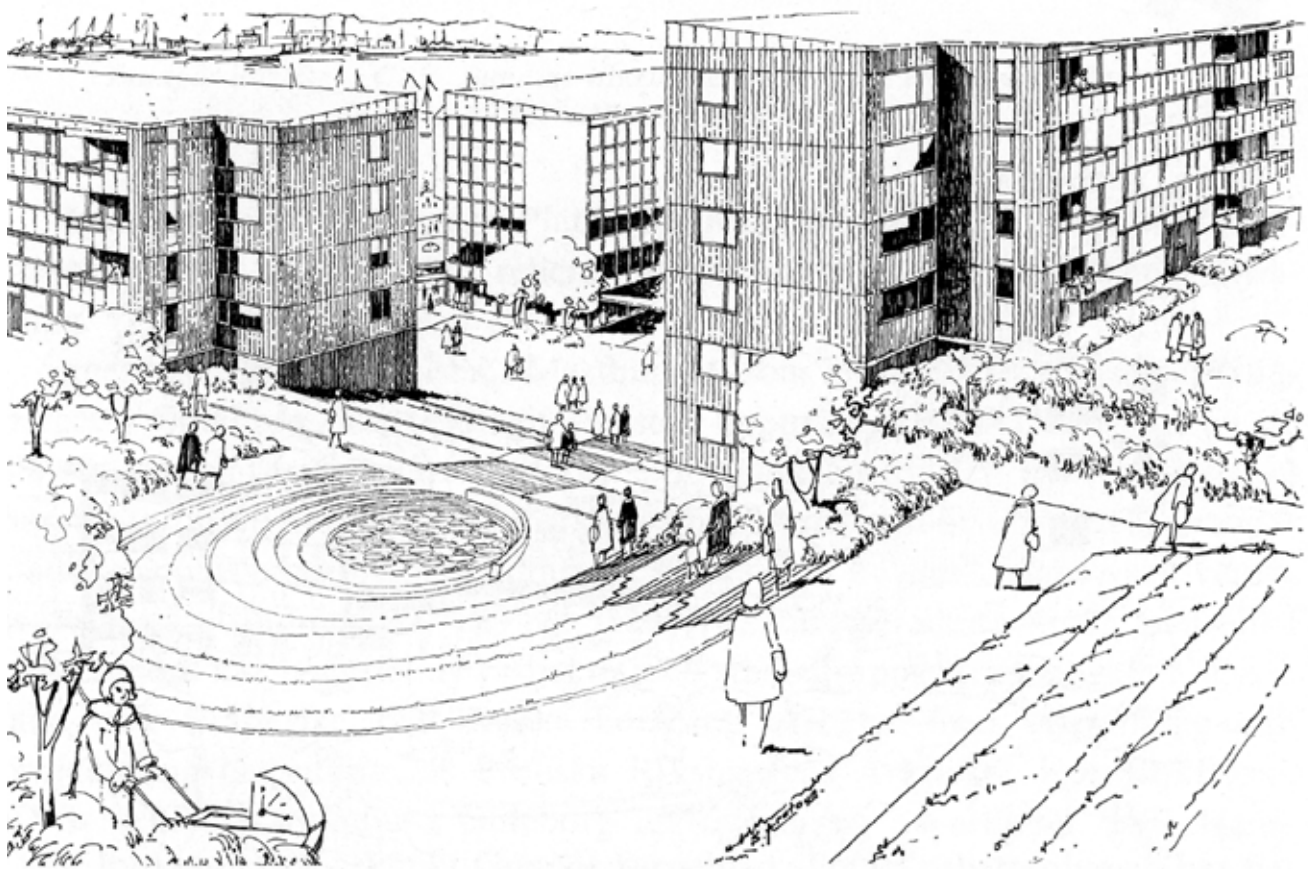
Huvudgångstråket genom det nya Masthugget — Nya Masthuggsliden vid vandring ned genom området.