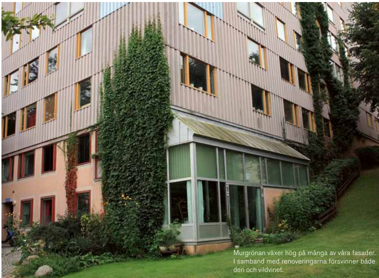
Murgrönan växer hög på många av våra fasader. I samband med renoveringarna försvinner både den och vildvinet.