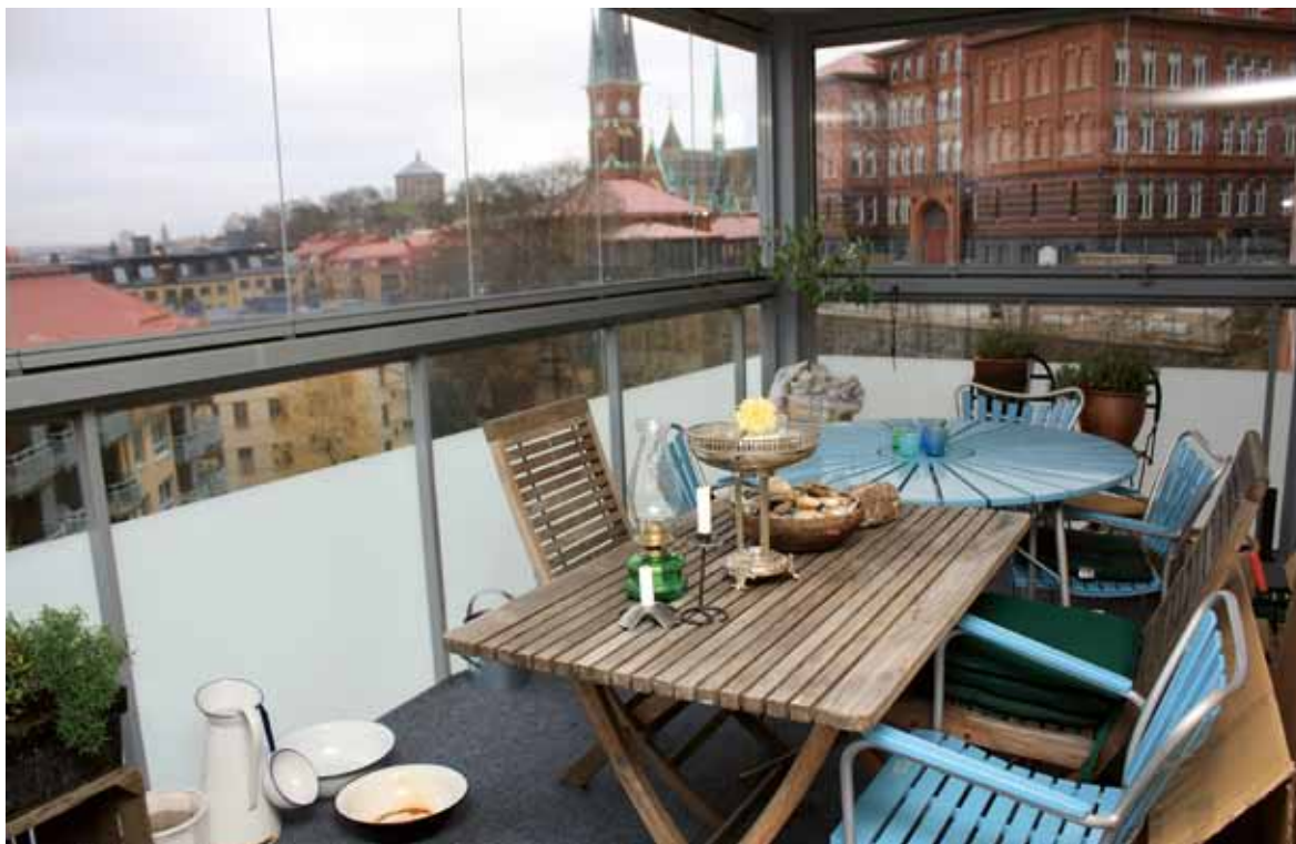
Även balkongen ger med sitt djup samma känsla av rymd.