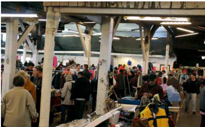
Ett exempel på ett småskaligt och positivt stadsliv, som bidrar till en hållbar utveckling.