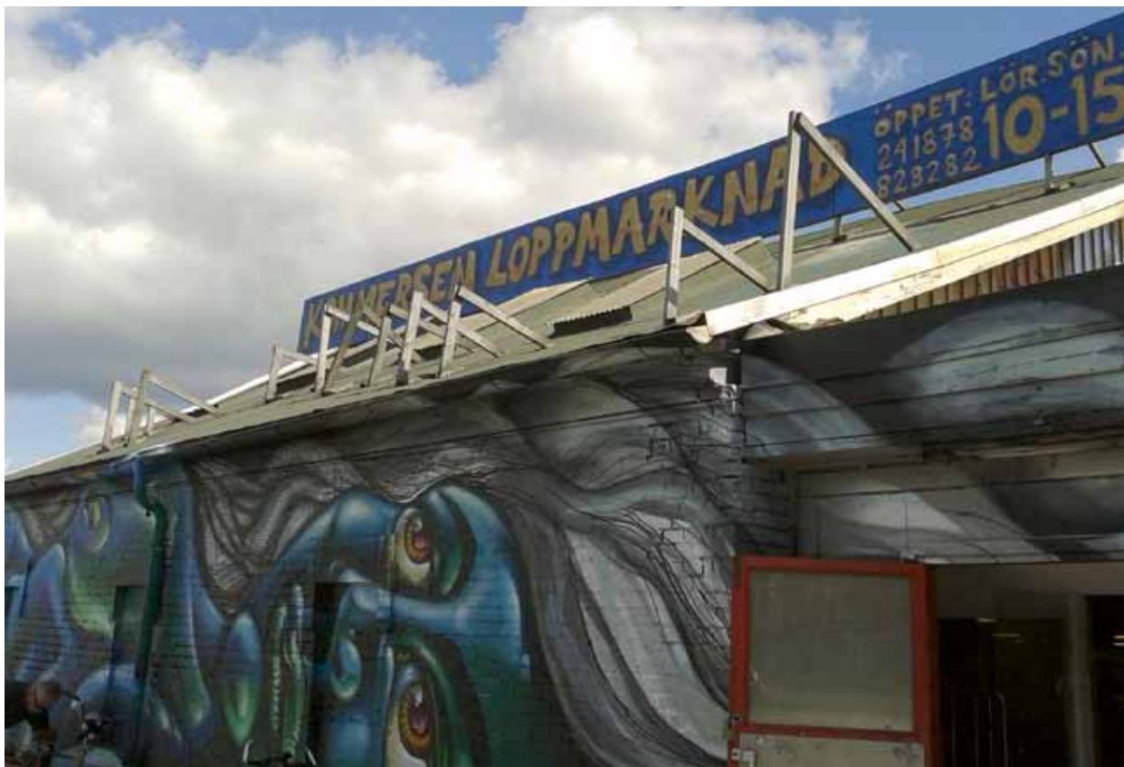
I somras fick fasadens entrésida en ny graffitimålning.

presenterade projektgruppen sin rapport om "fallet Kommersen". Besökarna bjöds dessutom på en välsmakande lunch i museets vackra valv och Masthuggsnyttts rapporter fanns givetvis på plats.