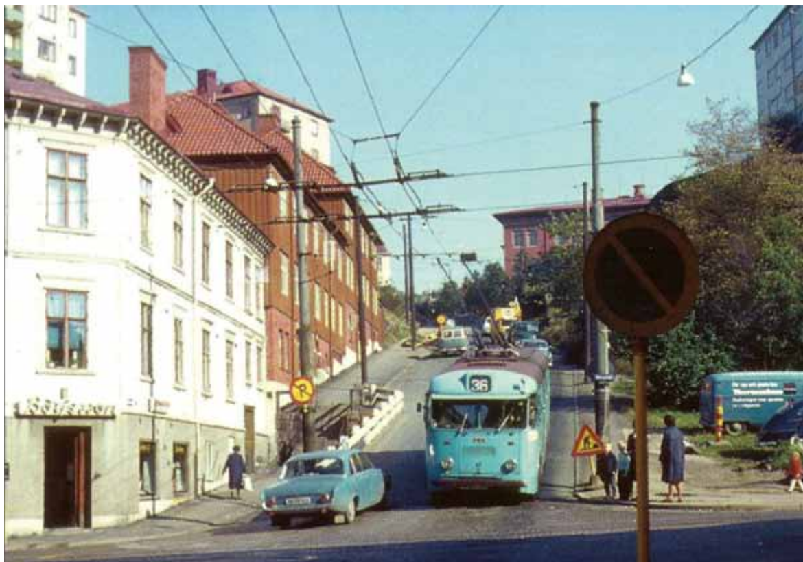
Trådbuss nr 17 på linje 36 i den branta Fjällgatan ner mot Bangatan, på väg mot Gråberget och Jaegerdorffsplatsen. Bilden är från september 1964.