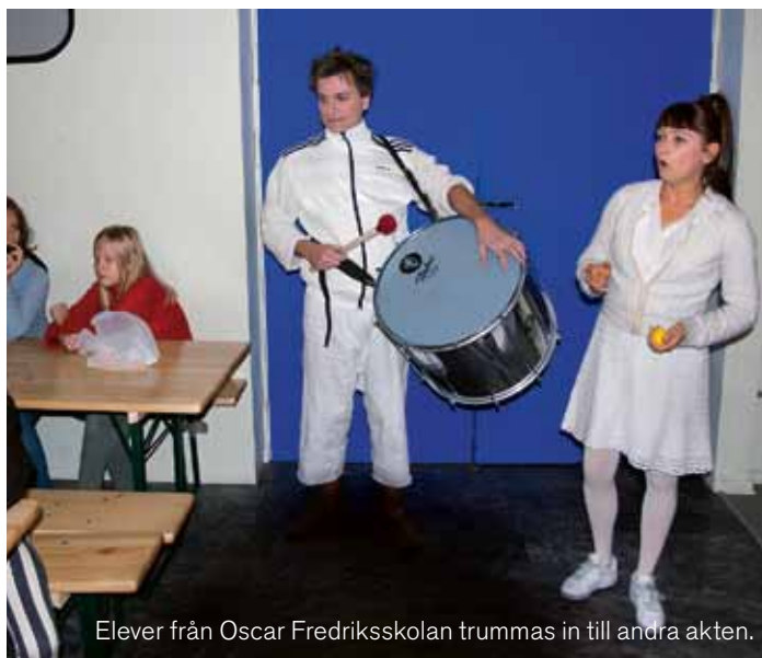
Elever från Oscar Fredriksskolan trummas in till andra akten.