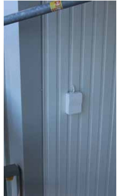
Balkongerna får ett rejält lyft. Balkongplattorna lagas och förstärks, panel som skadats byts ut och nya fronter och räcken monteraras. Alla balkonger får också nya eluttag.

sentanter för huvudentreprenören PSAB, balkonginglasningsföretaget Alnova och Riviera, som levererar markiser. Hittills har ungefär hälften av hushållen kommit på öppet hus.