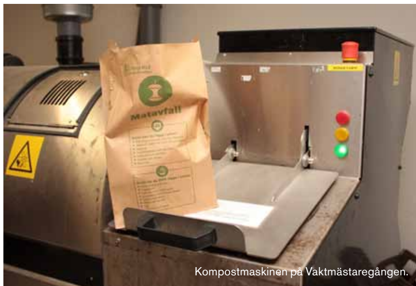
Kompostmaskinen på Vaktmästaregången.

Maskinen klarar av att producera fem kubikmeter kompostjord per år. Hur