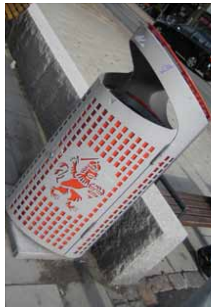
Göteborgspapperskorgen har en lösning som fungerar för fimpar. Använd den!