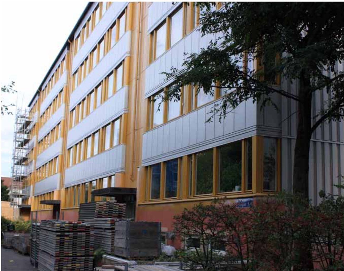
Första fasaden, Klostergången 1-5, är ommålad.

nar förvaltningen med att renoveringsarbetena skall ta cirka 20–25 veckor. Arbetena på det andra huset i ordningen, hus nr 17, Klostergången 7–13, påbörjades i mitten av maj och kommer enligt planen att avslutas i mitten av november. Arbetena på hus nr 18, Vaktmästaregången 1–5, kom igång en vecka senare än planerat, i början av juli, och kommer enligt planen att avslutas i slutet av november. Det sista huset för i år, hus nr 20, Vaktmästaregången 2–6, påbörjades i slutet av juli och kommer också att avslutas i början av december. Sen blir det för kallt för målning och betongarbeten.