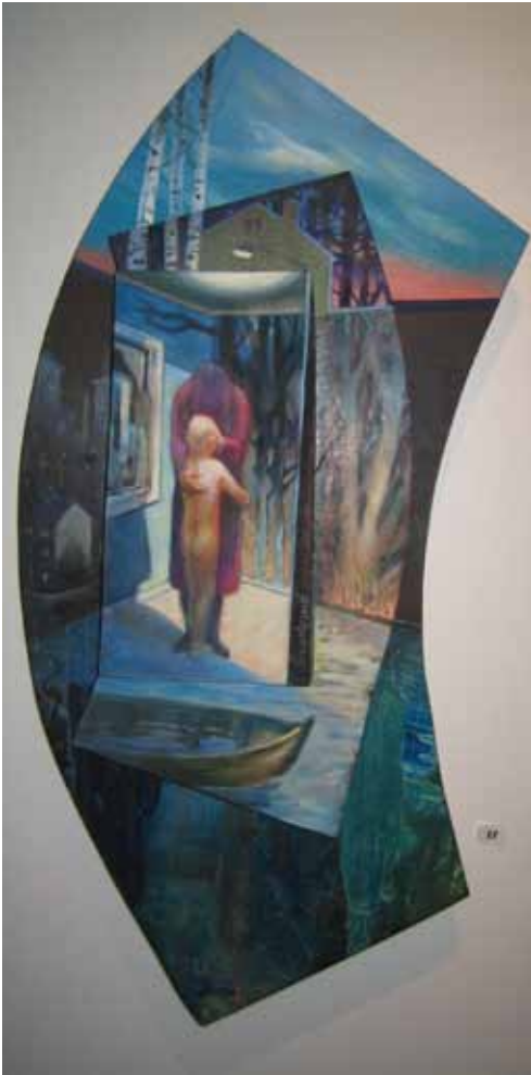
"Det visste ni inte", blandteknik av Anders Lundmark.