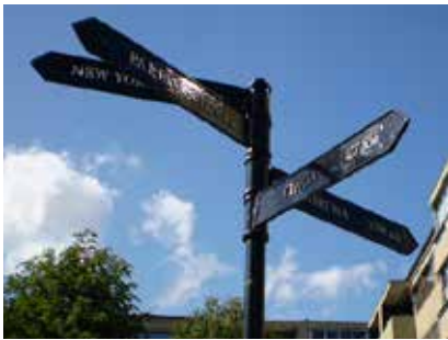
Skylstolpen vid Klingners plats 2008, innan Kiruna försvann.