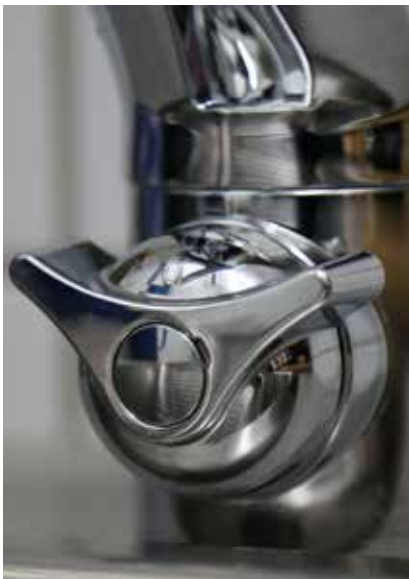
Två varianter av avstängning för disk- och tvättmaskiner. Viktiga att använda!