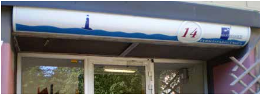
En entré med skyltmotiv formgivna av Eric Langert.