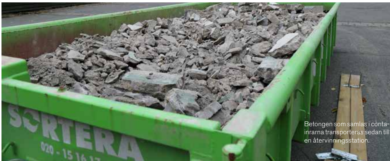
Betongen som samlas i containrarna transporteras sedan till en återvinningsstation.