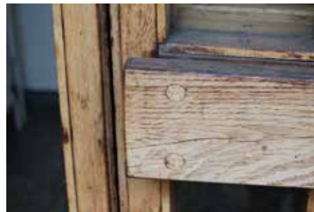
Ek eller teak? Ännu finns dörrarna på Skepparegången kvar, men de kommer efter renoveringen att ersättas av samma dörrar i metall som i övriga området.