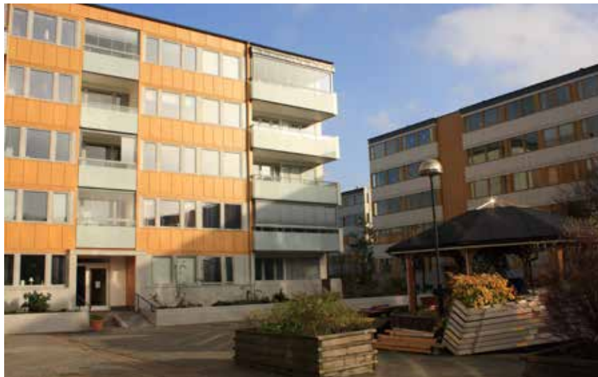
Fasadrenoveringarna har ökat och aktualiserat intresset för hur det ser ut på våra gårdar.

Riktlinjer för gårdsombudsarbetet gick igenom. Viktigt att det inte känns betungande och krävande. Kanske ändå det är lättare prata med sitt gårdsombud än att kontakta felanmälan.