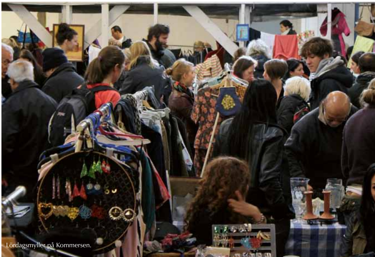
Lördagsmyller på Kommersen.

lig och har hela tiden gått upp under åren, precis som alla andra omkostnader. Alltid är det någon reparation vi måste fixa så gott vi förmår och vintertid kan värmekostnaderna dra iväg ordentligt. Det enda som hela tiden har varit fast är hyran för bordet, den är i dag densamma som när marknaden började 2000. Så långt det är möjligt för oss vill vi hålla det så, det är ju Kommersens grundidé, att det ska vara billigt.