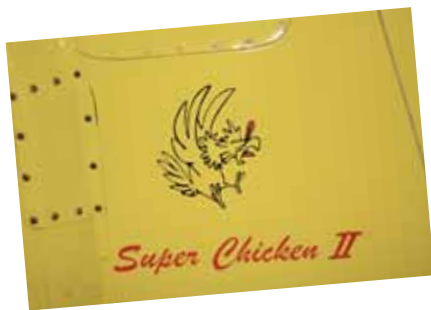
Helikoptern Super Chicken II är uppkallad efter en amerikansk tecknad serie.