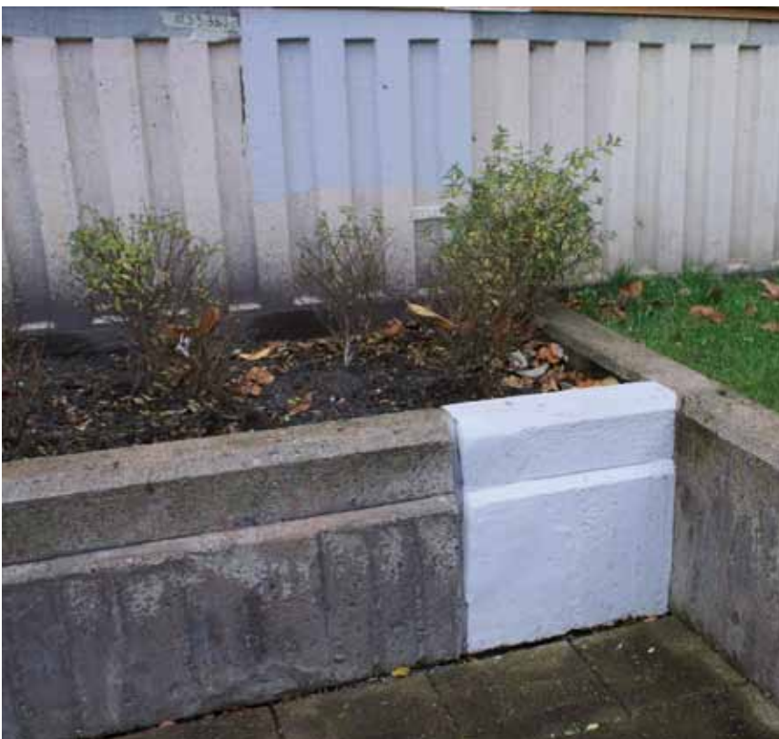
Prov på grund och sockelfärg.

Olika kulörer av gult blir det mot gårdarna. Denna variant heter oxidgul NCSS 3040-20R och kommer att finnas på Vaktmästaregången och Klostergången. Fyrmästaregången får en ljusare variant som heter neapelgul. Skepparegången blir engelsk röd och Masthuggsterrassen blir oxidgul. Klamparegatan och Rangströmsliden får en varmt grön färg mot gårdarna.