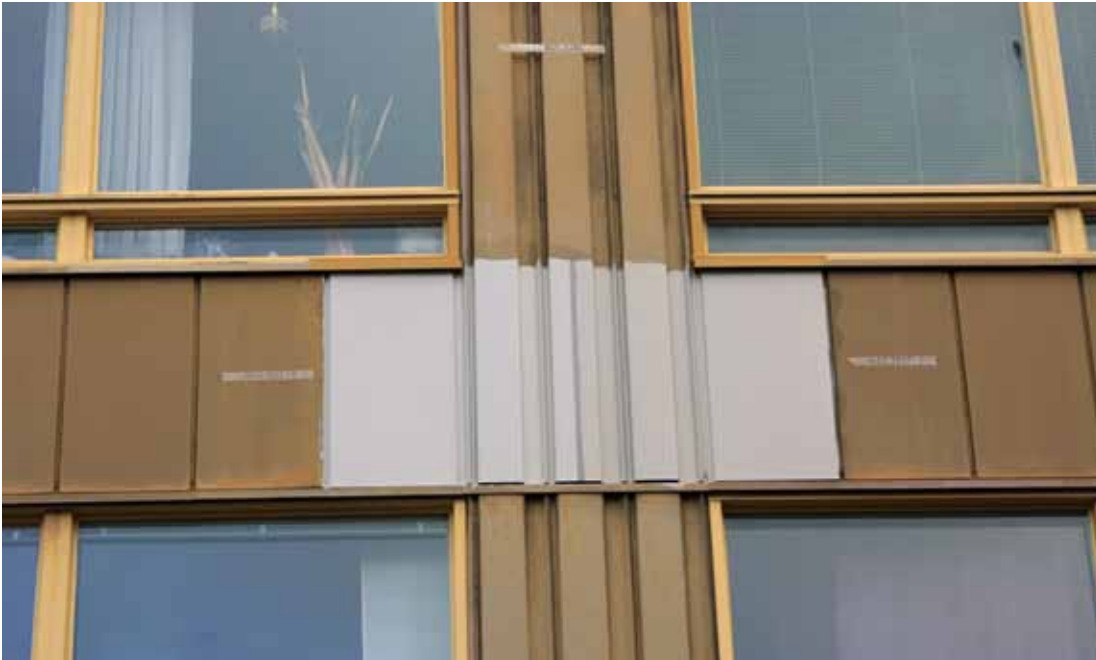
Denna grå färg skall pryda många fasader som vetter mot staden.

Flera masthuggsbor har säkert sett att det finns diverse nymålade små färgpartier på fasader, socklar och murar på Klostergången 7–13. De definitiva kulörerna för detta hus har provmålats för att få fram verkliga nyanser samt för att undersöka vidhäftning och vädertålighet.