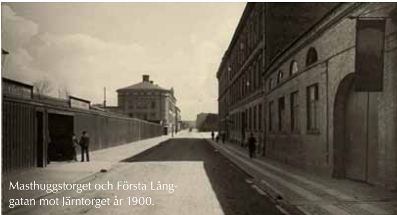
Masthuggstorget och Första Lång- gatan mot Järntorget år 1900.