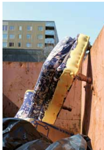
Ett av förslagen var att containrar inför boendes vårstädning/röjning bör placeras ut varje år.

var ett annat önskemål, vilket framförts flera gånger tidigare.