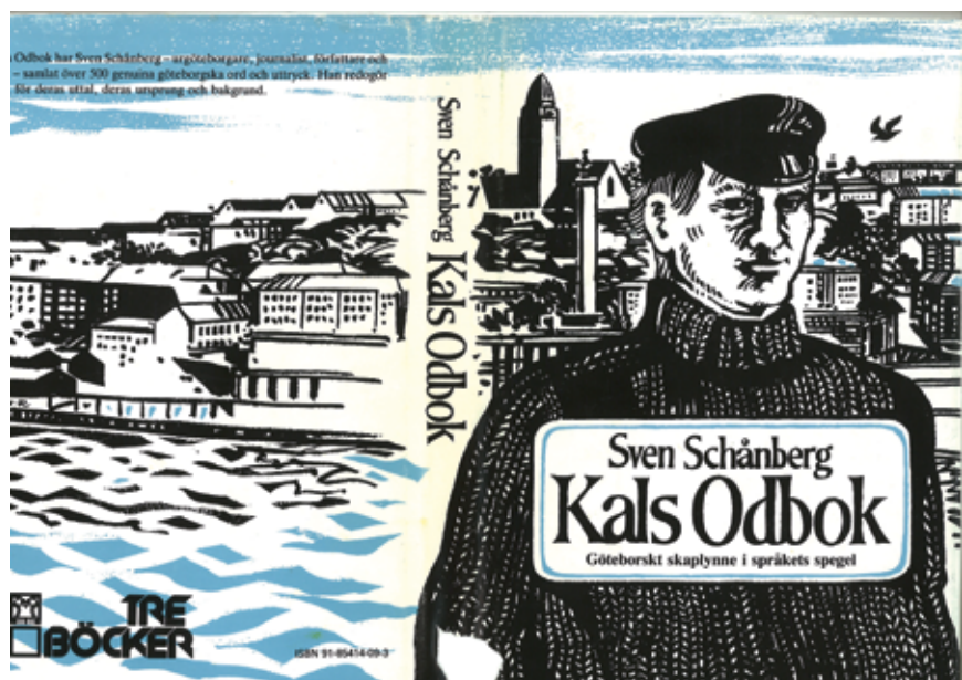
Kals Odbok av Sven Schånberg (1982) refereras i Nationalencyklopedin när man förklarar den Göteborgska dialekten.

Dessutom finns säkert en hel del olika undergrupper och dialektskillnader bland de redan nämnda. Den största gruppen språk här i närområdet är persiska, näst efter kommer finska och sen ganska stora grupper med forna Jugoslaviens språk, engelsk- samt spansktalande. Australiensare finns till exempel inte registrerade i vårt primärområde Stigberget, men några kommer från