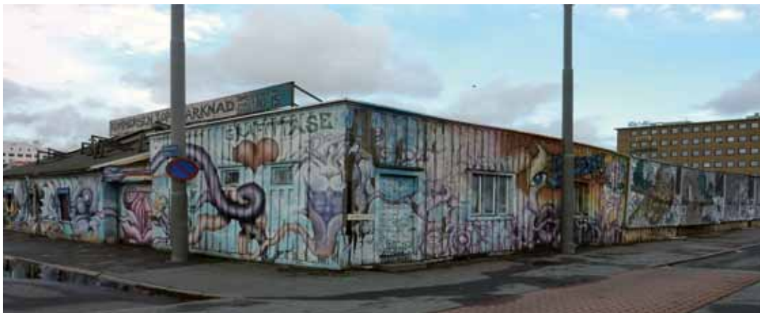
Kommersen nu och då. Hörnet Sänkverksgratan och Första Långgatan 1950 och idag. (Bilden till vänster och till höger)

Att loppmarknaden Kommersen vid Masthuggstorget kommer att försvinna i sin nuvarande form tycks det mesta i dag peka på. Det framgår klart av stadsbyggnadskontorets Program för Norra Masthugget som i olika sammanhang talar om att den nuvarande byggnaden kan ersättas med en ny. Frågorna om när detta kan ske, och vad som kan komma i Kommersens ställe, förblir hängande i luften ett bra tag fram över.