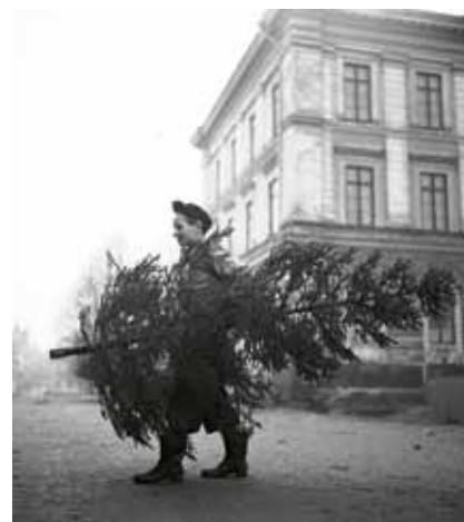
Julgranen kan komma till användning även efter jul.