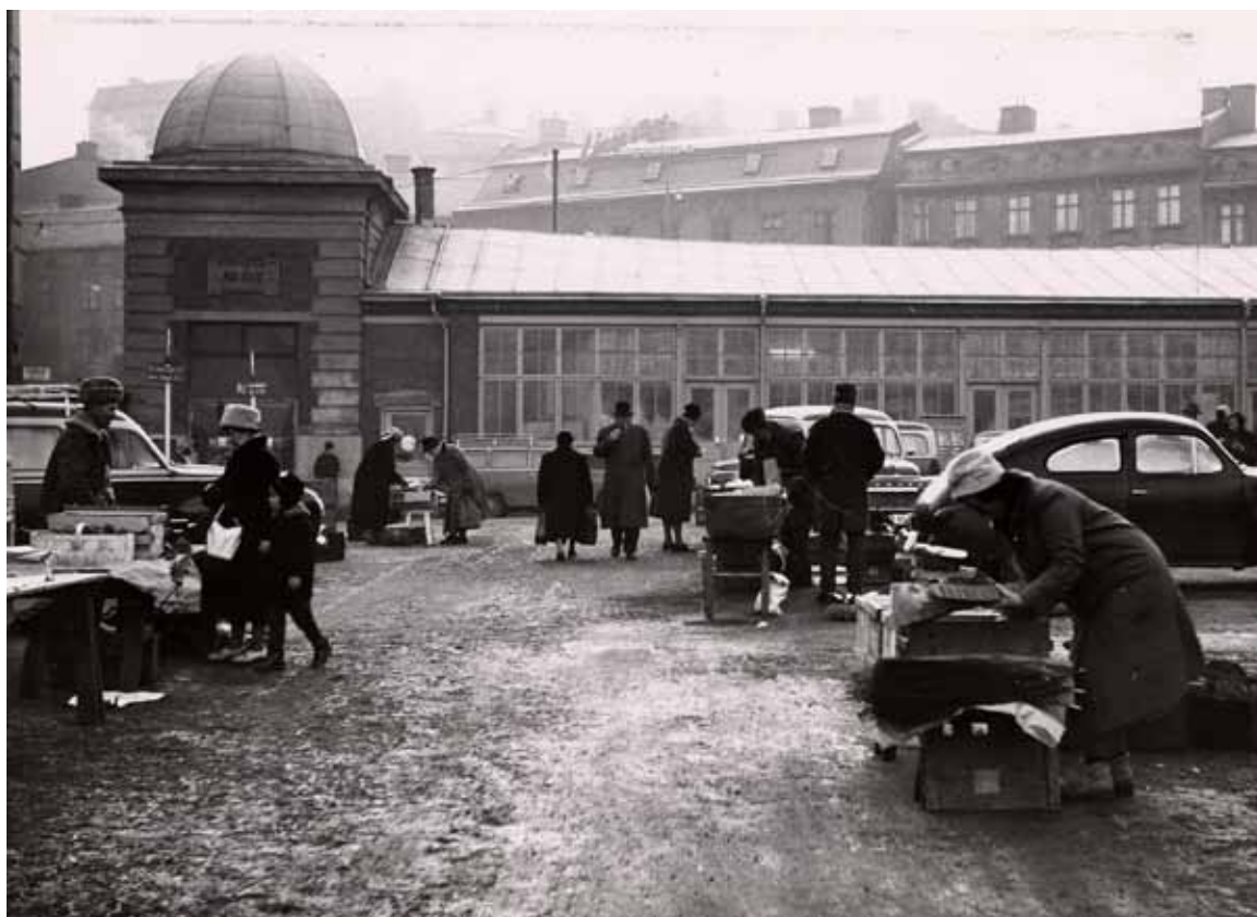
Bazarbyggnaden uppfördes 1887 och försvann i saneringarna under 1960-talet.