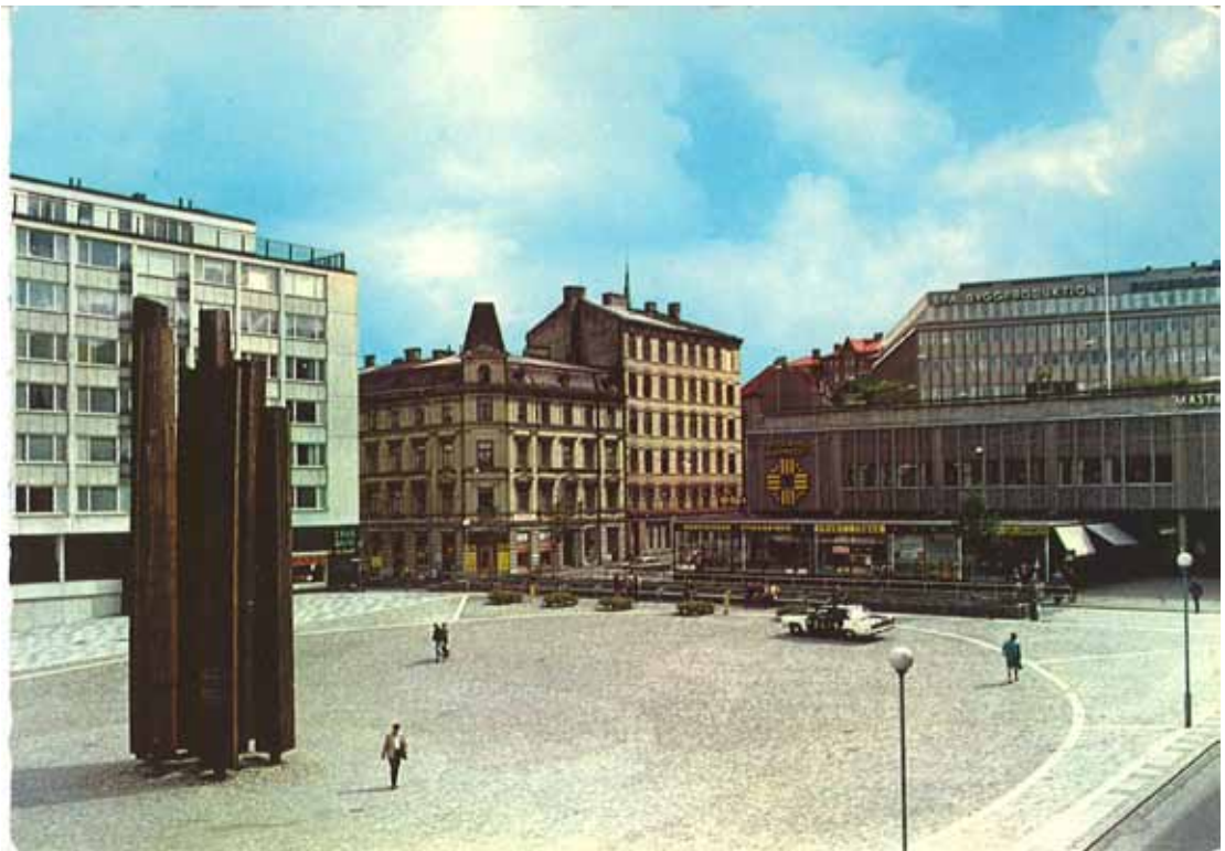
Vykort, 1970-talet, till vänster syns skulpturen "Master" utförd av Erling Torkelsen och de sista resterna av äldre bebyggelse vid Masthuggstorget.