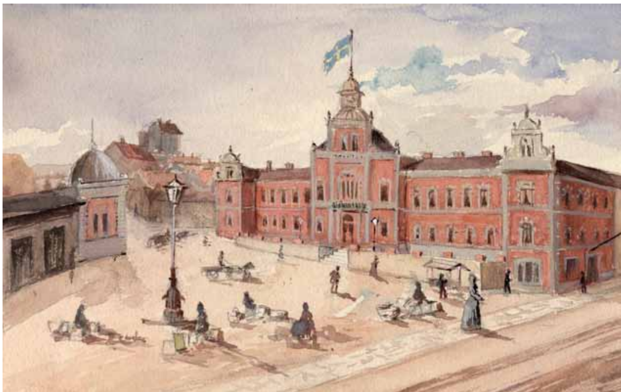
Sjömanshemmet ritades av arkitekten Adrian Peterson, stod färdigt 1886. På bilden syns en flank av basaren och några av husen mot berget. Akvarell: Göteborgs Stadsmuseum, konstnär Ludvig Messmann.

fortsättning: Mastbuggstorget har en lång och bändelserik historia