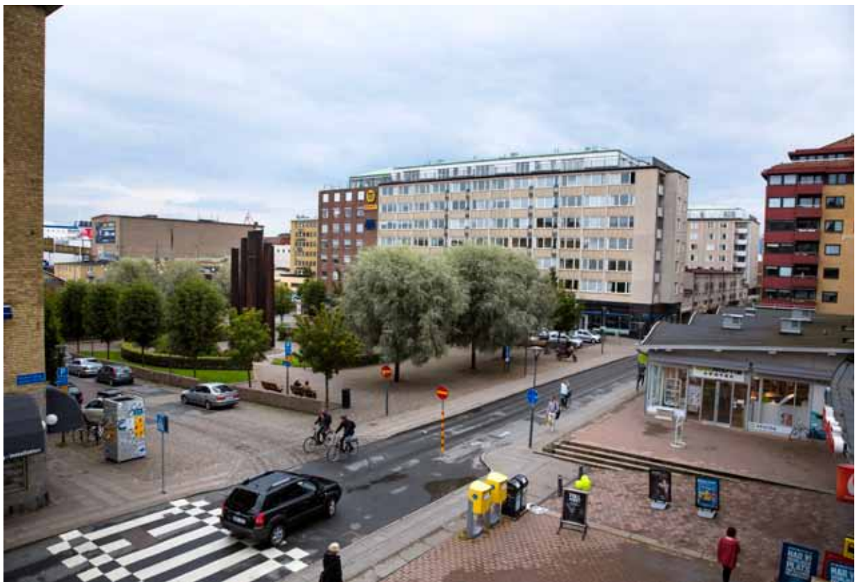
...och så till sist: Dagens torg.