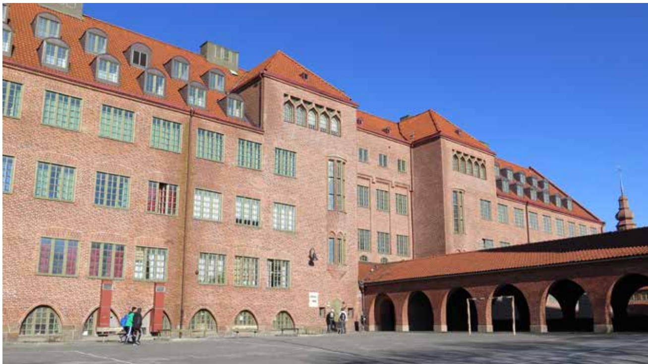
... till Nordhemsskolan