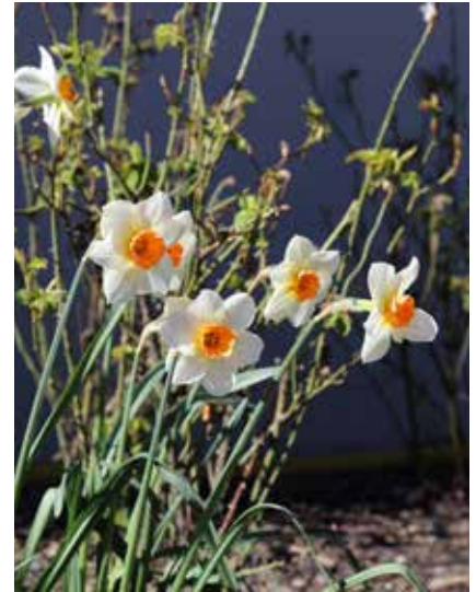
Blommorna illustrerar Gerts arbete med alla bingarna runt husen när fasaderna är klara.