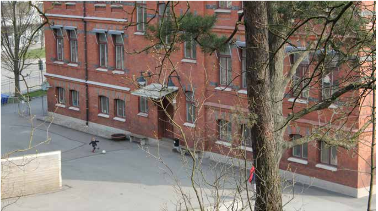
Från Fjällskolan ...