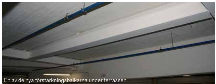
En av de nya förstärkningsbalkarna under terrassen.

Befintliga installationer skall rivas i sin helhet. Anslutningar för ventilation, värme, vatten, avlopp, el och tele skall demonteras och håltagningar skall tätas. Terrassen förstärks under med stålbalkar.