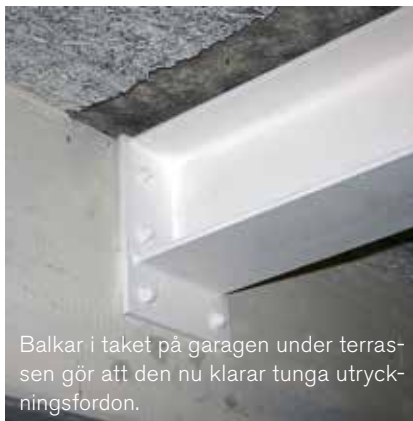
Balkar i taket på garagen under terrassen gör att den nu klarar tunga utryckningsfordon.

Under 2012 påbörjades projektplaneringen och tanken var att sätta igång arbetena redan 2013. Eftersom förvaltning och styrelse inte var nöjda med de anbud som kom in valde man att avvakta och gick ut med en ny förfrågan 2013. Nu blev resultatet bättre, det vill säga inte lika dyrt, och då var det bara att sätta igång.