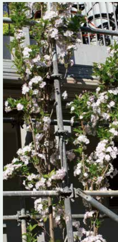
Nu växer det överallt!