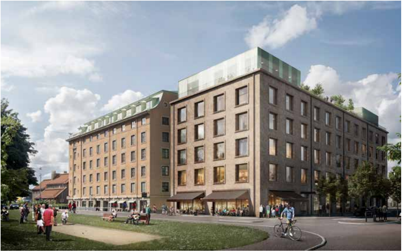
Så här skall det färdiga kontorshuset se ut. Till vänster det gamla Amerikahuset från början av 1920-talet. Illustration: Semrén och Månsson.