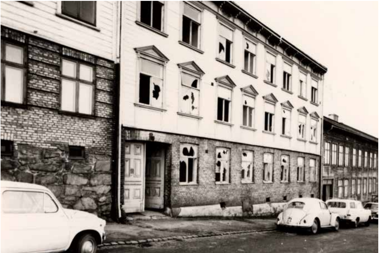
Landshövdingehuset på Johannes Kyrkogata 5, 1964.