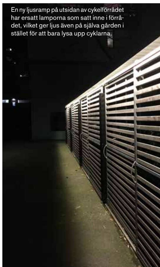
En ny ljusramp på utsidan av cykelförrådet har ersatt lamporna som satt inne i förrådet, vilket ger ljus även på själva gården i stället för att bara lysa upp cyklarna.