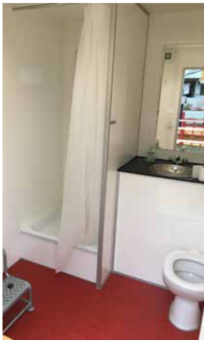
Toalett- och duschrullen är rymliga och det är varmt och skönt därinne.

noveringsperioden, som beräknas pågå till och med 2026.