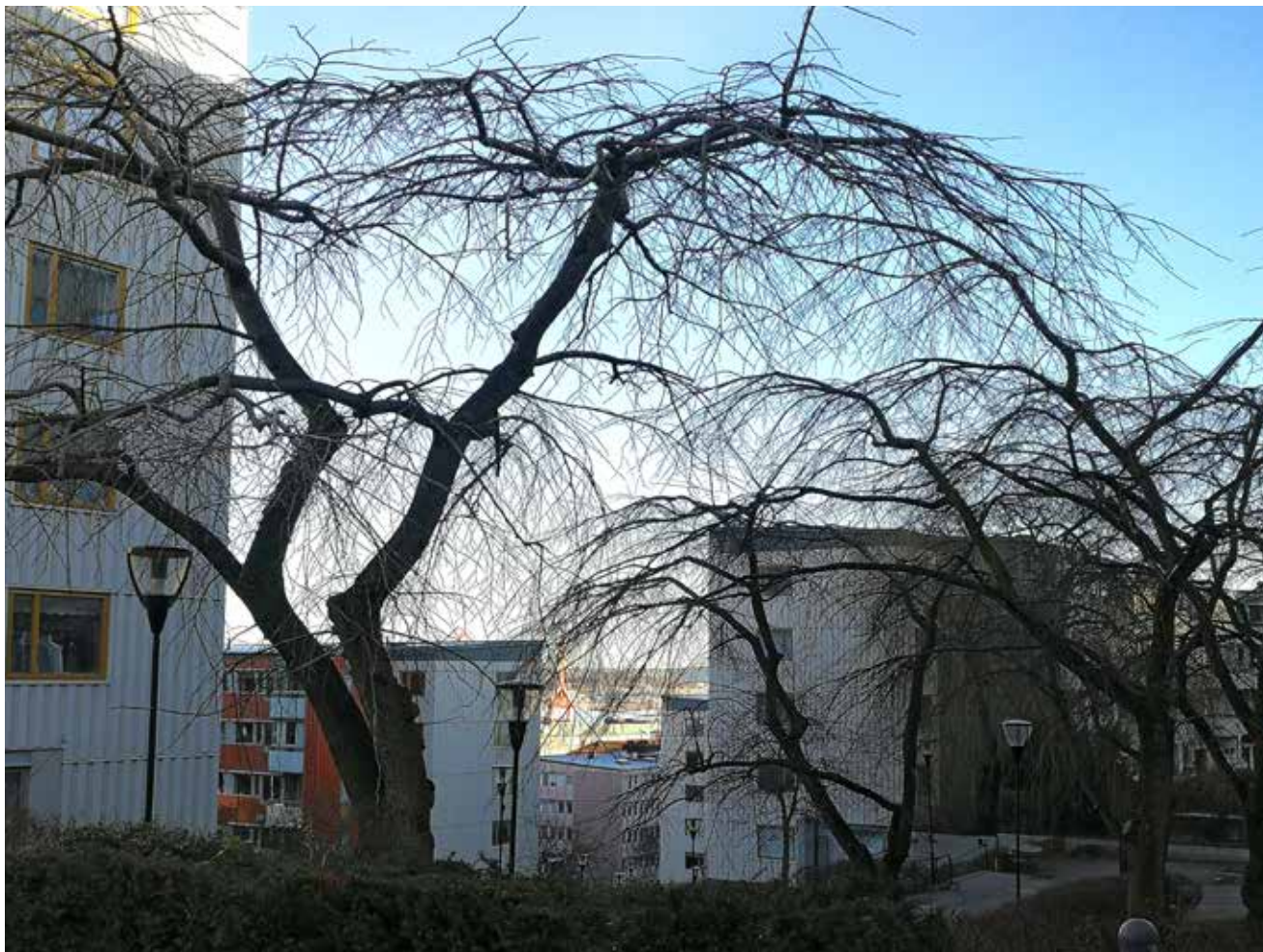
På Masthuggssliden står några fina paraplyalmar.