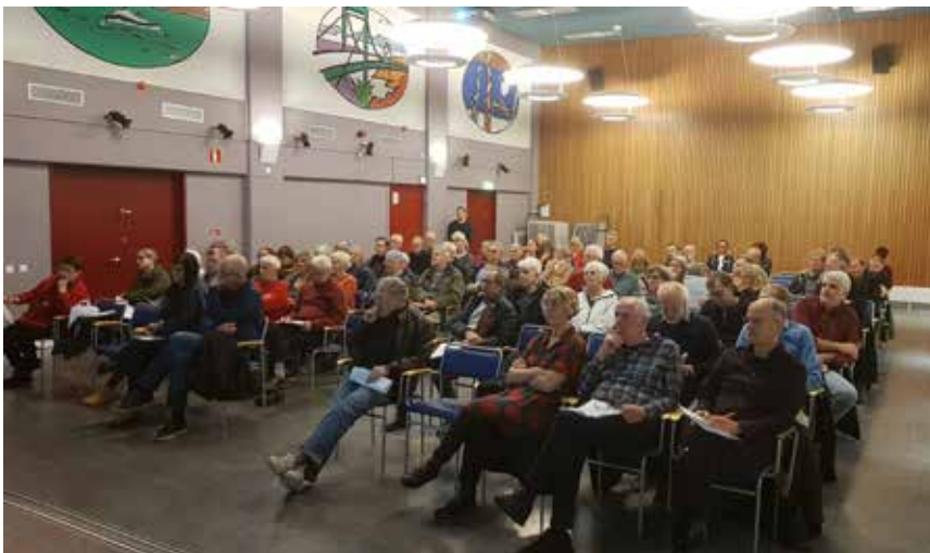
En skara intresserade dök upp på årets budgetmöte. Ingen avgiftshöjning i år, men troligen lägre fram.

En annan fråga gällde vattenskador på grund av utslitna och dåliga rör. Vore det