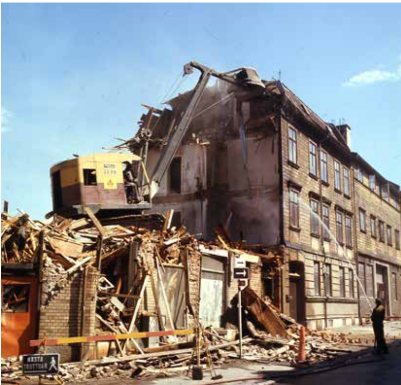
Sanering i Masthugget 1970.

Den nya expansiva staden i rekordårens Sverige ville visa att en ny värld skulle växa fram. I världen bildades FN och på olika platser i Europa återuppbyggdes krigshärjade städer med fokus på välfärd och demokrati.