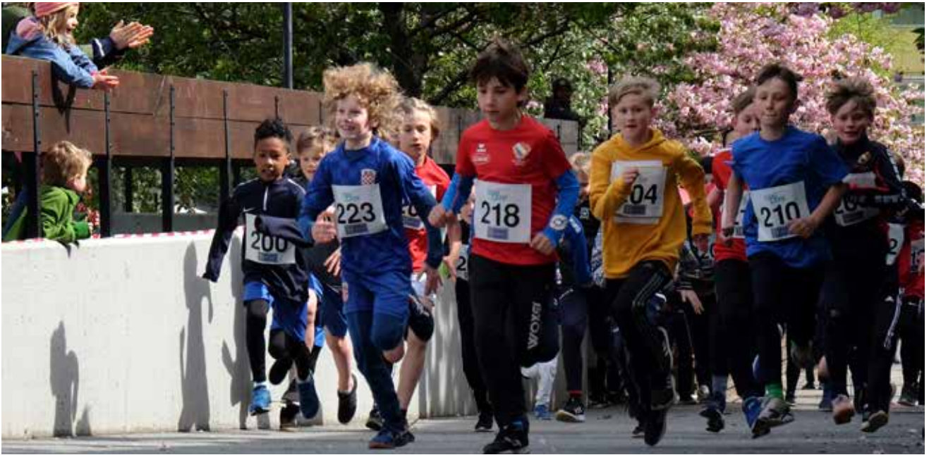
Trots kalla vindar lockade förra årets topplopp 80 deltagare. I år kan vi hoppas på bättre väder.