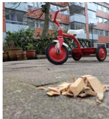
En nackdel med träflis är att det gärna hamnar utanför lådorna.