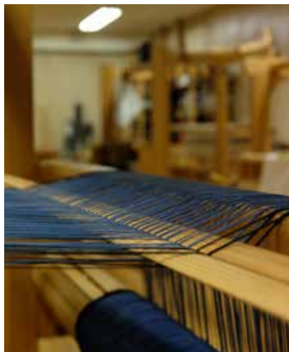
Från vävstugan.

Lokalen ligger bakom allaktivitetsrummet på Masthuggsliden 2, nere vid terrassen. Endast de som väver får tillträde till lokalen via sin tagg.