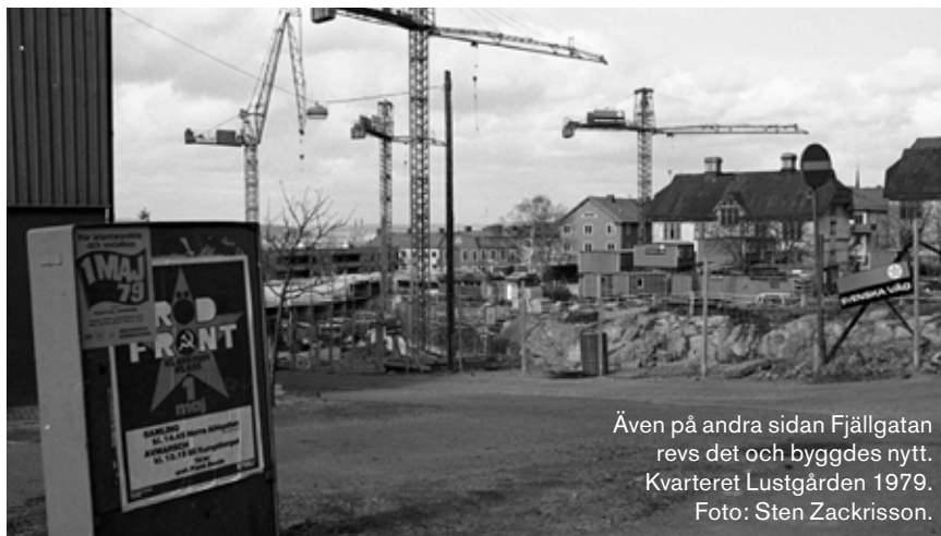
Även på andra sidan Fjällgatan revs det och byggdes nytt. Kvarteret Lustgården 1979.

Man var väl medveten om stadsdelens koppling till stadens rika sjöfartshistoria, men inte stolt över att visa dess ar-