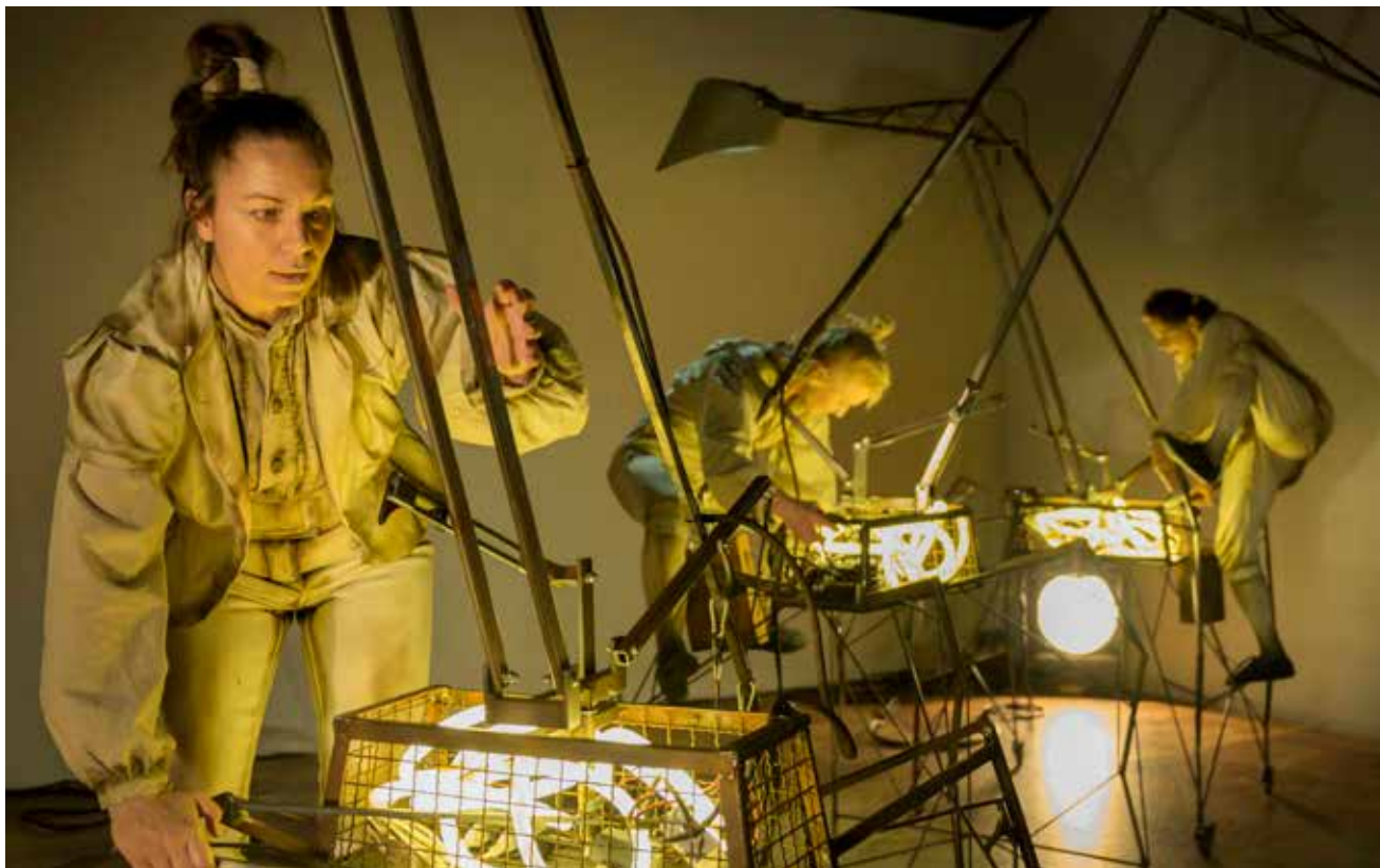
De tre bärarna bär både på minne och på stora kranar i Masthuggsteaterns nya föreställning för barn 4–7 år.