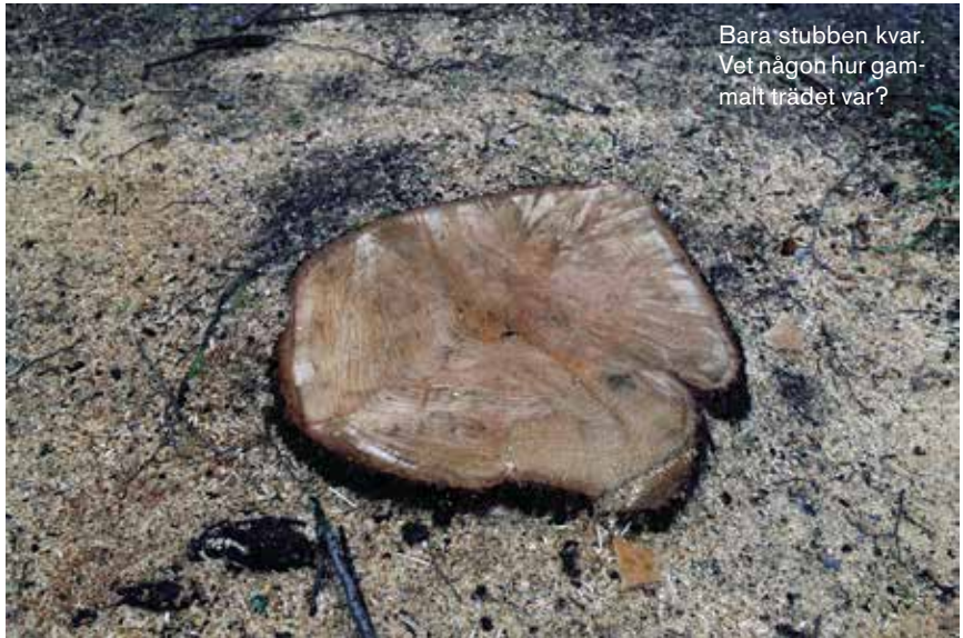
Bara stubben kvar. Vet någon hur gammalt trädet var?

– Gert och jag har haft kontakt med flera personer på Platzer och de inser att