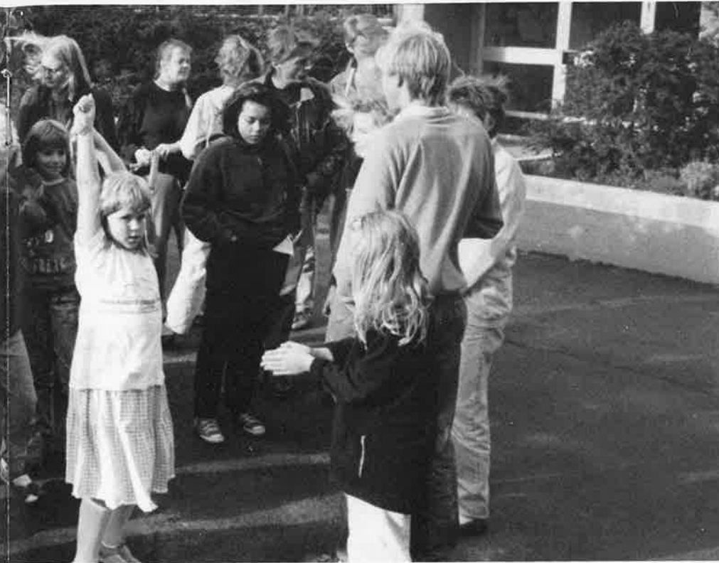
Klamparegatan 11-17 har ett aktivt gårdsliv. Och det är barnens förtjänst!