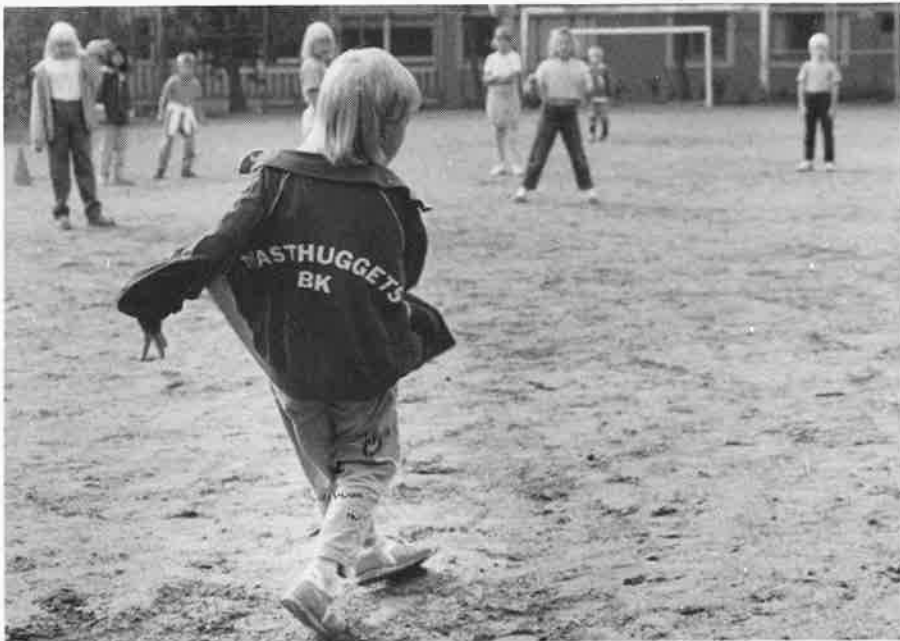
Masthuggets BK, med 150-200 barn och ungdomar i ett tiotal fotbollslag, fyller i år 55 år.