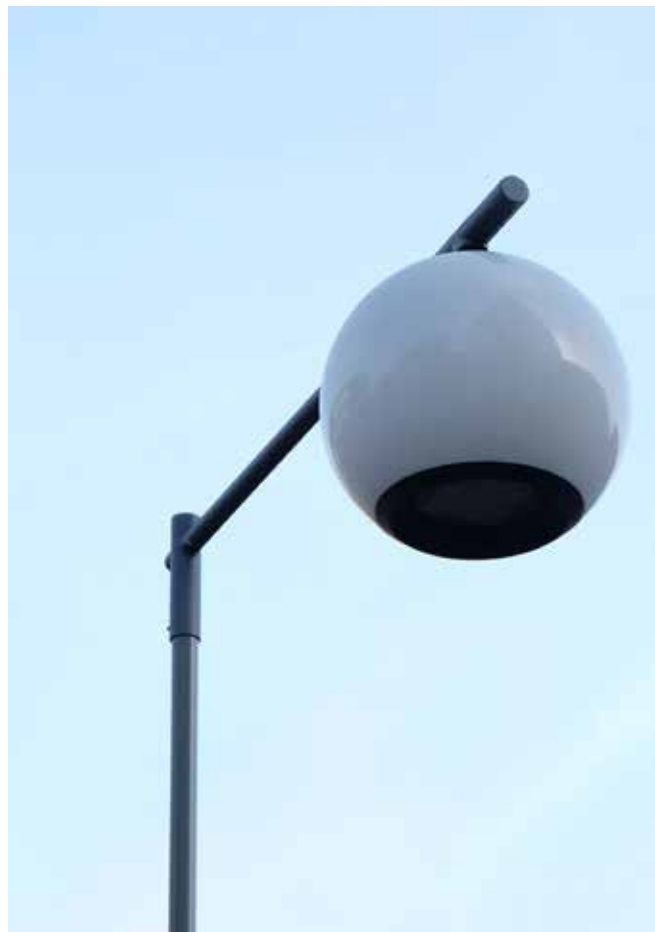
Den här typen av klotlampa kan komma att ersätta belysningen längs gångvägarna. Finns att se på Mattssonsliden 8–16.