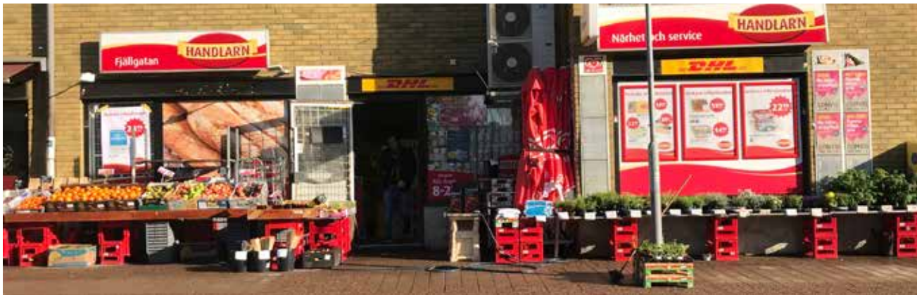
Varm höstsol på servicebutiken med kryddor kring lyktstolpens fot.

På Fjällgatan uppe i Masthuggets höjder kan man med lite drömskt sinnelag ana något av en biblisk anknytning.