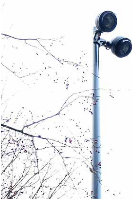
Lekplatsbelysning som finns uppsatt på Klamparegatan 11–17.