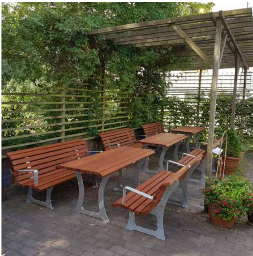
De nya utemöblerna på Rangströmslidens gård

har visat sig att det finns kryphål som katterna kommer igenom.