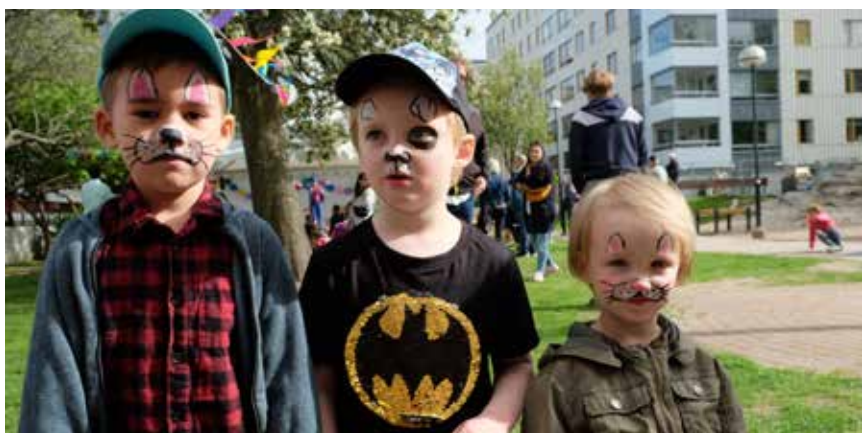
Visst blev de fina!