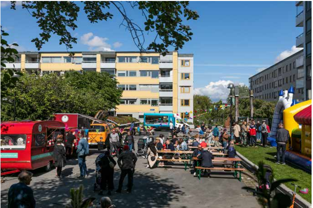
Tusentalet människor deltog under Masthuggets Dag. Solen sken men blåsten var kall, särskilt senare på kvällen.