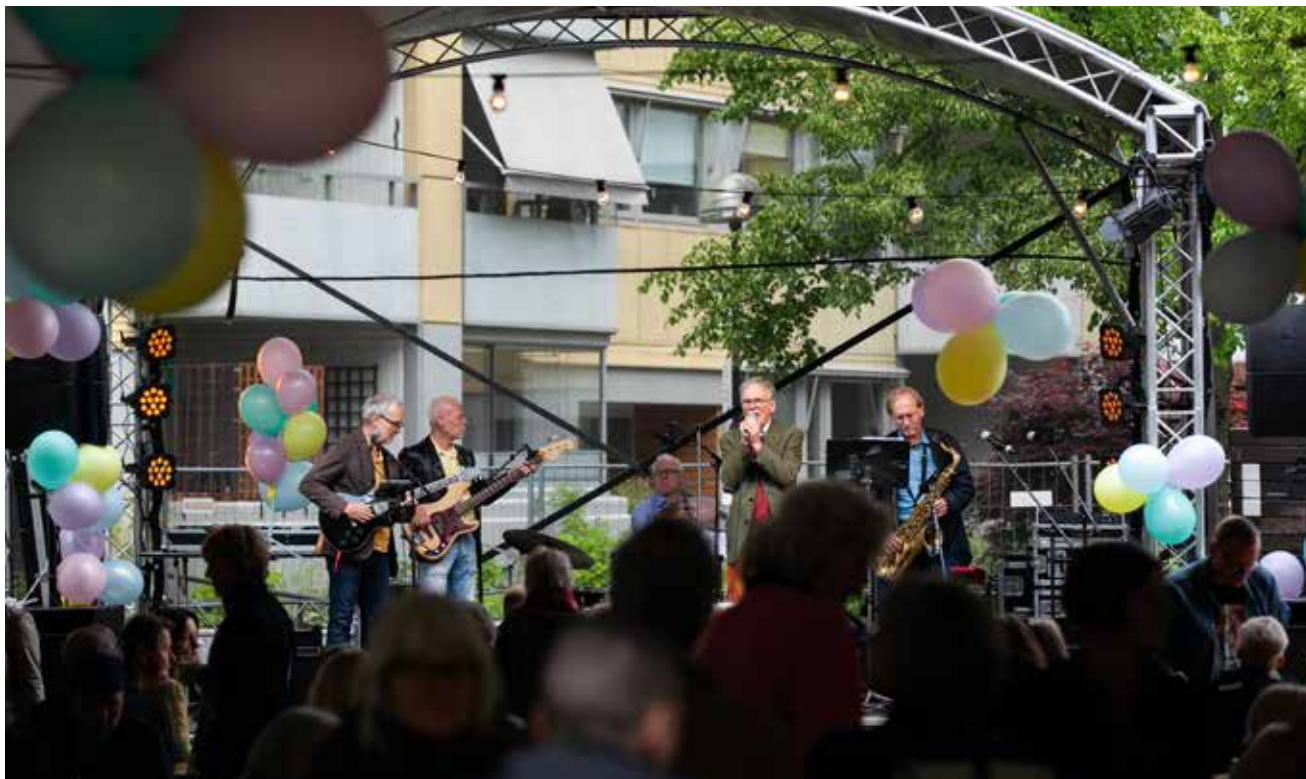
Bandet Stackars pojkar bjöd på svängig musik som lockade till dans.