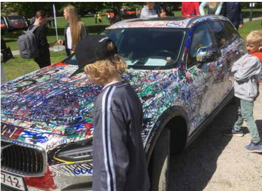
Att få klottra med tuschpennor på en bil var populärt.