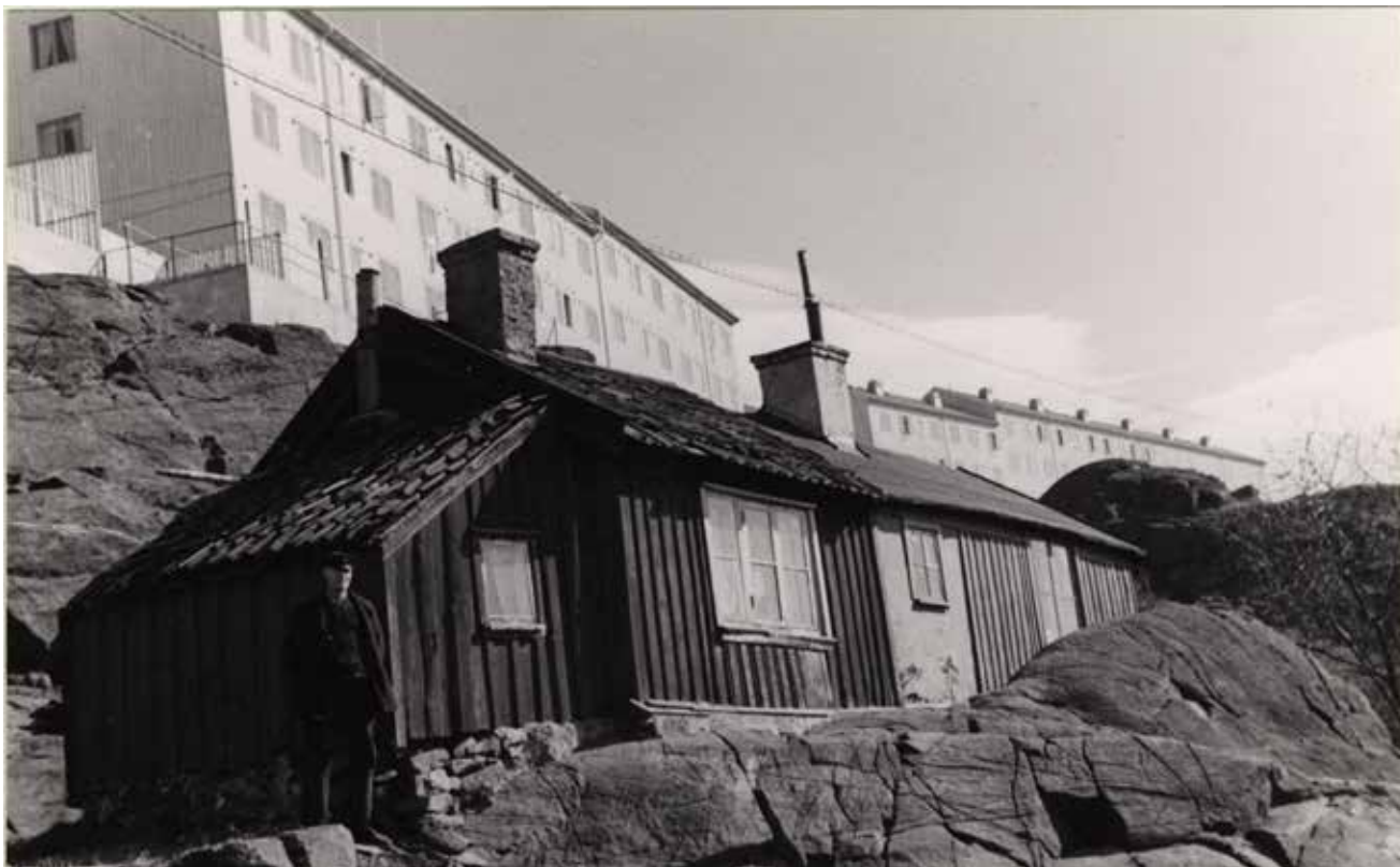
Den enklaste stugutypen fanns vid Stigbergets fot till 1940-talet. På berget ser man nybyggda HSB hus. Arkivfoto Göteborgs stadsmuseum (Ghm 128:6).