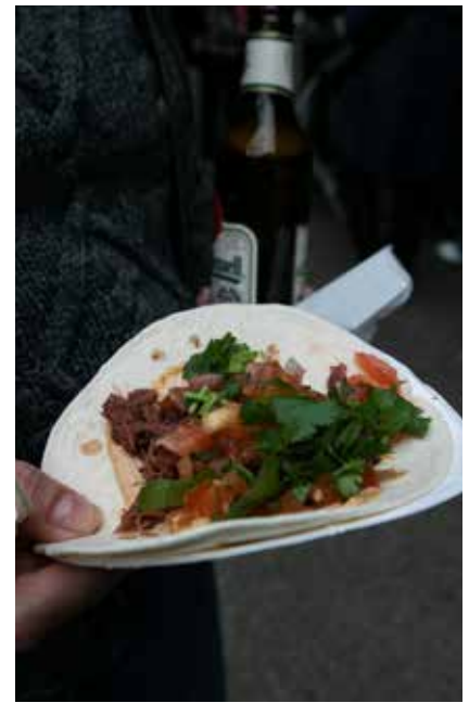
Massor av matmums. Den mat som erbjöds var mycket populär.