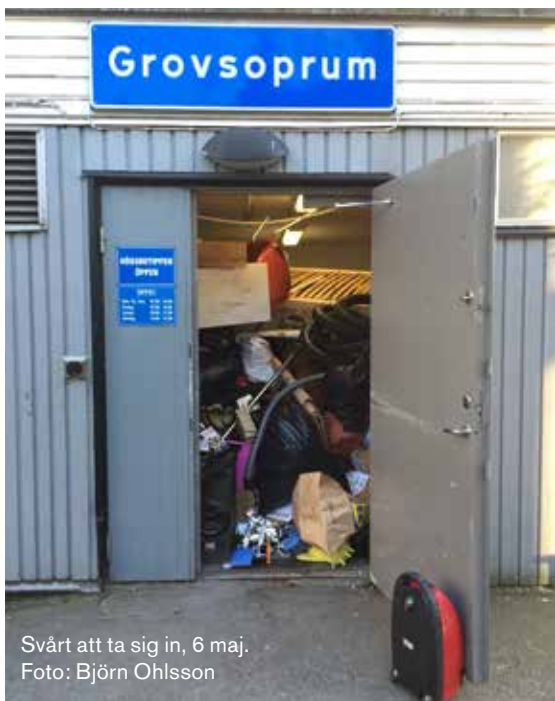
Svårt att ta sig in, 6 maj.