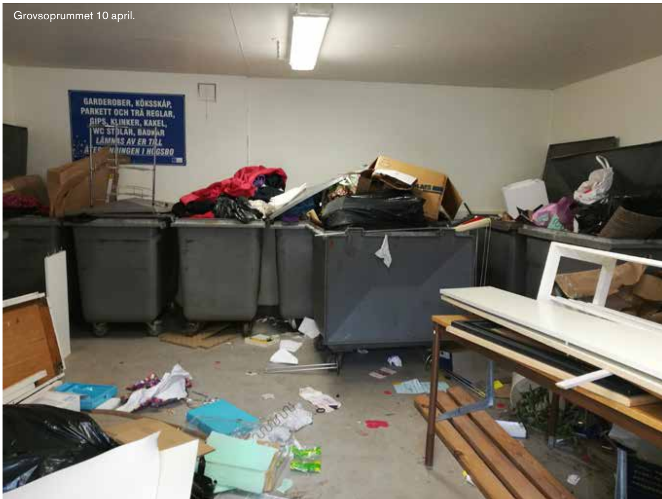
Grovsoprummet 10 april.