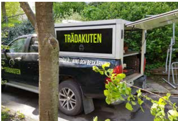
Almen vid daghemmet på Skepparegången hade drabbats av almsjuka och fick sågas ned.

D en sjuka almen vid daghemmet på Skepparegången är borta. Fyra killar, varav minst två arborister, från Trädakuten kom på morgonen den 10 maj och tog ner den. Arboristerna turades om att såga gren efter gren in på bara stammen, som också den rök med.