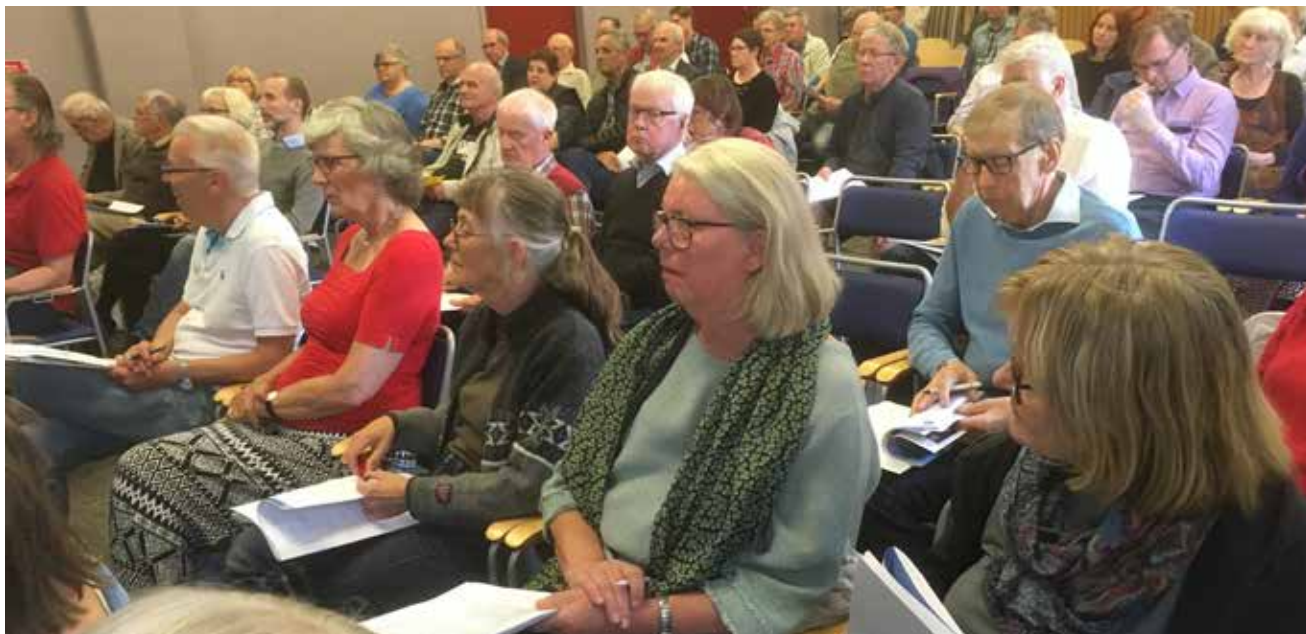
Några av de 86 deltagarna på stämman.