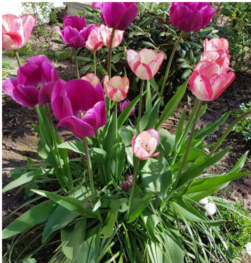
Med lite gödslad jord blir blomsterprakten stor.