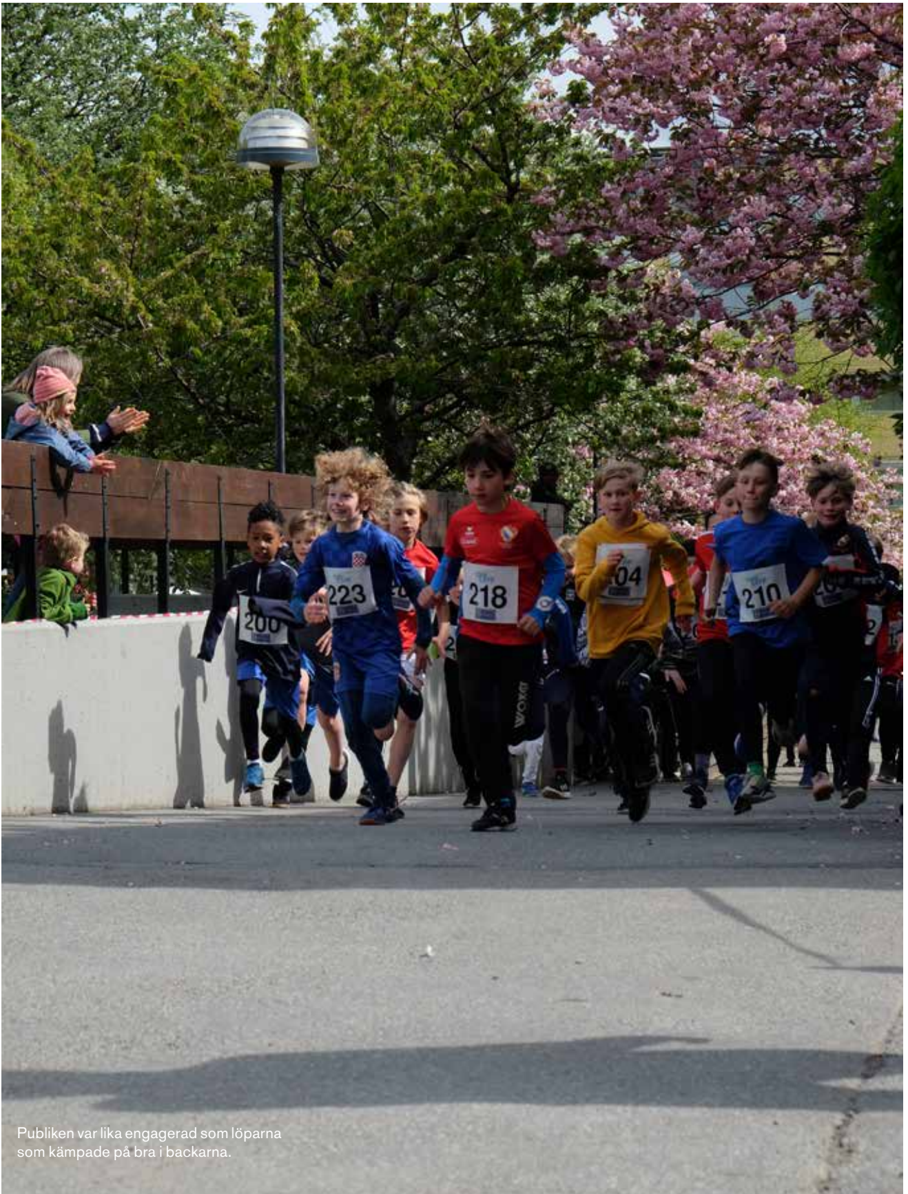
Publiken var lika engagerad som löparna som kämpade på bra i backarna.