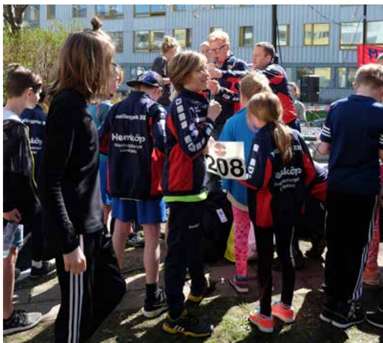
Här delas vinster ut till förväntansfulla unga löpare – deltagarnumret på bröstet var lottsedel och gav allt från CD-skivor till fina ryggäckar i vinst.