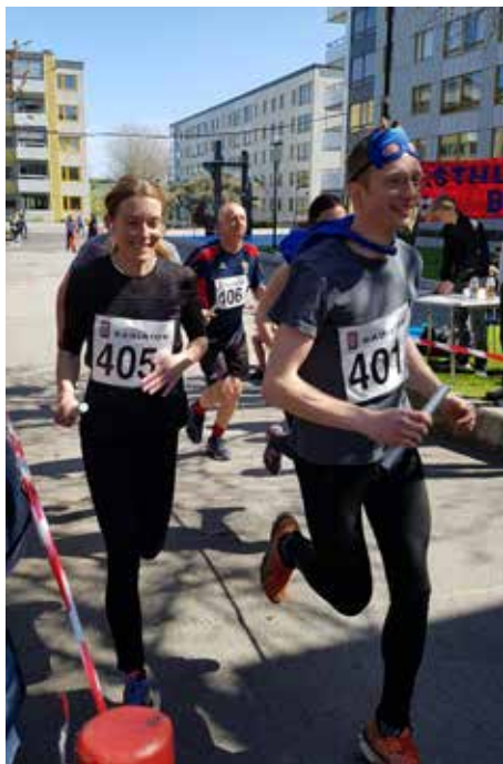
Två lag som ser ut som ett i dagens stafett – de har i alla fall var sin pinne.