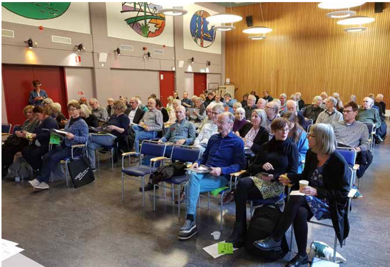
78 medlemmar var närvarande på årsstämman den 26 april.

ning, besluta om att vinstmedlen på dryga 42 miljoner kronor skulle överföras i ny räkning, samt bevilja styrelsens ledamöter ansvarsfrihet för det gångna räkenskapsåret. Då ingen var emot fastställdes dessa punkter på dagordningen.