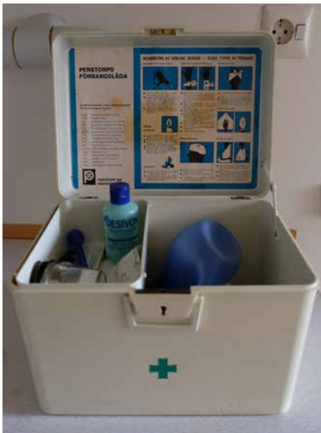
Den då obligatoriska förbandslådan finns kvar.