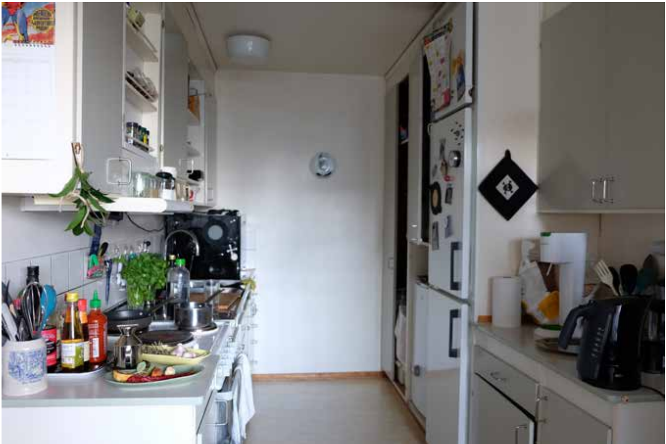
Kakel, belysning, spis och skåpsluckor... Ja, det mesta är sig likt sedan den här lägenheten var nybyggd. Engreppsblandarna var ännu inte standard och husmor kände ensam förväntan på sig att vara den som skulle hålla köksbänkens Perstorsplatta ren.