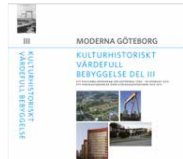
Omslaget till boken. Wappen nås på adressen upptackgoteborg.se .