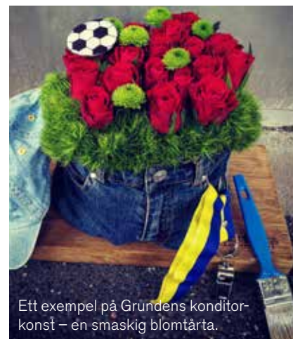
Ett exempel på Grundens konditor-konst – en smaskig blomtårta.

Fotnot: Föreningen Grunden nås på tel 031-730 46 45. Grunden Grand Bazar nås på tel 031-730 46 48, via e-post: bej@grandbazar.se De har också en egen hemsida: www.grandbazar.se och finns på Facebook.