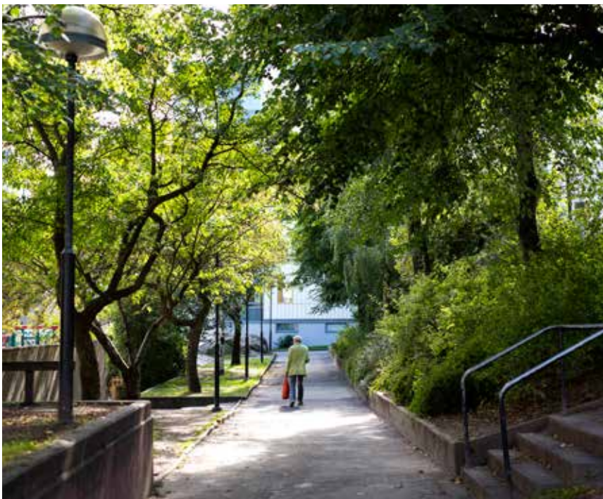
Bilden visar gången mellan Klingners plats och fotbollsplanen. Från Fyrmästaregången 2 till Vaktmästaregången 7 som ses i bortre änden av bilden.

Att få träffa representanter för styrelse