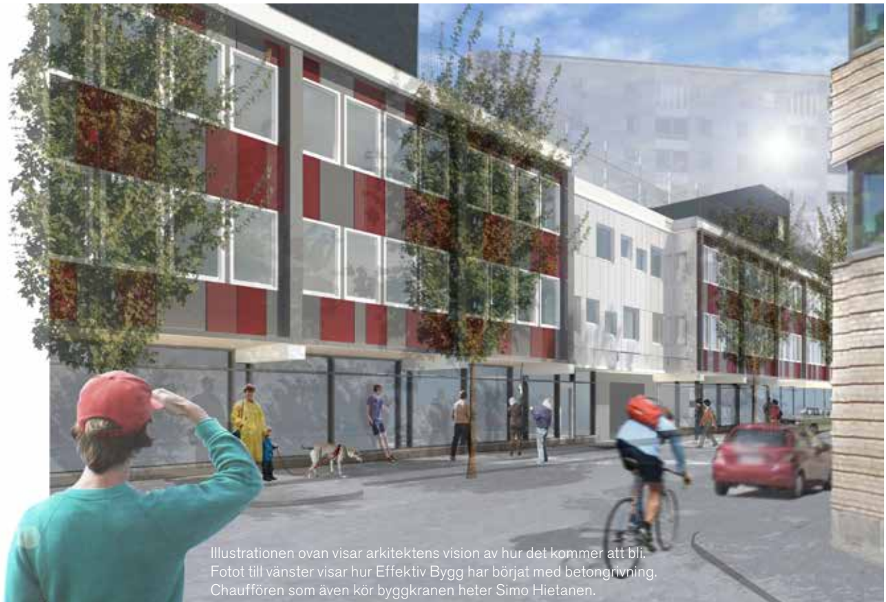
Illustrationen ovan visar arkitektens vision av hur det kommer att bli. Fotot till vänster visar hur Effektiv Bygg har börjat med betongrivning. Chauffören som även kör byggkranen heter Simo Hietanen.