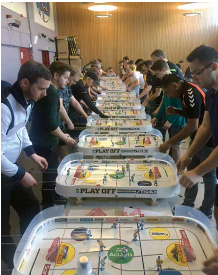
Två rader med 16 bordshockeybord fyllde Stora salen i Masthuggets hus när Göteborg Open avgjordes den 9 april.