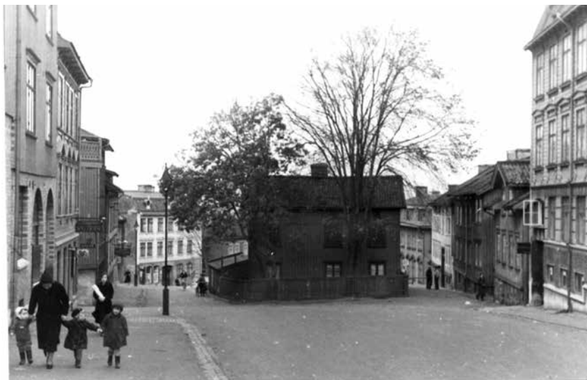
Paradisgatan 5 mot norr. Otto Thulins bild från 1935, vid en inventering inför eventuell sanering i Masthugget samt 1936, efter rivningen.