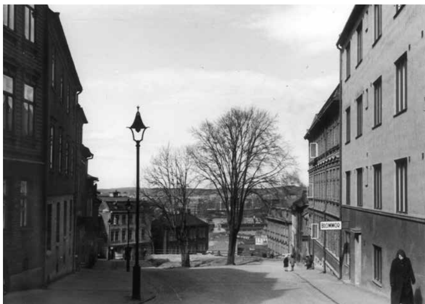
från 1921 kan man se att det låg fyra små hus i rad där Bäckegatan svänger till höger. Den gruppen representerar tiden före urbaniseringen – som en liten by.