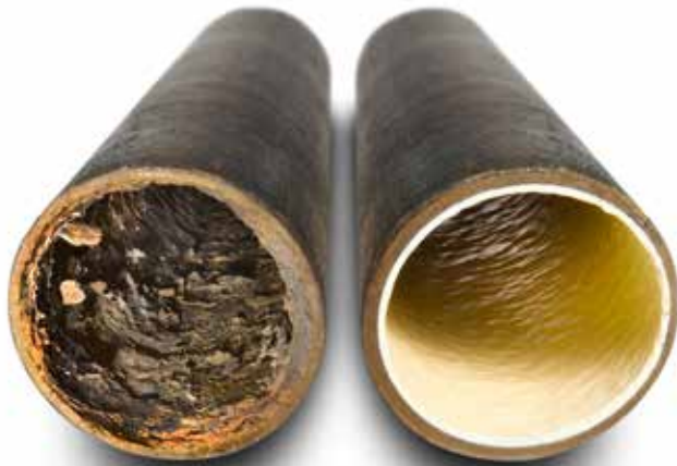
Så här kan ett avloppsrör se ut före respektive efter relining.

ningar kommer att ske med jämna mellanrum genom projektet och påverkar fler lägenheter än de man just för tillfället arbetar i.