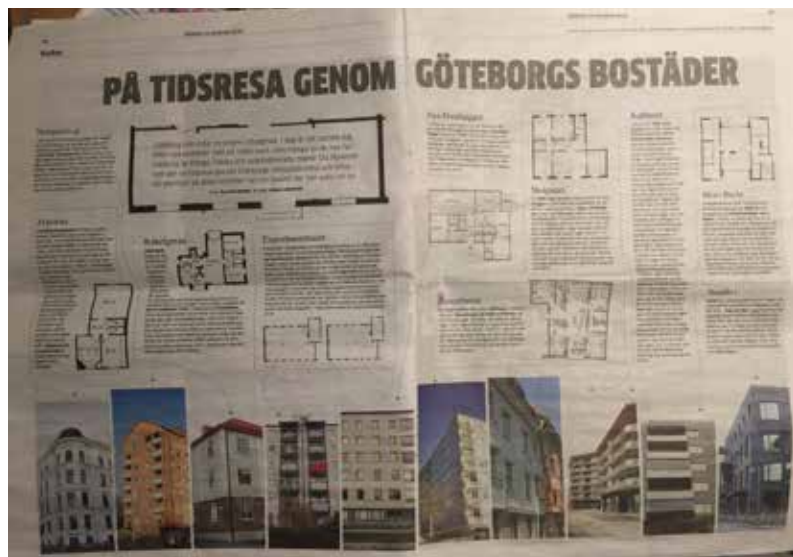
Göteborgs-Posten söndag 14 januari 2018.