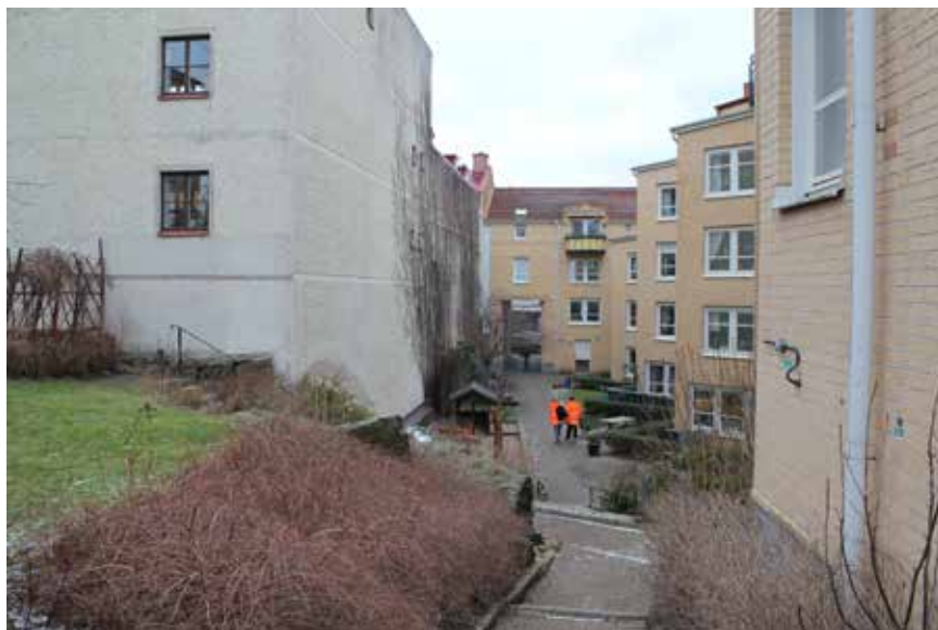
Någonstans vid Repslagaregatan 3 upptäcktes spjutspetsen på ett djup av 40 centimeter ner i jorden.

”kringlan” i sin logotyp sedan 1991. Den kallas tetragram eller Sankt Hanskors. Motivet kommer från orientaliska och bysantiska ornament. I Norden finns symbolen på några av de tidigaste förhistoriska bildstenarna. Figuren ansågs kunna avvärja det onda.