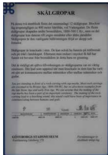
Skålgroparna i Slottskogen. Skylten till höger berättar vad man vet om dessa små gropar.

Ursprunget till namnet och användningen av älvkvarnar är oklar, även för de arkeologer jag har talat med. Skålgroparna karvades in i stenblock och hade antingen något rituellt eller praktiskt syfte. De tillhör gruppen hållristningar och finns lite här och var i Göteborg. Exempelvis finns några i Landalabergen, som också är skyltade.