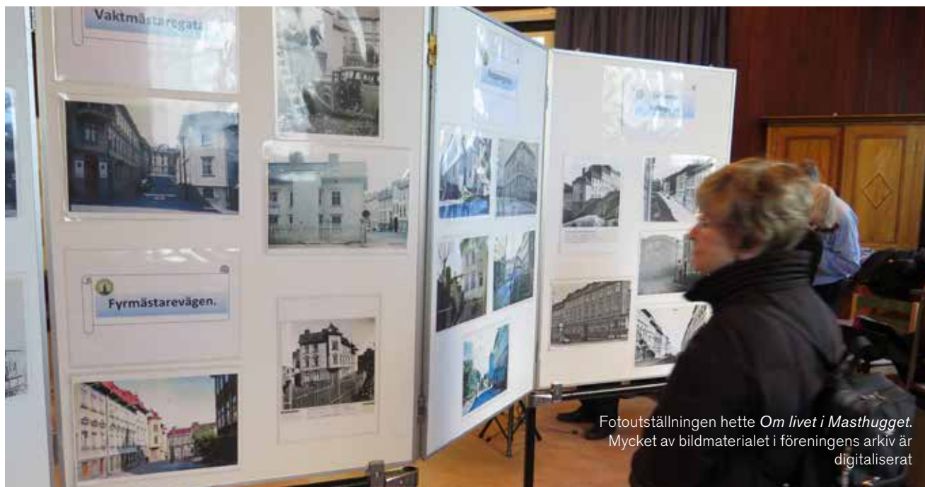
Fotoutställningen hette Om livet i Masthugget . Mycket av bildmaterialet i föreningens arkiv är digitaliserat