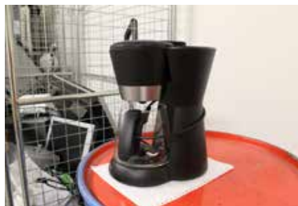
En kaffekokare som står försiktigt placerad antyder att den är återanvändbar.