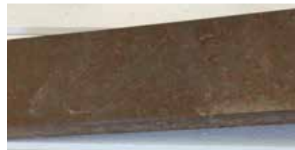
Fönsterbänk av den här typen sökes.

Ursprungliga fönsterbänkar i sten i cirka-måtten, 1 st 98 cm, 3 st 118 cm och 1 st 168 cm, sökes. Kontakta mig: A Ek tel 0704-910592 eller mail ek.eklips@gmail.com.