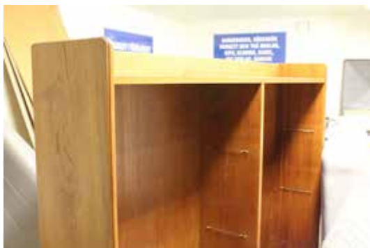
Femtio- och sextiotalets möbler är inne.

Det kryllar av användbara saker i vårt grovsoprum – från soffor till böcker, kläder och barnvagnar. Det vore bra med ett bytesrum, men innan detta har skapats uppmanas alla att annonsera om saker man vill bli av med. Tillsammans kan vi bryta slit och slängattityden.