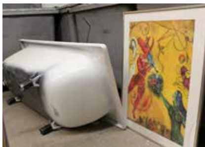
Badkaret var kanske uttjänt men bilden är fin.

Testa annonsering via vår Facebook-grupp: Masthuggsnytt