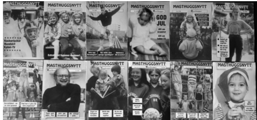
Nu finns Masthuggsnytt 1989–1991 på vår hemsida www.brfmasthugget.se

Tanken på att dela upp föreningen i mindre enheter väcktes igen. Det blev inget med det första gången och inte nu heller. Däremot lanserades idén om att bryta sig ur Riksbyggen och bygga upp egen