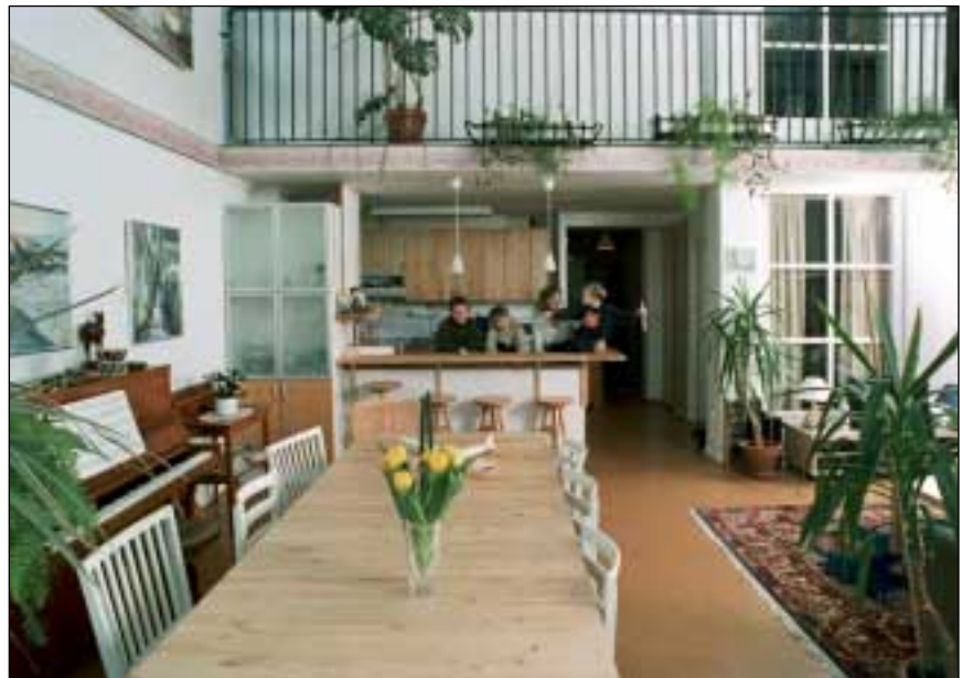
Inte så många kvadrat, men en otrolig rymd. Familjen Bernholdsson trivs i sin unika lägenhet. Här står de i köksavdelningen i det stora rummet i bottenplan.