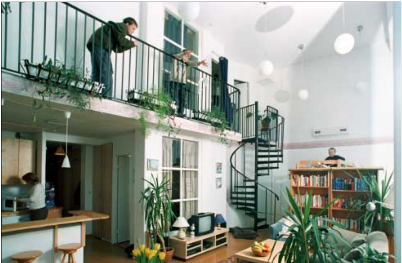
Den vackra spiraltrappan leder upp till tonåringens eget kryp in. Här syns också en av de utrymmessparande loftsängarna. "Köket" till vänster.