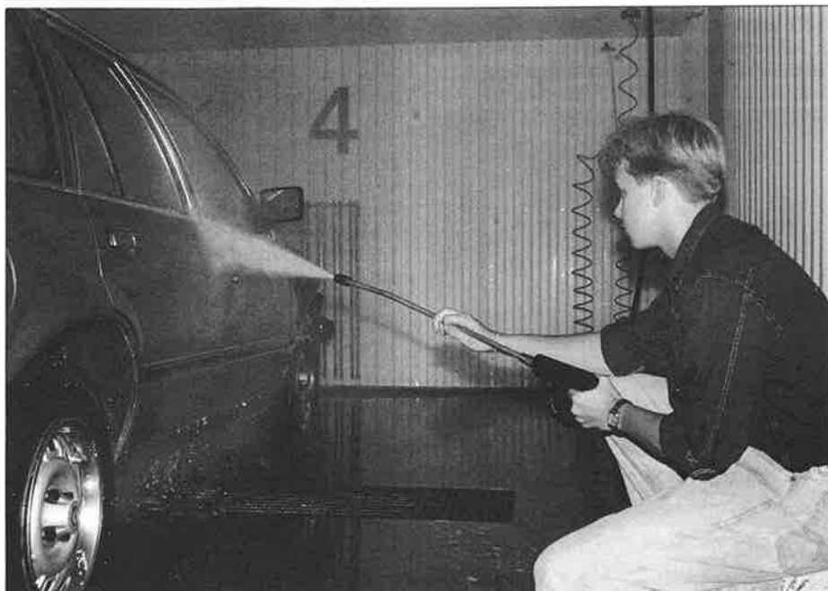
Biltvätten i garaget Andra Långgatan 48 ägs nu av föreningen. Stoppa i ett tiokronorsmynt och spola på.

Undersökande journalistik kräver personlig skyddsutrustning. Se foto på Byggtipssidorna.