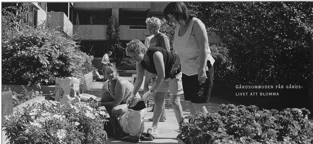
GÅRDSOMBUDEN FÅR GÅRDS- LIVET ATT BLOMMA