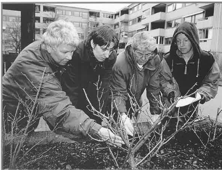
ETT RIKTIGT KLIPP. HUR DET GÅR TILL DISKUTERADES PÅ FÖRENINGENS PREMIÄRKURS I BUSKBESKÄRNING I VÅRAS.