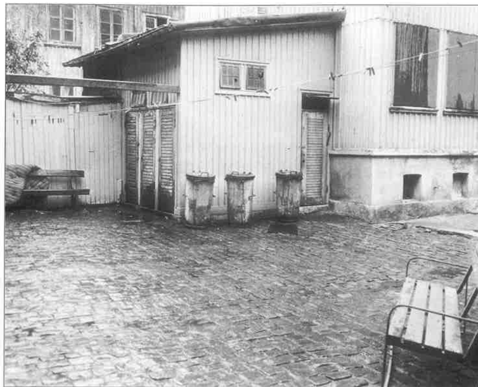
En bit Haga i början av 80-talet, strax innan den riktigt stora rivningsvågen.