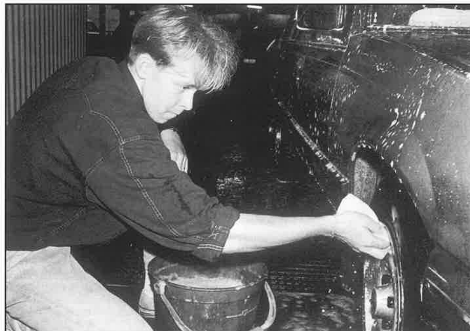
...och här finns också en biltvätt.