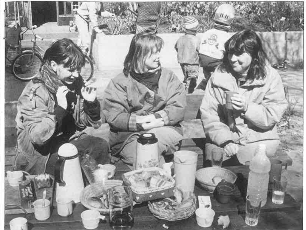
Rabatterna rensades, sandlådan fixades och bänkar målades. Dessutom hör förstas en huttrande fikastund till en äkta gårdsstäddag. Dagen efter Mattssonslidens gårdsdag snöade det ordentligt!