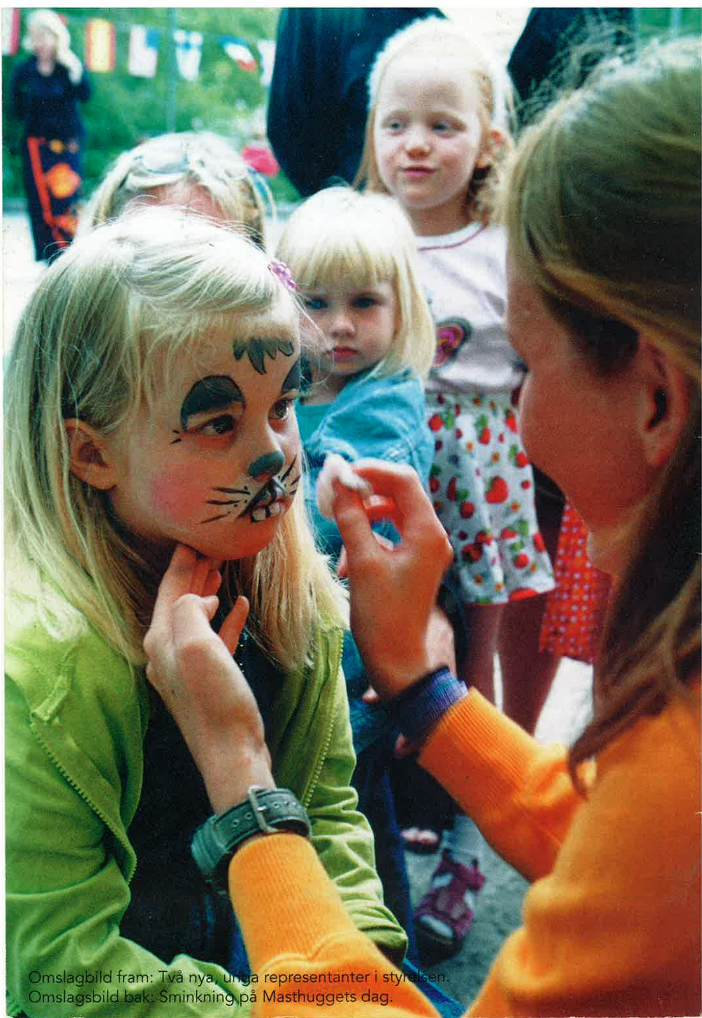
Omslagbild fram: Två nya, unga representanter i styrelsen. Omslagbild bak: Sminkning på Masthuggets dag.