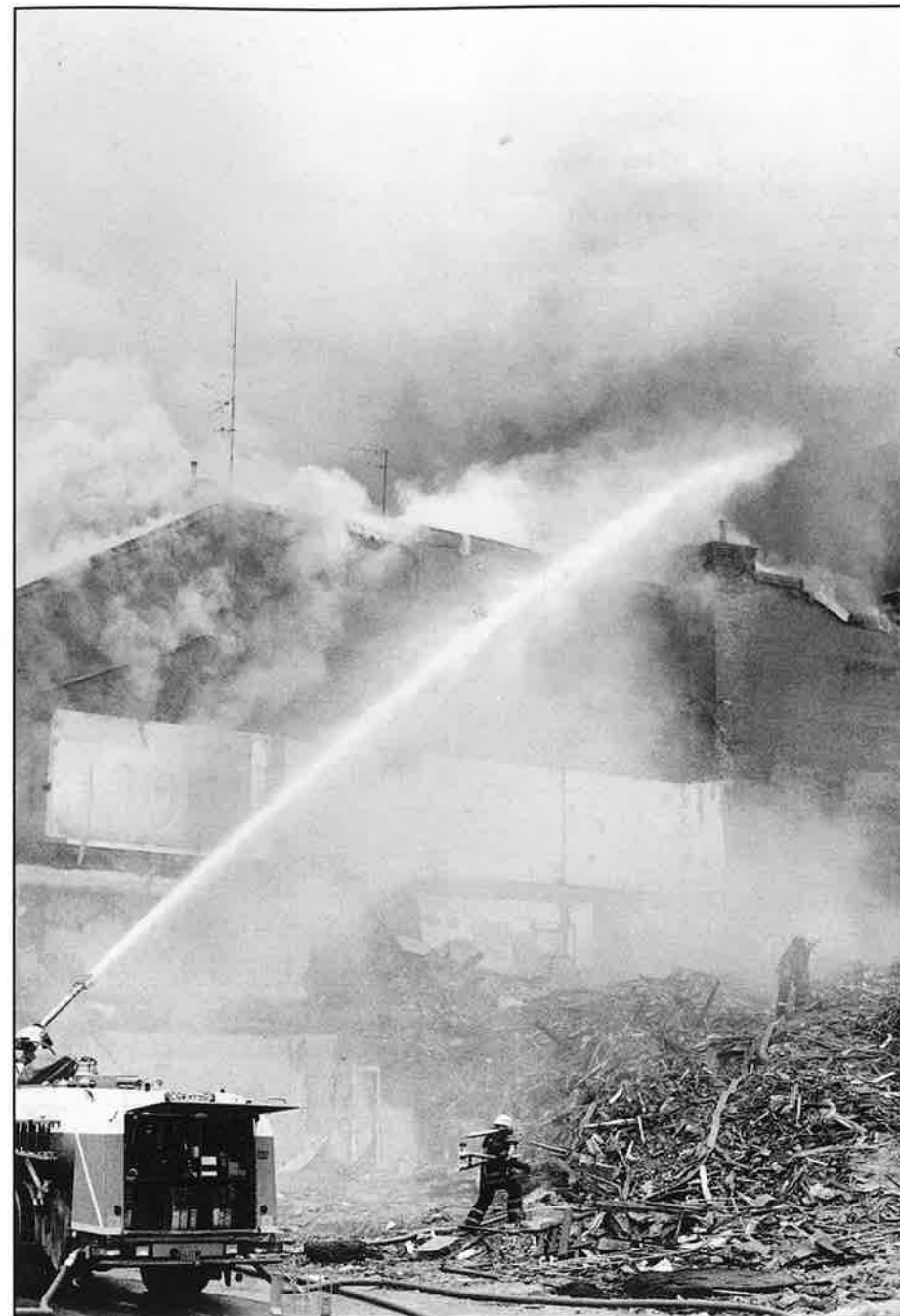
Kvarteret Kostern brinner. Det var våren 1989. Hur länge ska det behöva se ut som ett katastrofområde, undrar SONE, som denna gång lämnat Haga och flanerar omkring hemmavid.