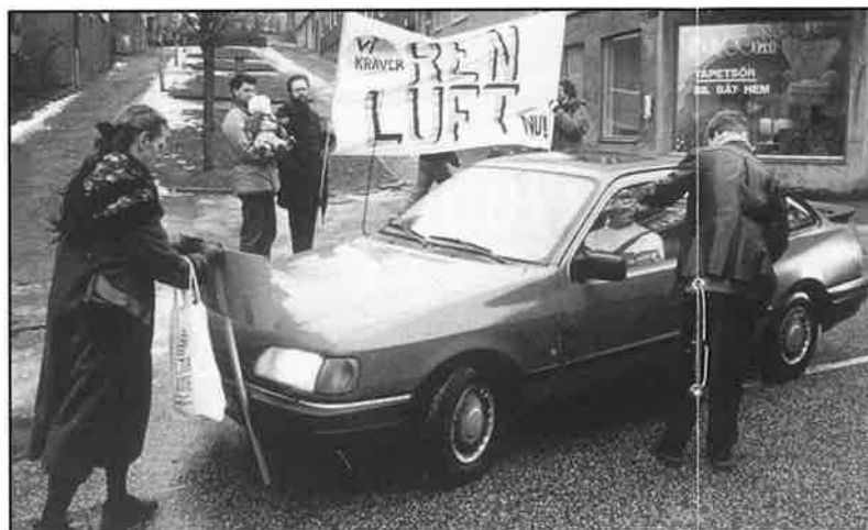
Fjällgatan den 22 februari.