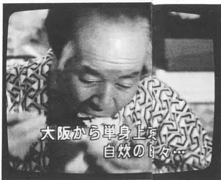
Japansk TV kan du se kvällstid på samma frekvens som Childrens Channel. På bilden till höger ser du ett smakprov på reklam i SAT-1.

Lika många hushåll har bestämt sig för det lilla utbudet som det stora utbudet. Cirka tio procent har basutbudet och lika många har inte bestämt sig än, dvs har inte svarat på den utsända förfrågan.