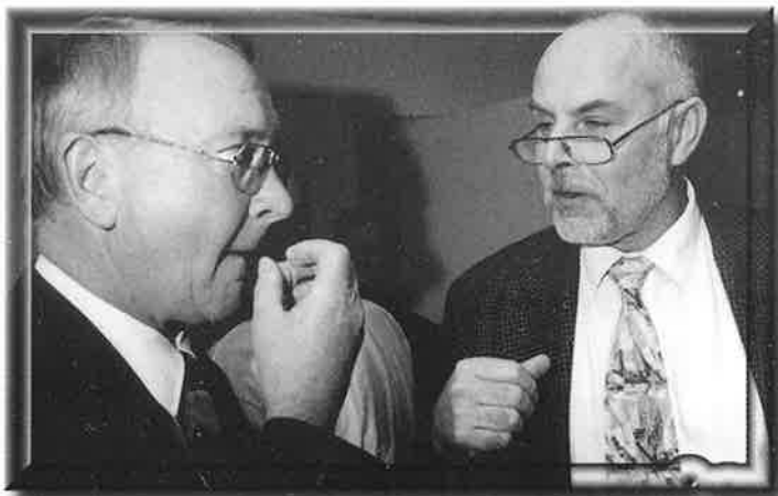
VÄNNER ELLER FIENDER?