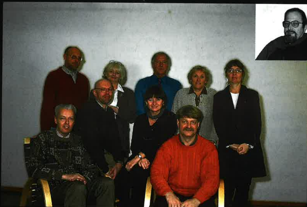
Styrelse- och årsmötesbilder: se omslagets insida