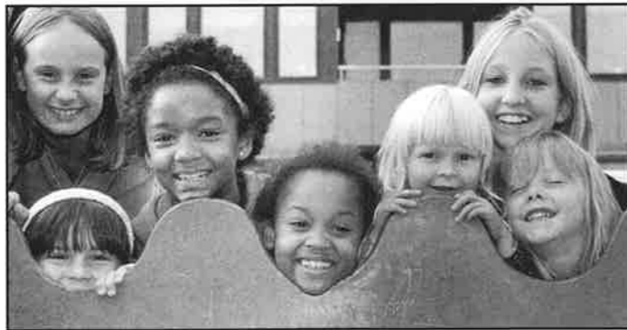
OCH HÄR HAR VI GÅRDARNAS EGENTLIGA HÄRSKARE. JUST DESSA RÅDER ÖVER VAKTMÄSTAREGÅNGEN, FÖRSTA GÅRDEN.