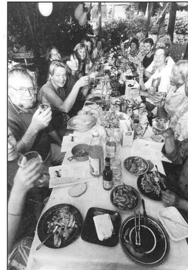
TJO VAD DET VAR LIVAT PÅ FYRMÄSTAREGÅNGEN I SOMRAS. VAR DET NÅN SOM SA NÅT OM KVÄLLENS KLO?