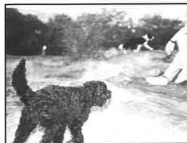
Voff! Gläfs! Kan det vara leverpastej på mackan i korgen? Läs mera om hundlivet på SID 9

Sättning, repro och grafisk form: Dante Typografi, Göteborg Produktion: Tryckeri Tessin, Slotsbergsgymnasiet, Göteborg