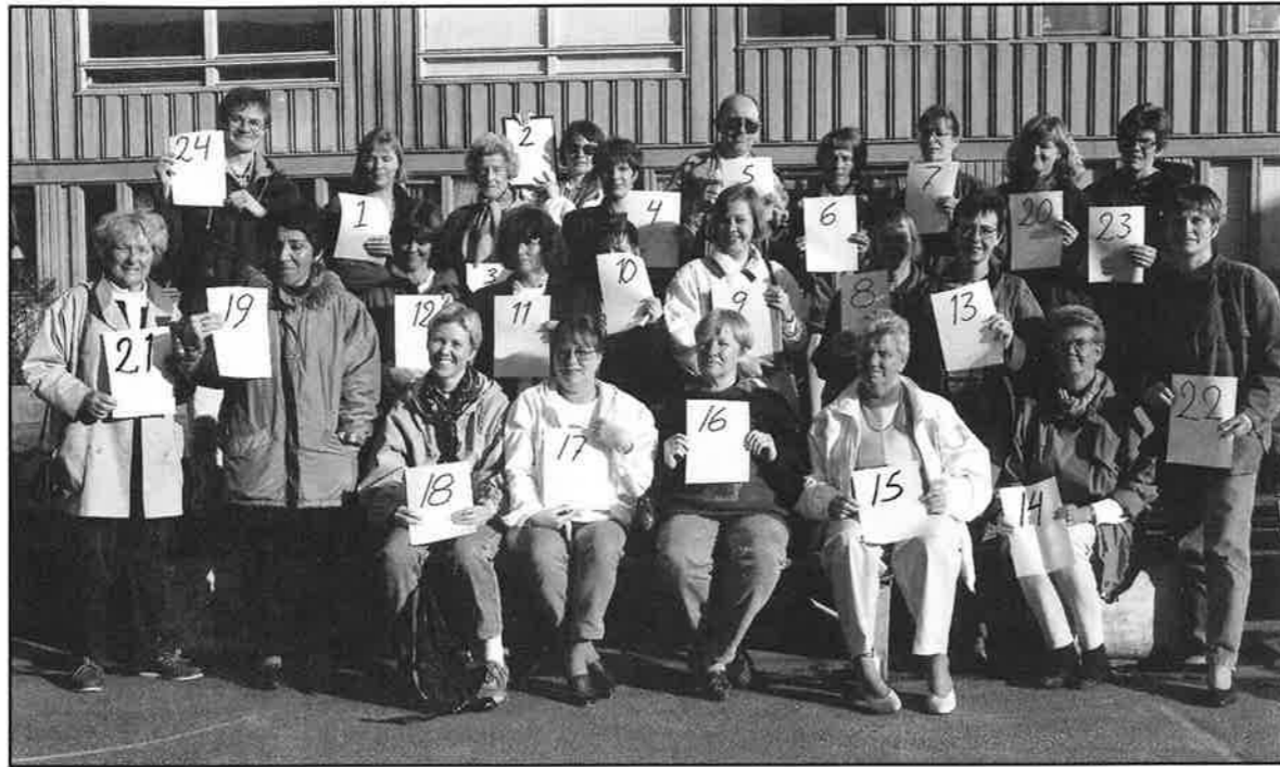
I FÖRRA NUMRET AV MASTHUGGSNYTT DRABBADES BÅDE BILD OCH TEXT OM GÅRDSOMBUDEN AV MISSÖDEN. DÄRFÖR PUBLICERAR VI NAMN OCH UTSEENDE PÅ DESSA GLADA SOLIGA MÄNNISKOR EN GÅNG TILL. TA KONTAKT MED DEM!