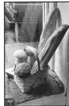
Hur nära är nära och hur långt är långt ifrån – hur långt kan vi gå? Ja, för att handla dagligvaror, alltså. Prisjämförelse för oss som är torsk på mjölk när storköpen har stängt. På SID 6-8