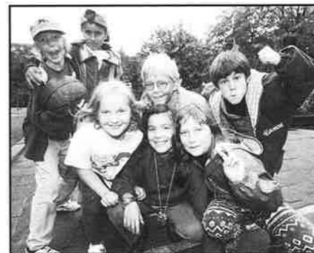
Vi barn från Stigbergsskolan fick inte plats på SID 10-11, så här har ni oss istället