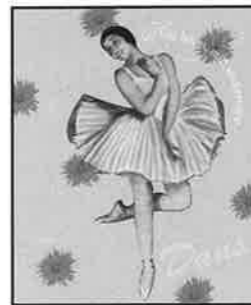
Är det fest på gång eller? Jajamän, Styrelsen ska ställa till med hallballo kring nyår när gamla församlingshemmet fått sitt nya namn. Läs om tävlingen på SID 15

(DEN FINA BILDEN ÄR SKAPAD AV MONNE PÅ VAKTMÄSTAREGÅNGEN)