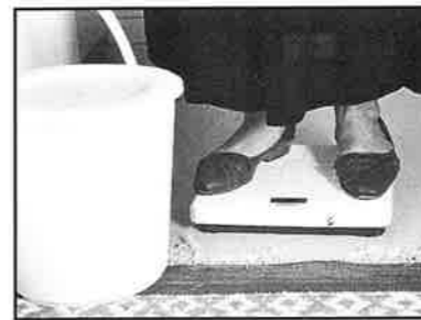
Hallå kolla, vad är detta? Jo, därom kan vi ge besked på SID 13