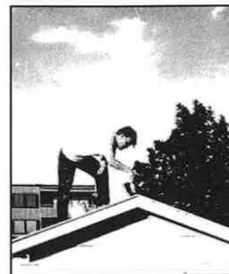
Alldeles uppåt väggarna på Vaktmästaregången, och den här mannen slog till och med klackarna i taket. Fler ansvariga för totalgraffitin på SID 11