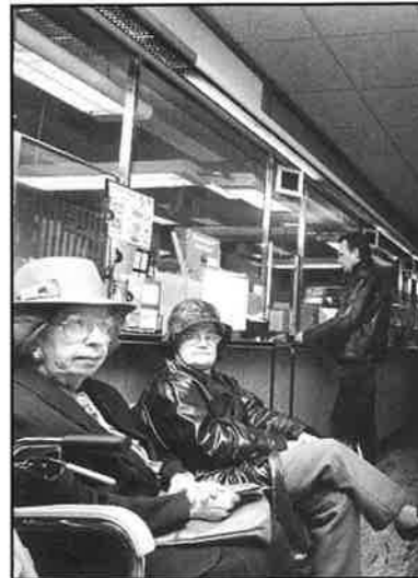
Vad väntar de här damerna på? Något gott? Ja, då lär de få vänta länge. Istället är det ofärdstider som nalkas. SID 4