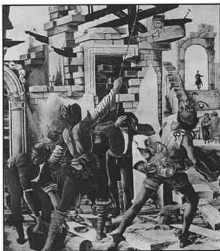
FRANCESCO COSSA: DETALJ FRÅN ST VINCENT FERRES MIRAKLER

Den geologiska undersökningen gav till svar att sättningarna stabiliserats. Det är därför idé att återställa murar och gångar i ursprungligt skick.