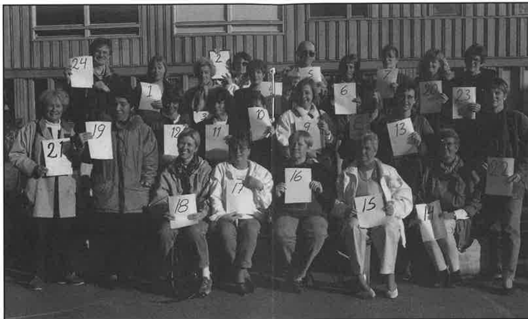
ERA GÅRDSOMBUD HAR FÖLJANDE NUMMER OCH UTSEENDE VID EN LINE-UP NYLIGEN:

BASTARDERNA SJÄLVA. HÖST- REPERTOAR -95 BLIR FÖLJANDE: DEN GULA TAPETEN (CHARLOTTE PERKINS) EN VANSINNIG KVÄLL PÅ TEATERN (TEATER BASTARD) BJÖRNEN (TJECHOV) DESSUTOM GÄSTSPELS- REPERTOAR (MUSIK OCH TEATER)