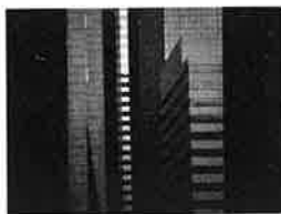
MASTHUGGET = MANHATTAN?