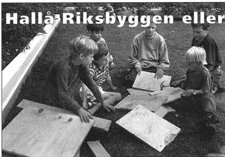
PERSONERNA PÅ BILDEN HAR INGET DIREKT SAMBAND MED INSÄNDARSKRIBENTERNA